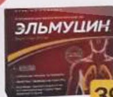
ТАБЛ. 10МГ, №30 ЛП-000896