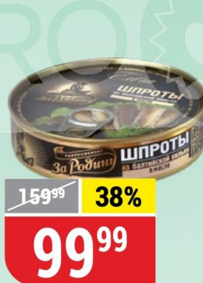
ШПРОТЫ в масле, За Родину, 160 г 166577