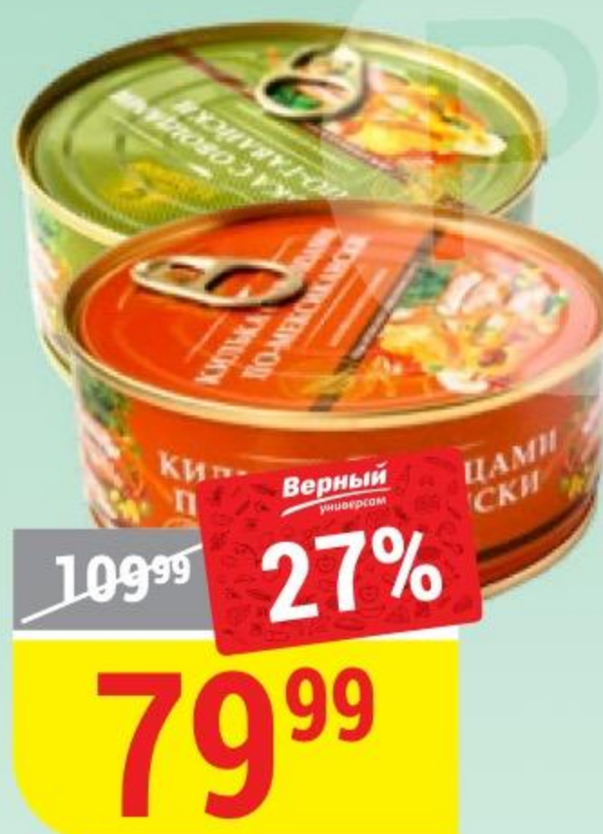
КИЛЬКА ЗА РОДИНУ по-гавайски; по-мексикански, с овощами, 240 г 162738/173525