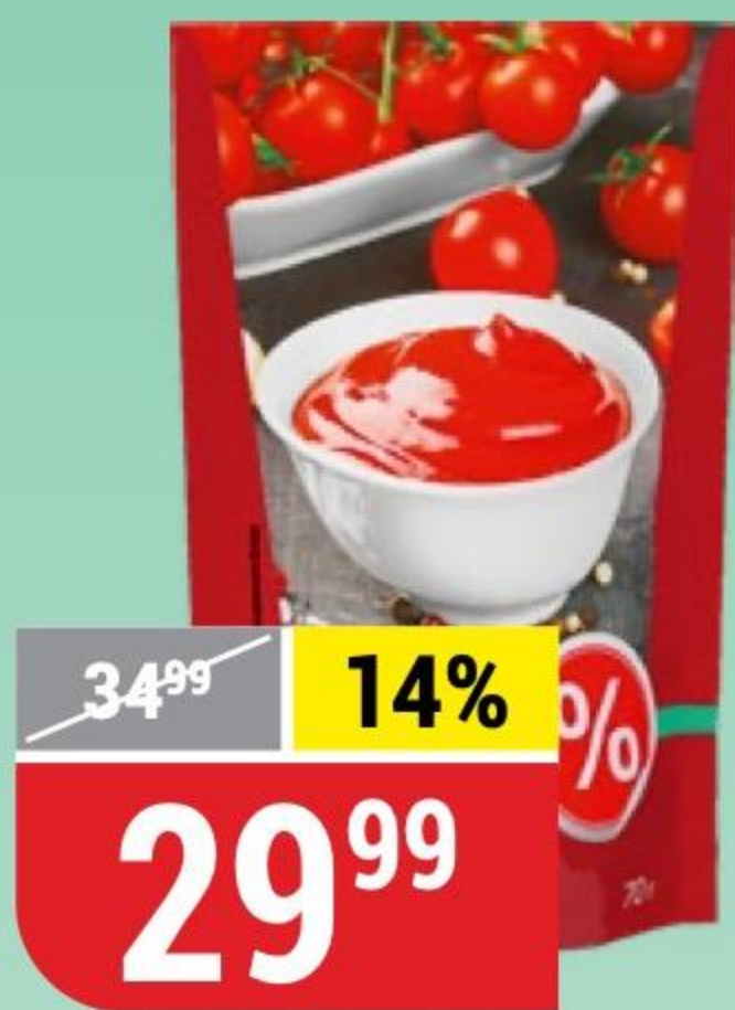
ТОМАТНАЯ ПАСТА % 70 г 172535