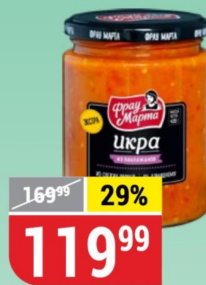
ИКРА ИЗ БАКЛАЖАНОВ Фрай Марта, 430 г 173536