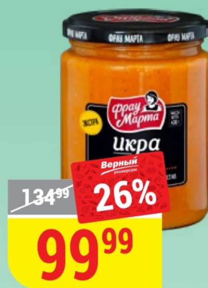
ИКРА ИЗ КАБАЧКОВ Фрай Марта, 430 г 172645