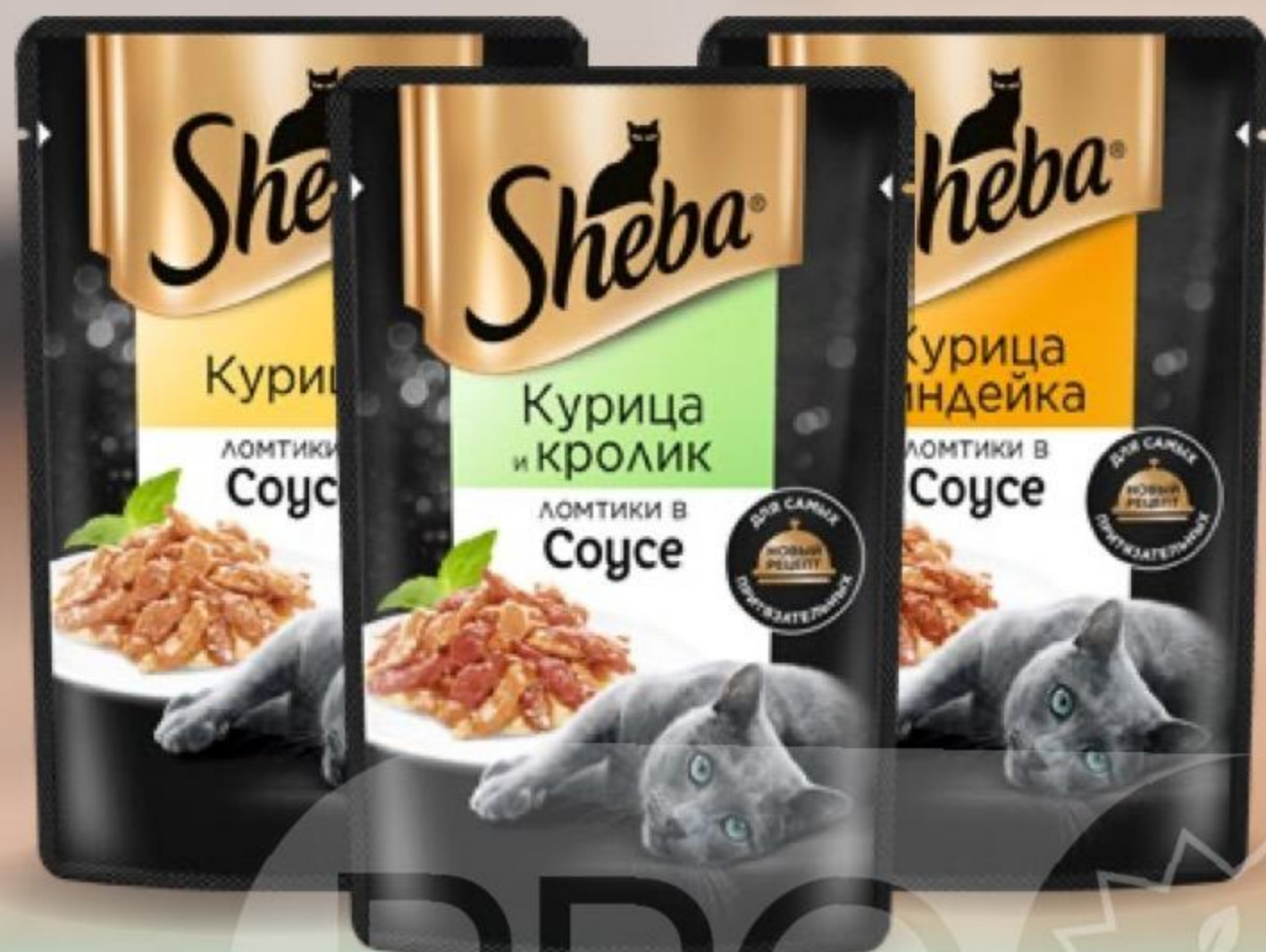
КОРМ ДЛЯ КОШЕК SHEBA в ассортименте, 75 г 164197/164199/164216/164222/164224