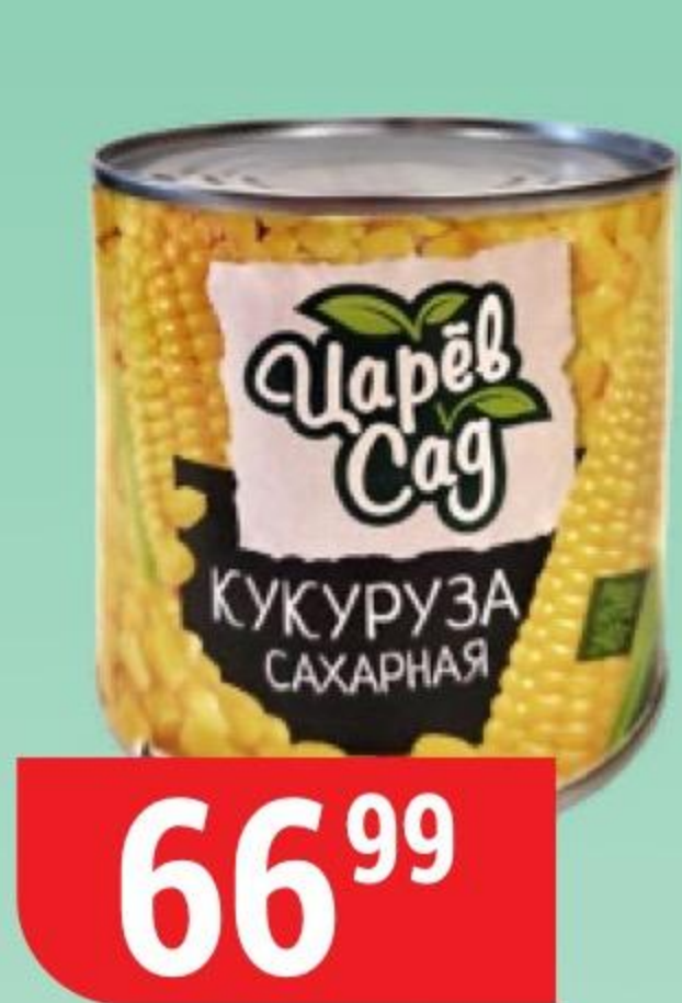
КУКУРУЗА САХАРНАЯ зерна, Царёв Сад, 340 г 173421