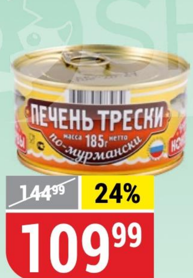
ПЕЧЕНЬ ТРЕСКИ ПО-МУРМАНСКИ Вкусные Консервы, 185 г 121474