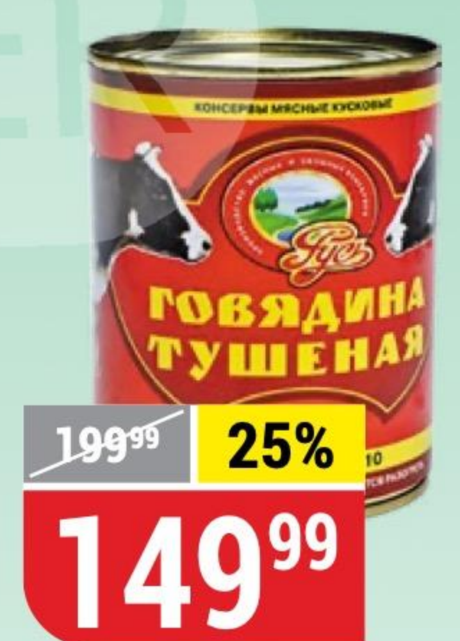
ГОВЯДИНА ТУШЕНАЯ ГОСТ, Русь, 338 г 152220