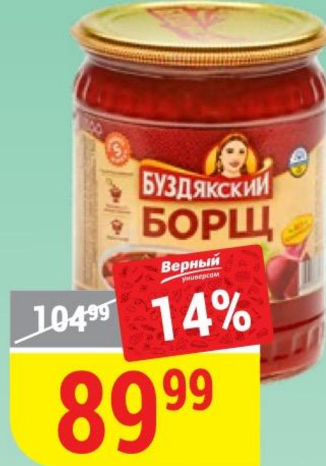
БОРЩ Буддякский, 500 г 158289