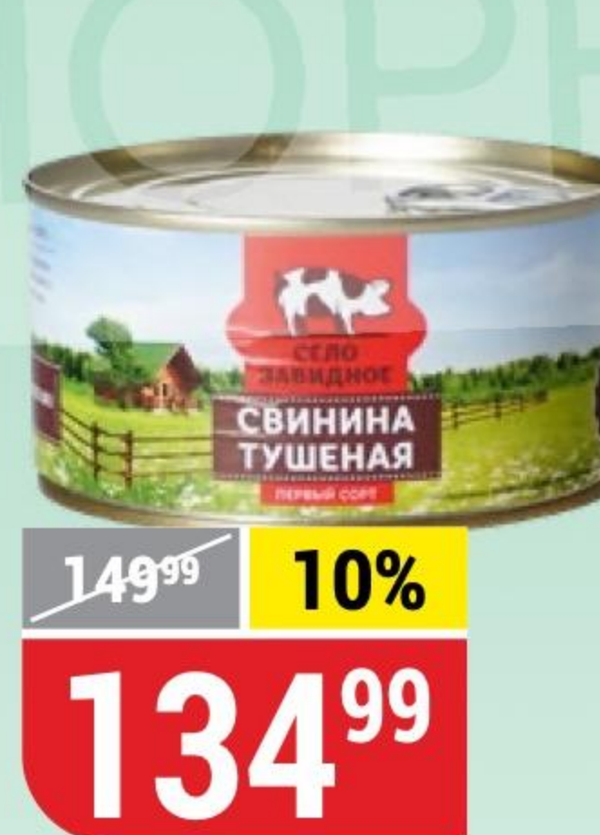
СВИНИНА ТУШЕНАЯ Село Завидное, 325 г 147108