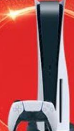
Sony Playstation 5