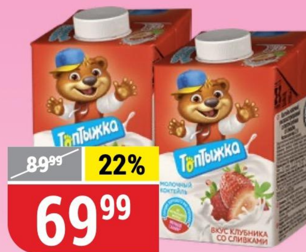
КОКТЕЙЛЬ МОЛОЧНЫЙ ТОПТЫЖКА клубника со сливками; банан, 3,2%, 500 г 168820/169653