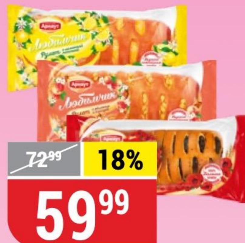
РУЛЕТ ЛЮБИМЧИК в ассортименте, Арнаут, 200 г 140598/142695/127860