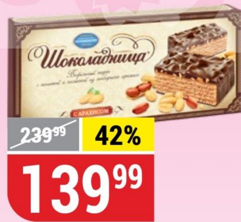
ТОРТ ВАФЕЛЬНЫЙ ШОКОЛАДНИЦА с арахисом, Коломенское, 230 г 170276