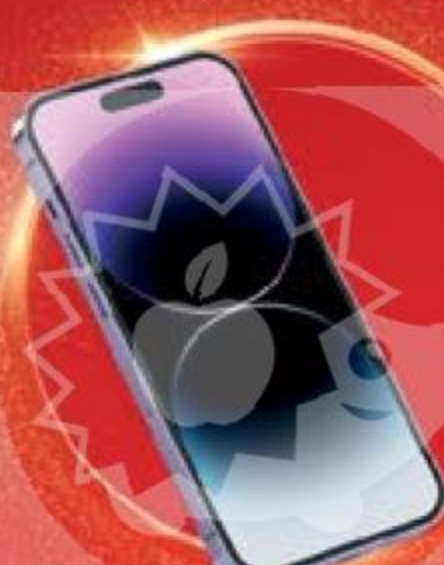
APPLE iPhone 14