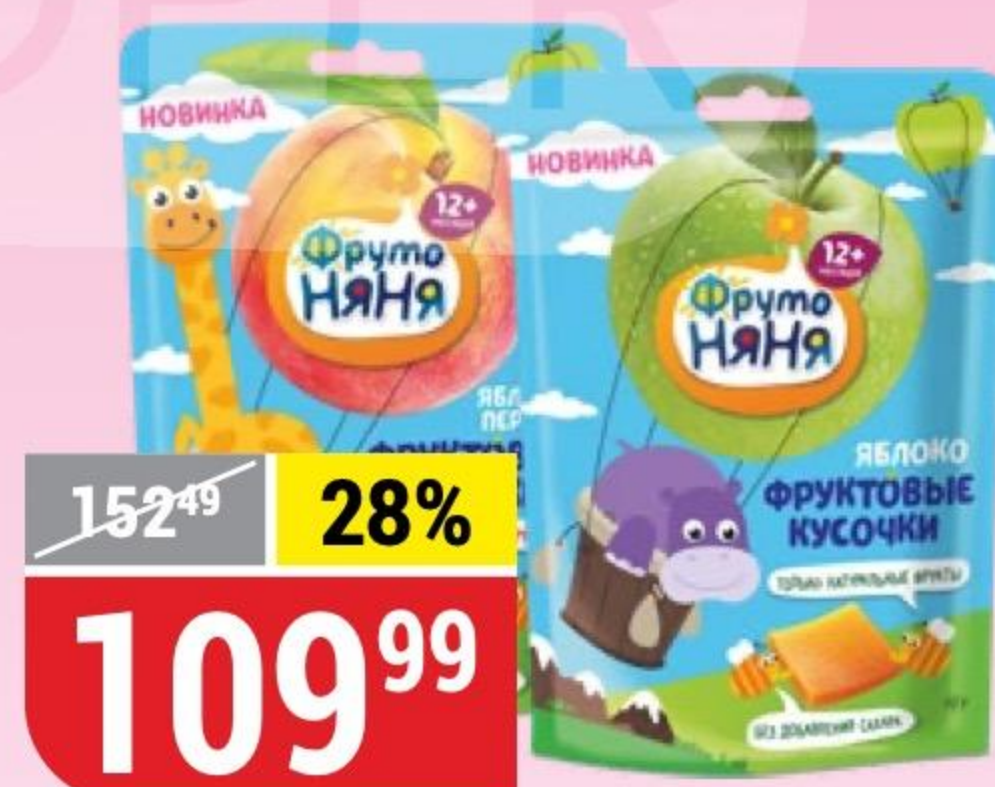
ФРУКТОВЫЕ КУСОЧКИ ФРУТОНЯНЯ яблоко; яблоко-персик, 53 г 137252/137253