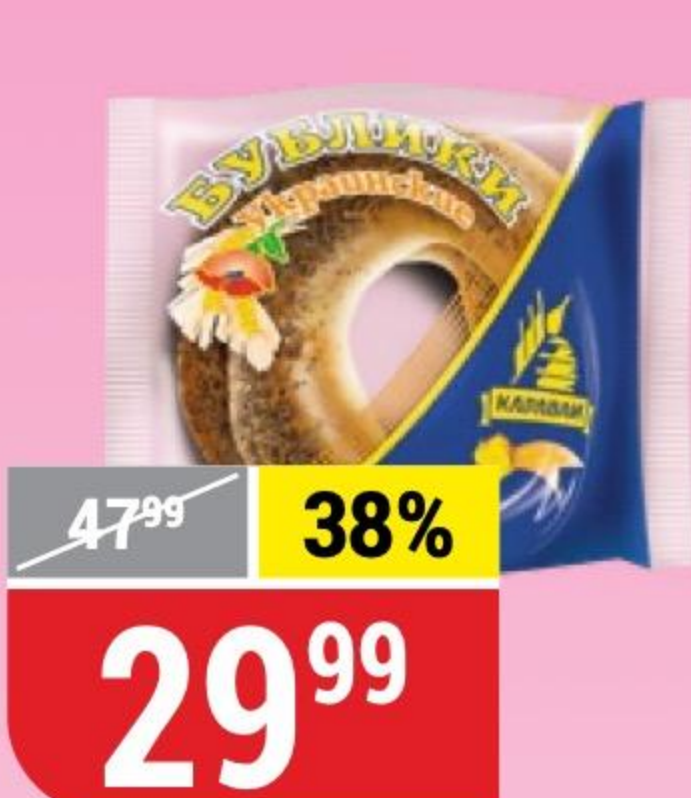
БУБЛИК УКРАИНСКИЙ Каравай, 2 шт. x 100 г 152542