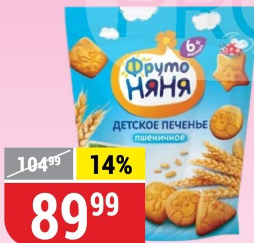
ПЕЧЕНЬЕ ФРУТОНЯНЯ детское, пшеничное, с 6 месяцев, 120 г 161303