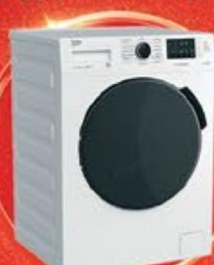
Стиральная машина Beko