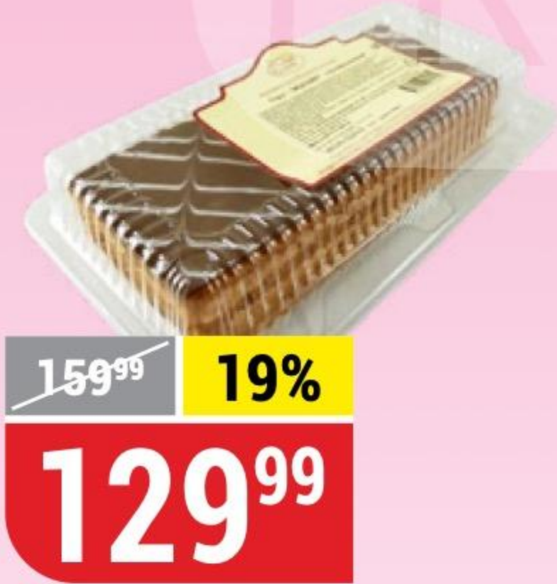
ТОРТ МЕДОВИК глазированный, Престиж, 300 г 140734