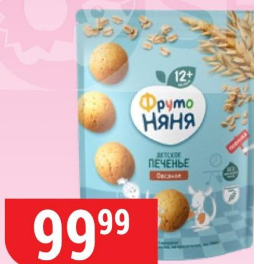
ПЕЧЕНЬЕ ФРУТОНЯНЯ детское, овсяное, 120 г 171948