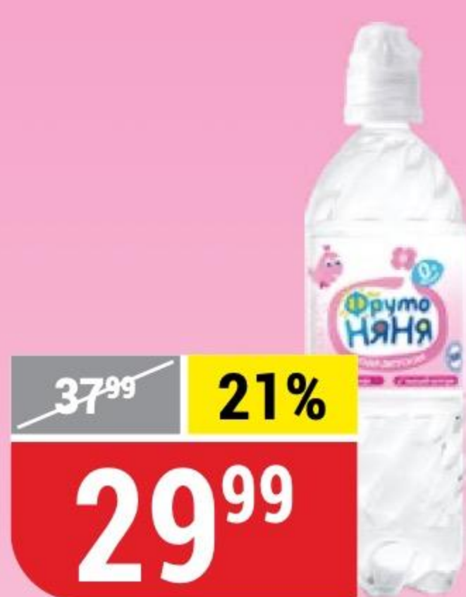
ВОДА ФРУТОНЯНЯ детская, артезианская, 0,33 л 101397