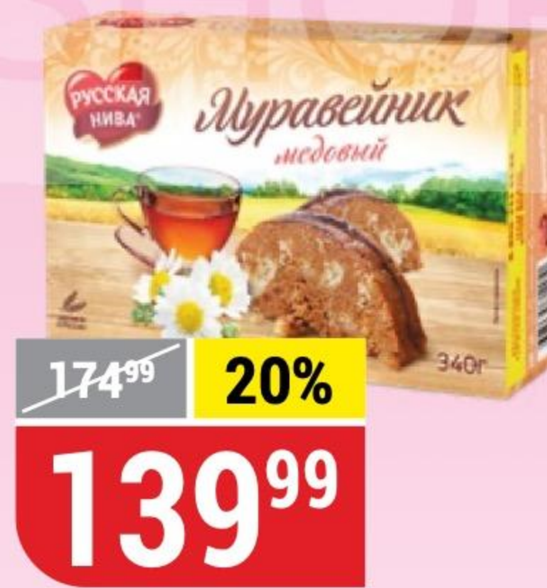
ТОРТ МУРАВЕЙНИК медовый, Русская Нива, 340 г 162093