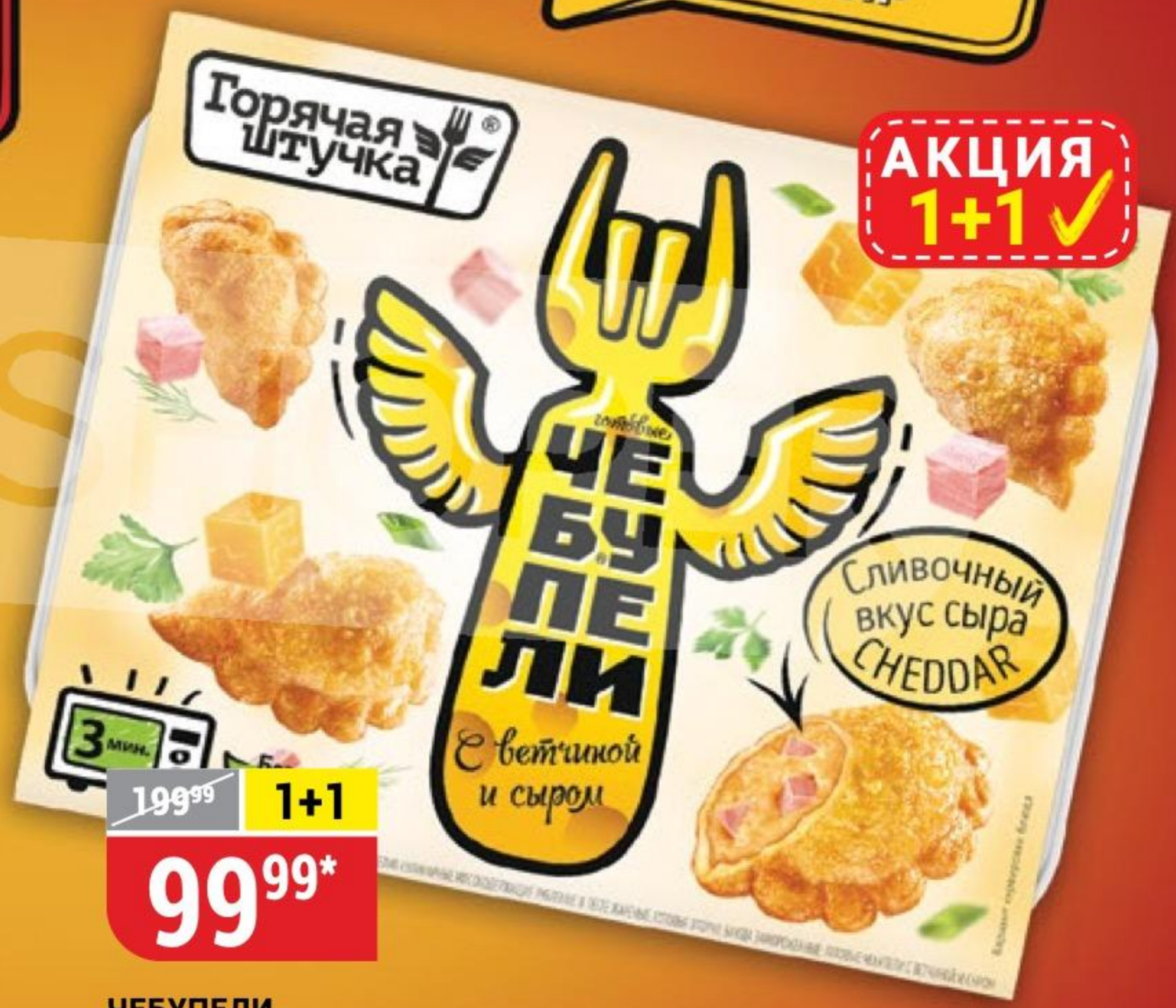
ЧЕБУРЕКИ сыр-ветчина, Горячая Штучка, 300 г 131173 * Цена указана за 1 шт. при покупке 2 шт. одновременно