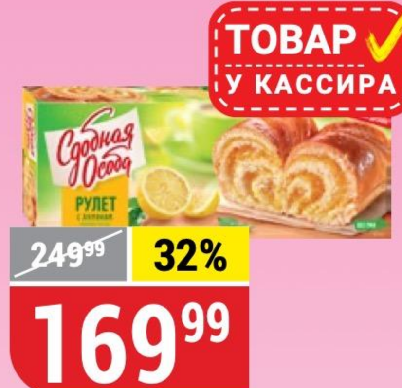
РУЛЕТ СДОБНАЯ ОСОБА с лимоном, 400 г 173799