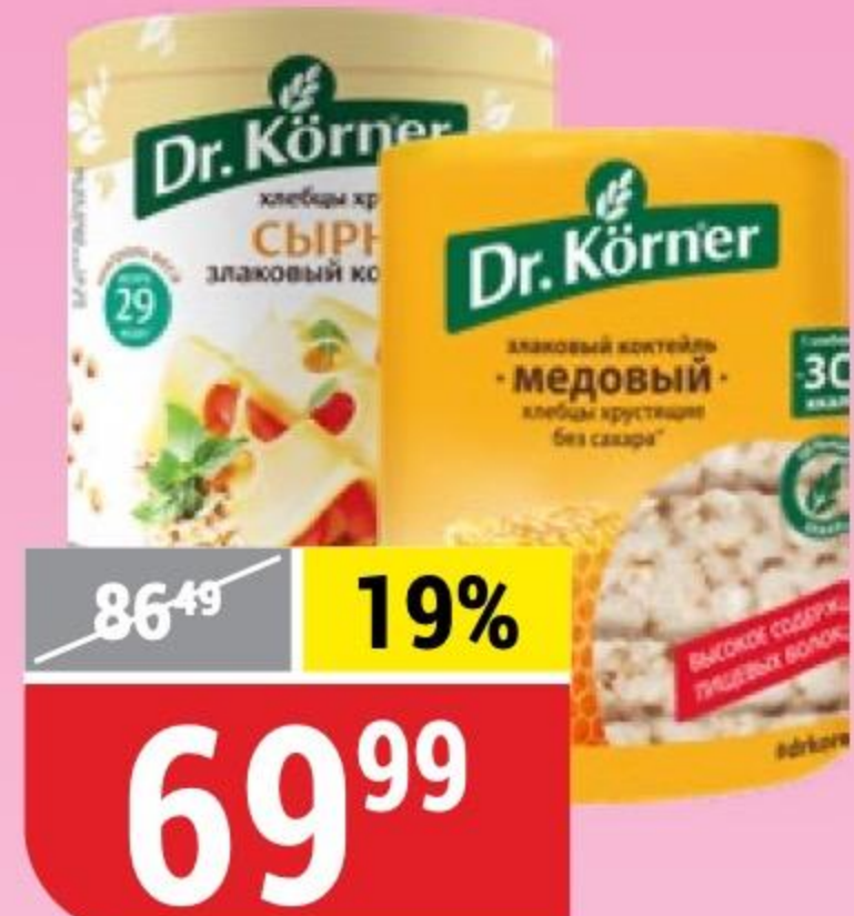
ХЛЕБЦЫ ЗЛАКОВЫЙ КОКТЕЙЛЬ медовый; сырный, Dr.Korner, 100 г 123636/162091