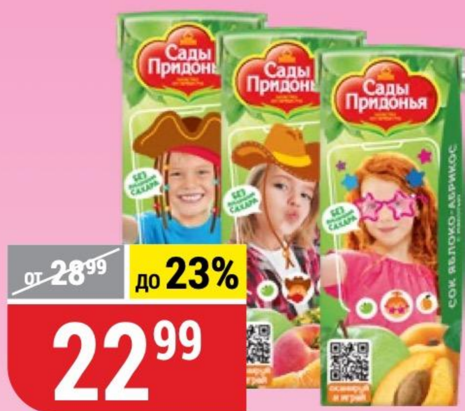
СОК САДЫ ПРИДОНЬЯ в ассортименте, 200 мл 102497/102507/102508/102510/102511