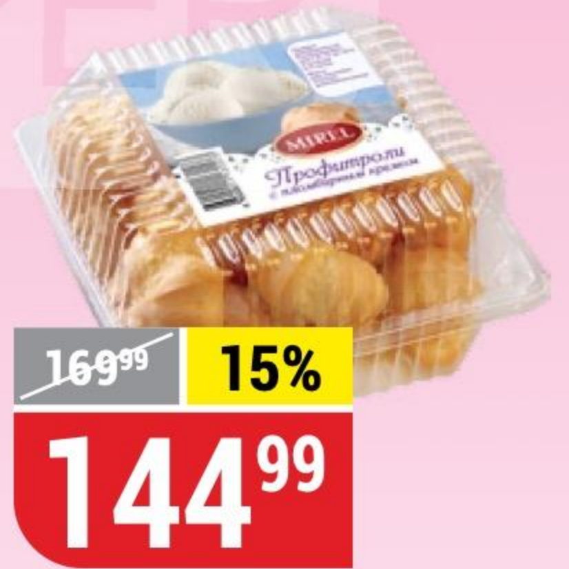
ПИРОЖНЫЕ ПРОФИТРОЛИ с пломбирным кремом, Mirel, 180 г 165400