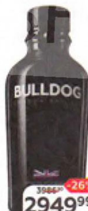
Джин BULLDOG 40%, 0,7 л