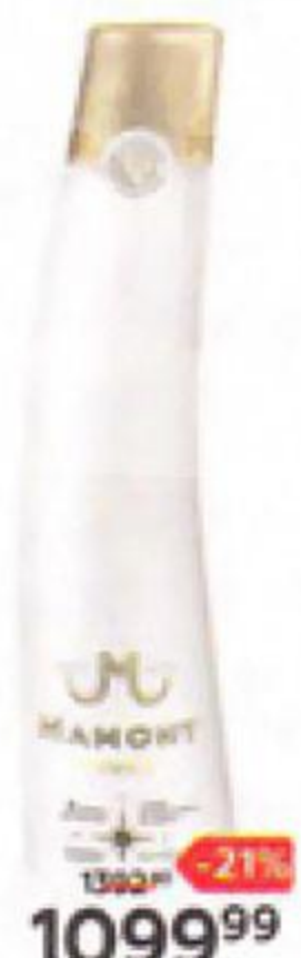
Водка МАМОНТ 40%, 0,7 л