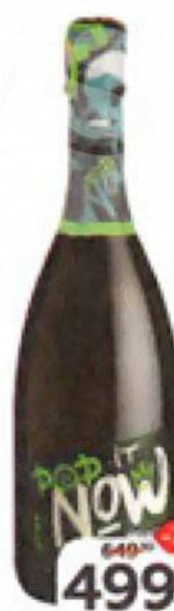
Вино игристое POP-IT-NOW белое брют (Италия), 0,75 л