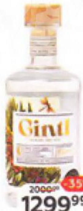
Джин GINTL сухой 47%, 0,5 л