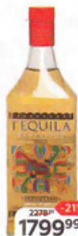
Текила RANCHITOS Голд 35%, 0,7 л

Смочите край охлажденного бокала для мартини лимонным соком, переверните стакан вверх дном и опустите в сахар. Налейте в шейкер водку, трипл сек, лимонный сок, сахарный сироп и добавьте горсть льда. Закройте шейкер и энергично встряхивайте 30 сек. Процедите в подготовленный бокал.