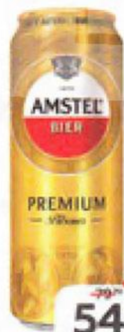
Пиво AMSTEL Premium Pilsener светлое фильтрованное 4,8%, 0,43 л