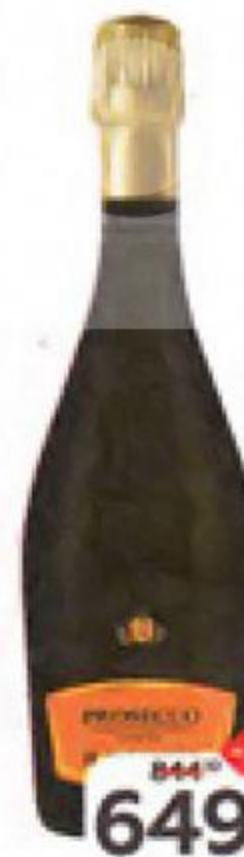
Вино игристое IL MOZZIERE Про- секко, белое брют (Италия), 0,75 л