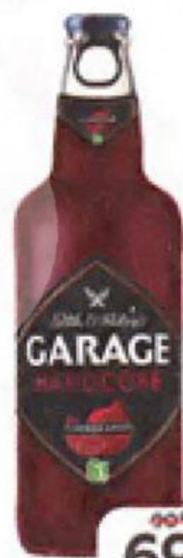
Напиток пивной GARAGE Seth and Rileys Hardcore, Гранат 6%, 0,4 л