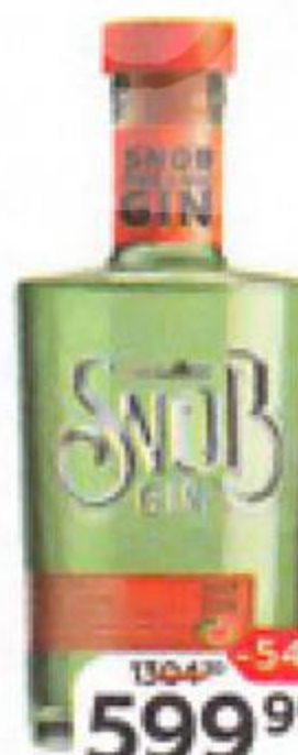
Джин SNOB Light, грейп- фрут 40%, 0,5 л