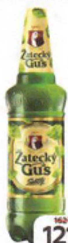
Пиво ZATECKY GUS, светлое фильтрованное пастеризованное, 4,6%, 1,35 л