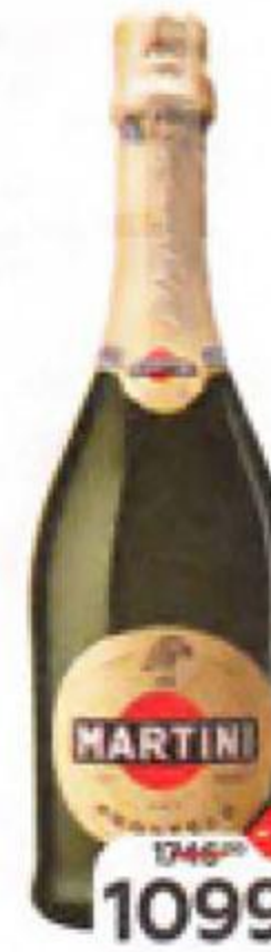
Вино игристое MARTINI Prosecco, белое сухое (Италия), 0,75 л