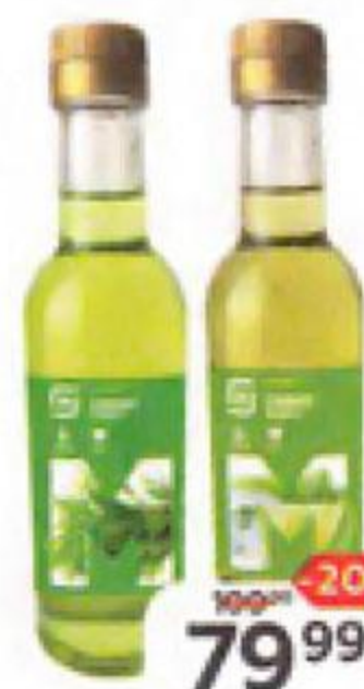
Сироп МАГНИТ Тархун/Мохито, 250 мл

Смешайте шоколадный ликер, эспрессо, сироп и водку в шейкере. Добавьте лед. Закройте шейкер и встряхивайте 15-20 сек. Разлейте в охлажденные бокалы. Посыпьте шоколадной стружкой в охлажденный бокал.