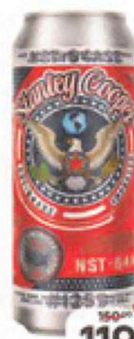
Пиво STANLEY COOPER светлое фильтрованное (Германия), 0,5 л