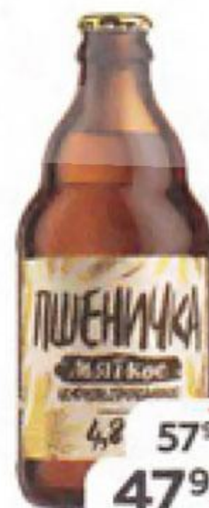
Пиво ПШЕНИЧКА Мягкое светлое нефильтованное 4,8%, 0,45 л