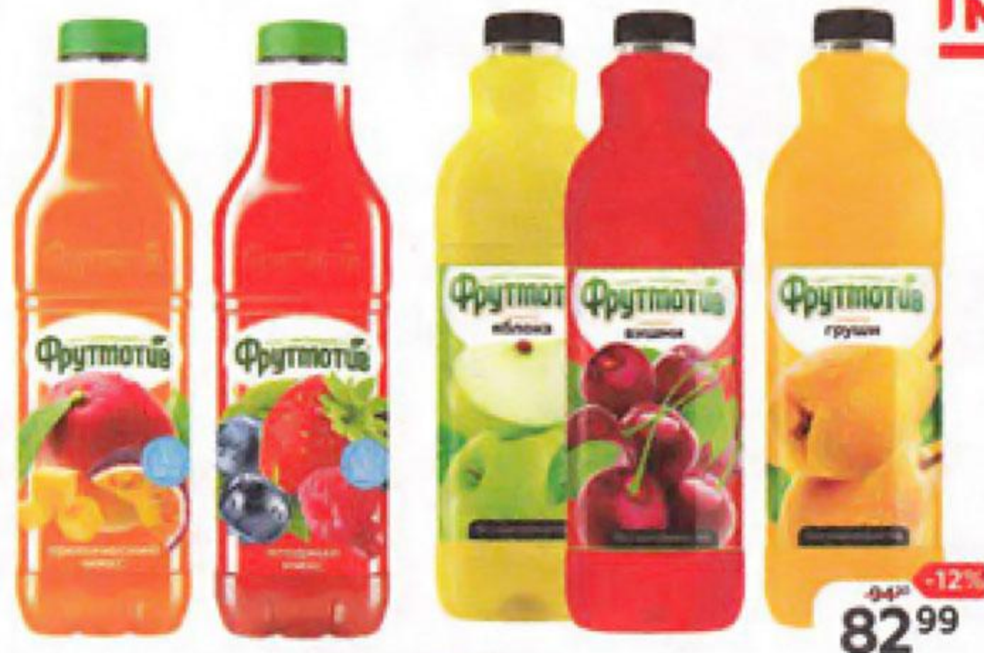
Напиток негазированный ФРУТМОТИВ, в ассортименте*, 1,5 л