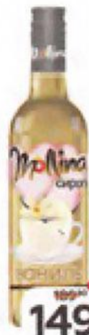
Сироп MOLLINA Ваниль, 345 г