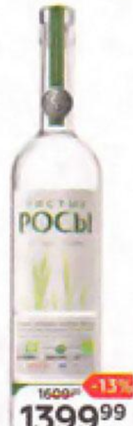
Водка ЧИСТЫЕ РОСЫ 40%, 0,7 л

ЧРЕЗМЕРНОЕ УПОТРЕБЛЕНИЕ АЛКОГОЛЯ ВРЕДИТ ВАШЕМУ ЗДОРОВЬЮ