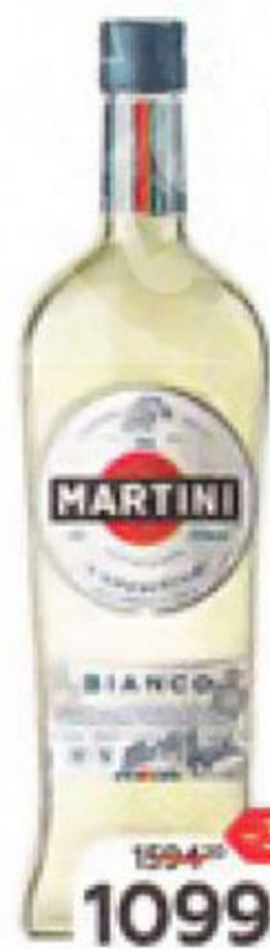
Напиток MARTINI Bianco, белый сладкий (Италия), 1 л