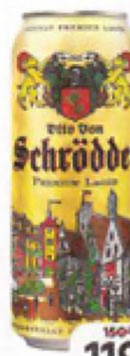
Пиво SCHRODDER светлое фильтрованное, 4,9% (Германия), 0,5 л