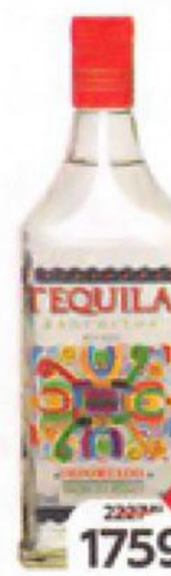
Текила RANCHITOS Бланко 35%, 0,7 л

ЧРЕЗМЕРНОЕ УПОТРЕБЛЕНИЕ АЛКОГОЛЯ ВРЕДИТ ВАШЕМУ ЗДОРОВЬЮ