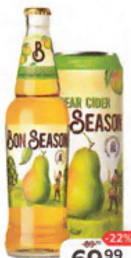
Сидр BON SEASON Pear, пастеризованный сладкий 4,5%; банка, 0,43л/бутылка, 0,4л