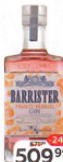
Джин BARRISTER Frosty Berries, 40%, 0,5 л