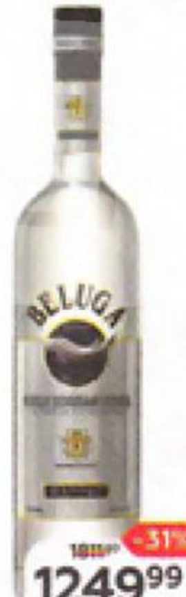
Водка BELUGA НОБЛ, 40%, 0,7 л