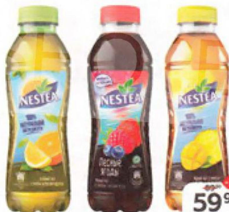
Чай NESTEA в ассортименте*, 500мл