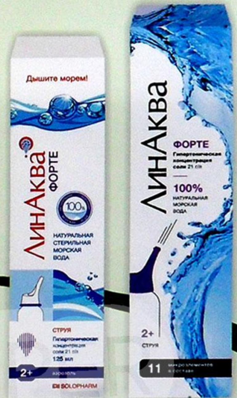
Линаква Форте средство д/промыв. носа 125мл Линаква Форте аэрозоль д/промыв. носа 150мл