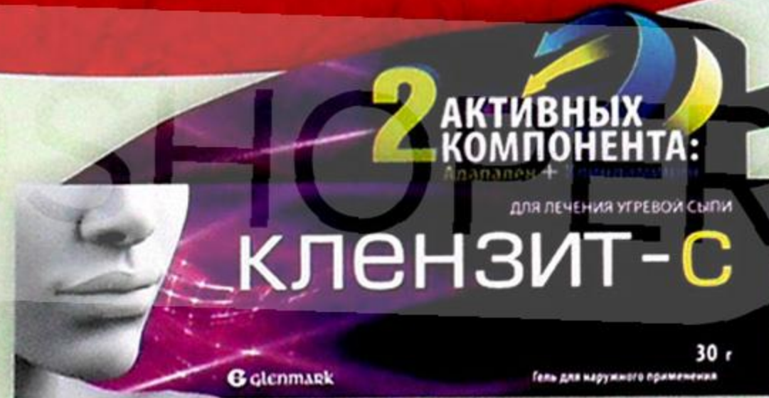
Клензит-С гель 30г