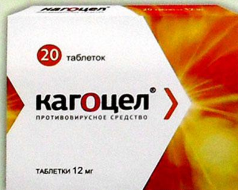
Кагоцел таб. 12мг №20