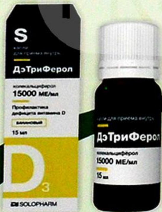
ДэТриФерол капли д/приема внутрь 15000 МЕ/мл 15мл банан