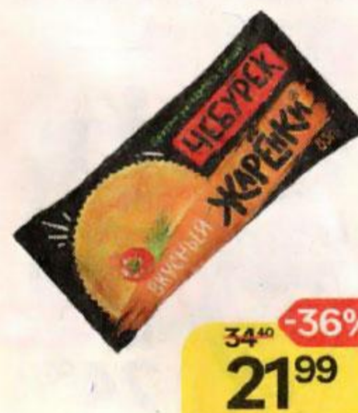
Чебурек ЖАРЁНКИ Вкусный, с мясом, 85 г

*Цена за единицу товара при единовременной покупке 2 оригинальных акционных товаров