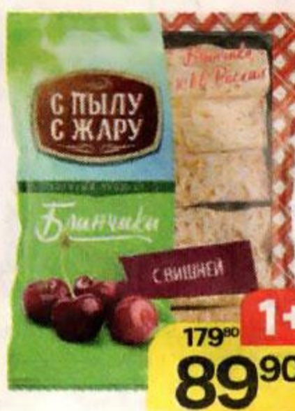
Блинчики С ПЫЛУ С ЖАРУ , с вишней, 360 г