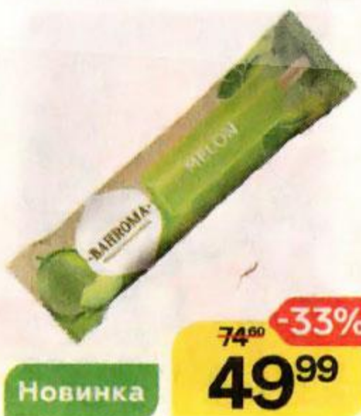
Мороженое ВАНРОМА Melon, молочный лёд с дыней, 68 г