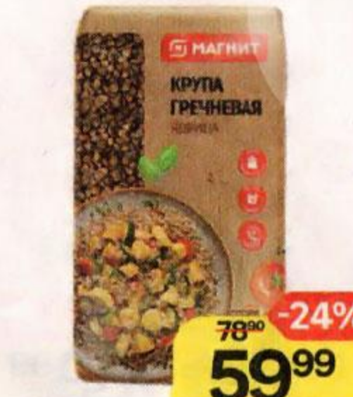
Крупа МАГНИТ гречневая, ядрица, 800-900 г