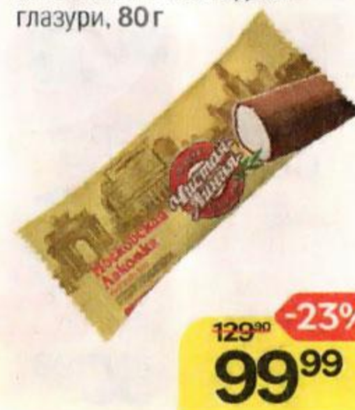
Мороженое ЧИСТАЯ ЛИНИЯ , Московская лакомка, во взбитой шоколадной глазури, 80 г