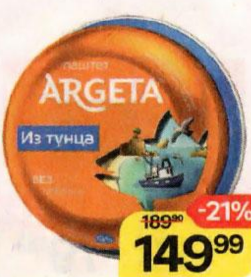
Паштет ARGETA , Из тунца, 95 г