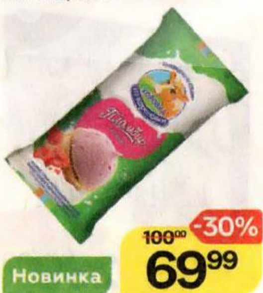
Мороженое КОРОВКА ИЗ КОРЕНОВКИ пломбир малина, 100 г