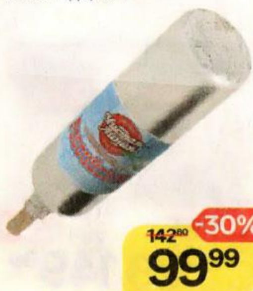
Мороженое ЧИСТАЯ ЛИНИЯ , Российское, в молочном шоколаде, 80 г