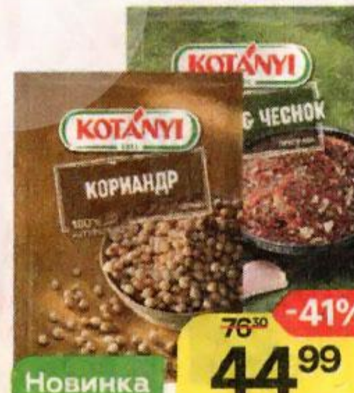
Приправа KOTANYI , в ассортименте***, 20 г