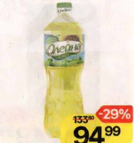
Масло подсолнечное ОЛЕЙНА , Рафинированное, дезодорированное, 1 л