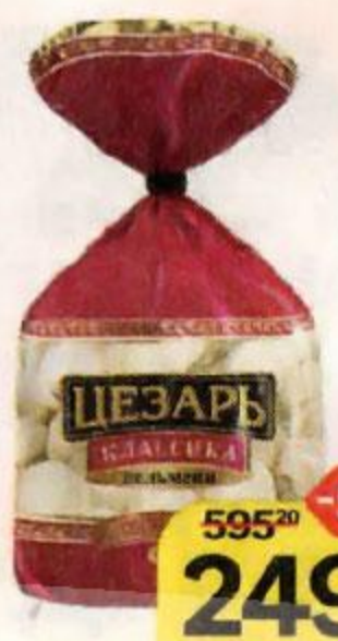
Пельмени ЦЕЗАРЬ , Классика, говядина-свинина, 800 г

*Цена за единицу товара при единовременной покупке 2 оригинальных акционных товаров