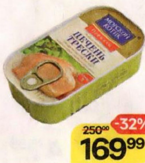
Печень трески МОРСКОЙ КОТИК Натуральная, 115 г