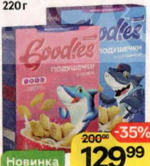
Подушечки GOODIES с халвой/ со сгущенным молоком/ со вкусом банана, 220 г