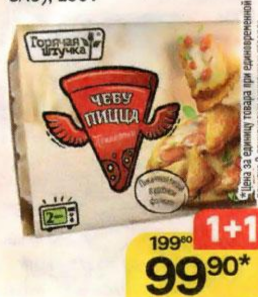
Чебуцица ГОРЯЧАЯ ШТУЧКА Пепперони (Мясная галерея ЗАО), 250 г

*Цена за единицу товара при единовременной покупке 2 оригинальных акционных товаров