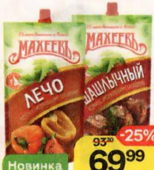
Кетчуп МАХЕЕВЪ Лечо/ Чили/ Шашлычный, 300 г