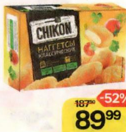
Наггетсы ЧИКОН Классические, 300 г