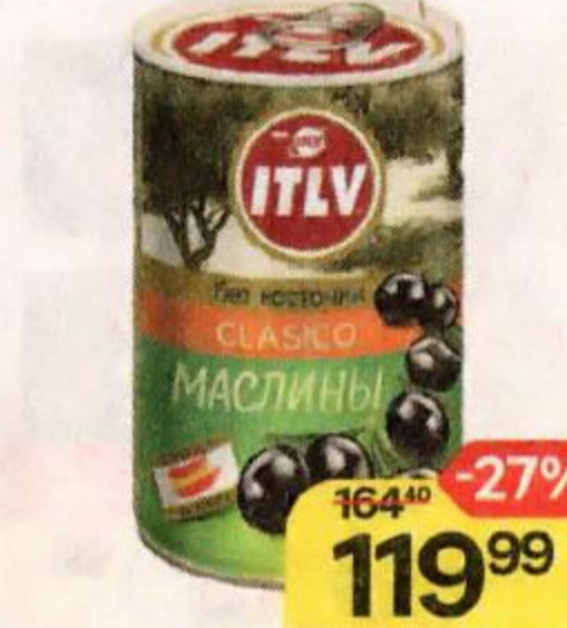
Маслины ITLV без косточки, 300 г