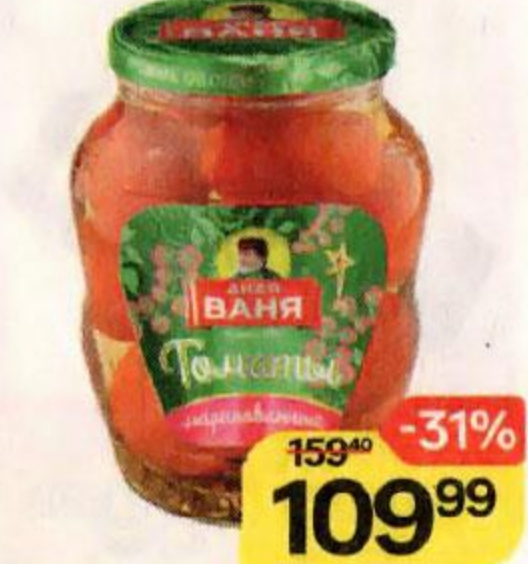
Томаты ДЯДЯ ВАНЯ , маринованные, 680 г