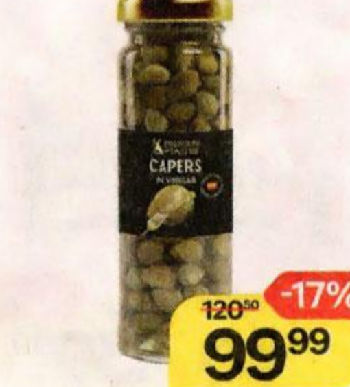
Каперсы PREMIERE OF TASTE® , 100 г