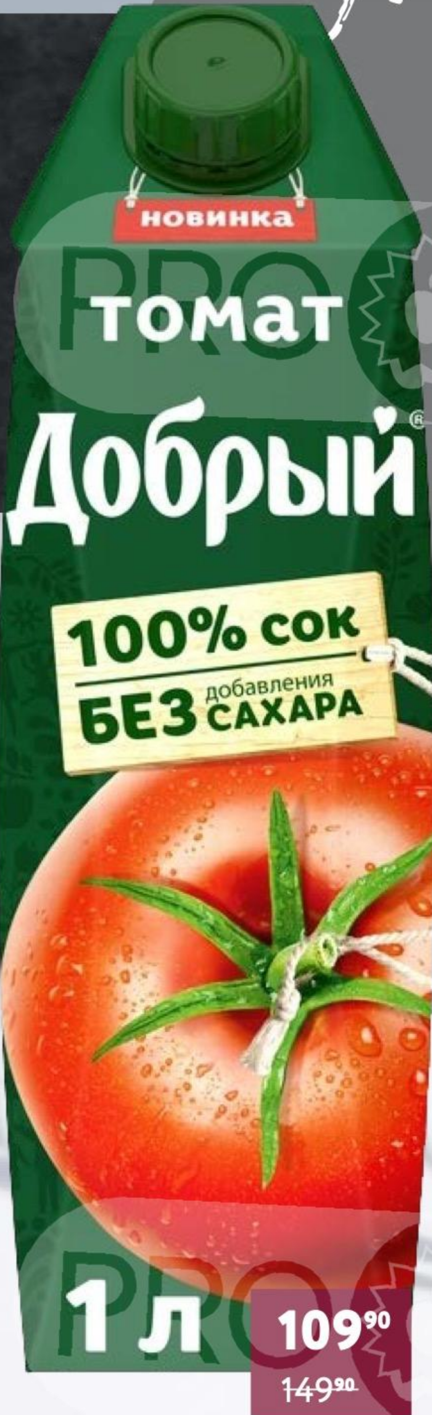
ТОМАТНЫЙ СОК «ДОБРЫЙ» 1 л