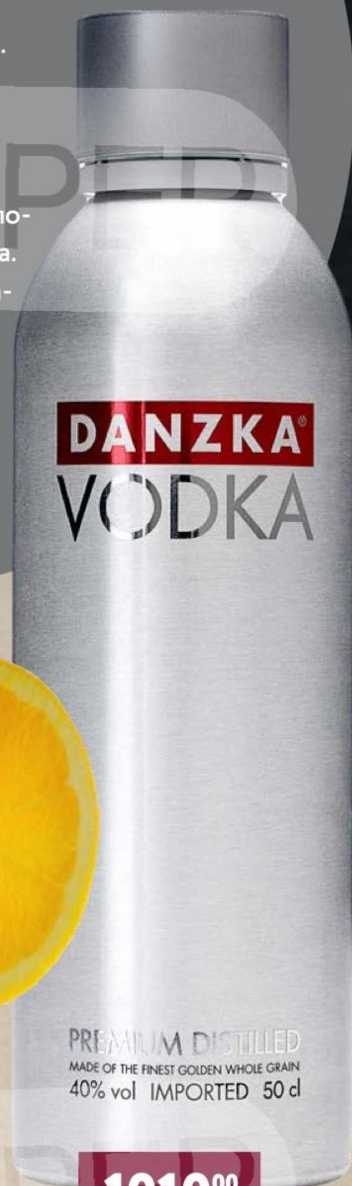
ВОДКА DANZKA 40% | 0.5 Л | ГЕРМАНИЯ