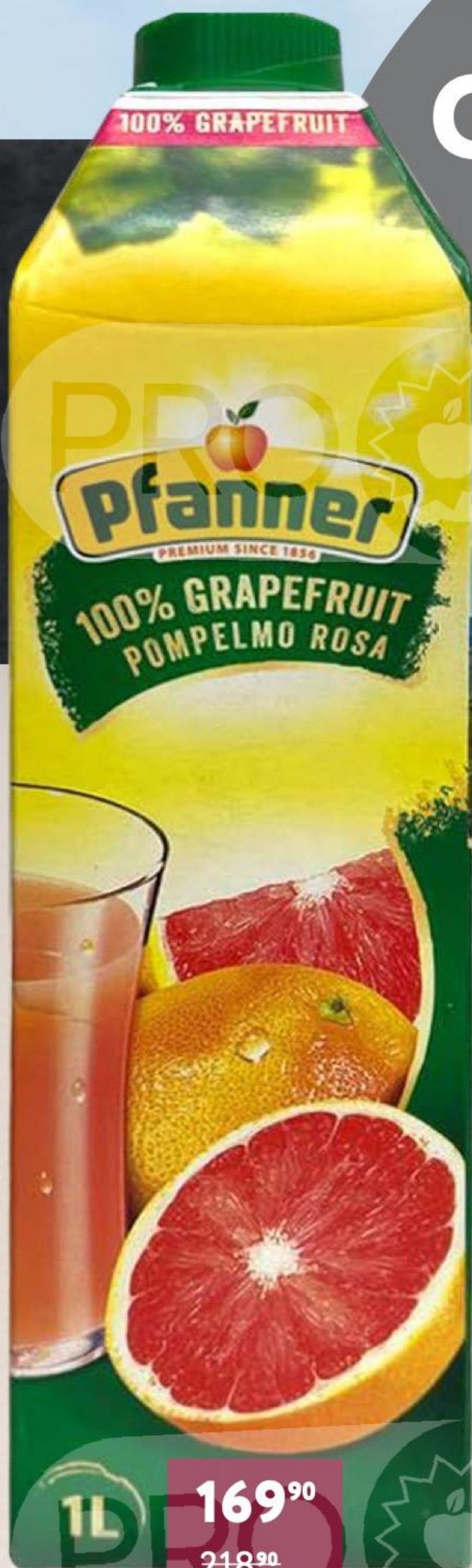
СОК ГРЕЙПФРУТ PFANNER 1.03 | АВСТРИЯ