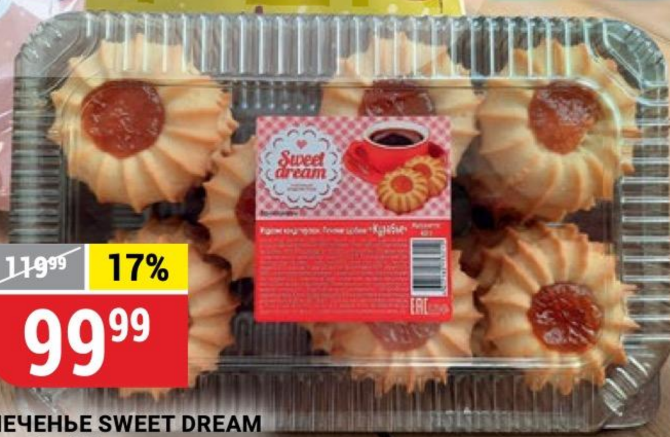
ПЕЧЕНЬЕ SWEET DREAM курабье, 400 г 120327

ОСТАВЬТЕ СВОЙ ОТЗЫВ О КАЧЕСТВЕ ТОВАРА! mnenie@ivoiin.ru