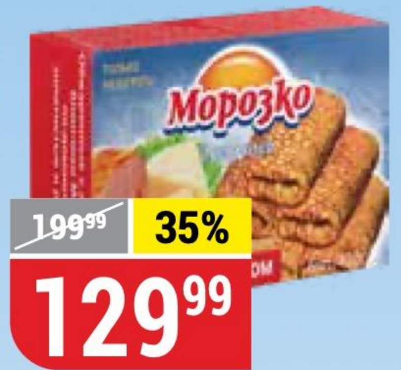
БЛИНЧИКИ с ветчиной и сыром, Морозко, 420 г 144944