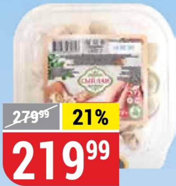
ПЕЛЬМЕНИ ПО-ВОСТОЧНОМУ ХАЛЯЛЬ Сыйлан, 450 г 156835