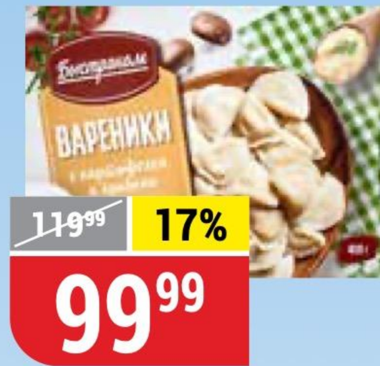
ВАРЕНИКИ с картофелем и грибами, Быстроном, 400 г 153748