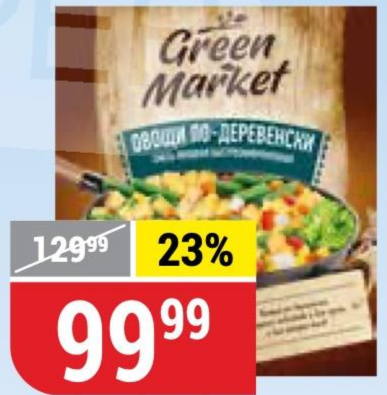
ОВОЩИ ПО-ДЕРЕВЕНСКИ замороженные, Green Market, 400 г 175412