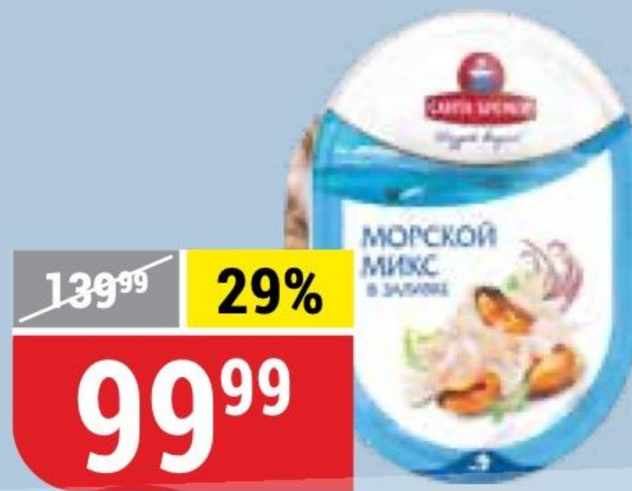
КОКТЕЙЛЬ ИЗ МОРЕПРОДУКТОВ МОРСКОЙ МИКС Санта Бремор, 180 г 147557