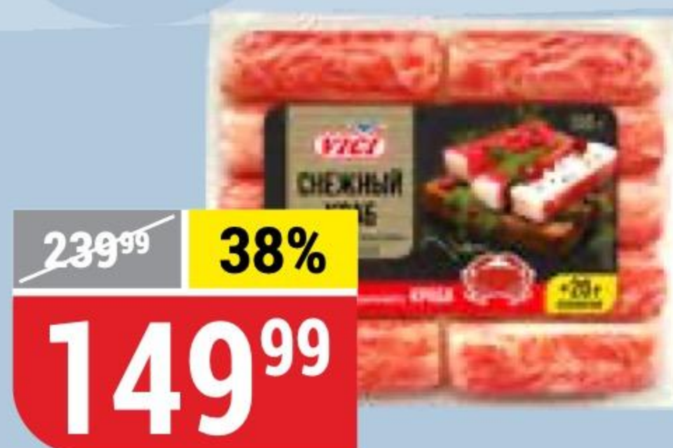
КРАБОВЫЕ ПАЛОЧКИ СНЕЖНЫЙ КРАБ с мясом натурального краба, охлажденные, Vici, 170 г 163224