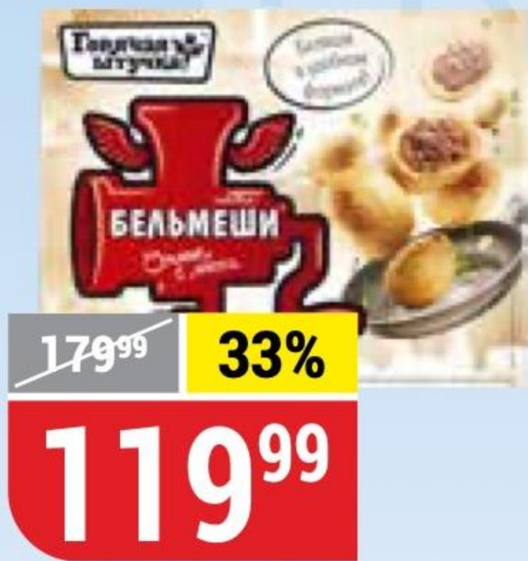
БЕЛЬМЕШИ Горячая Штучка, 300 г 116261