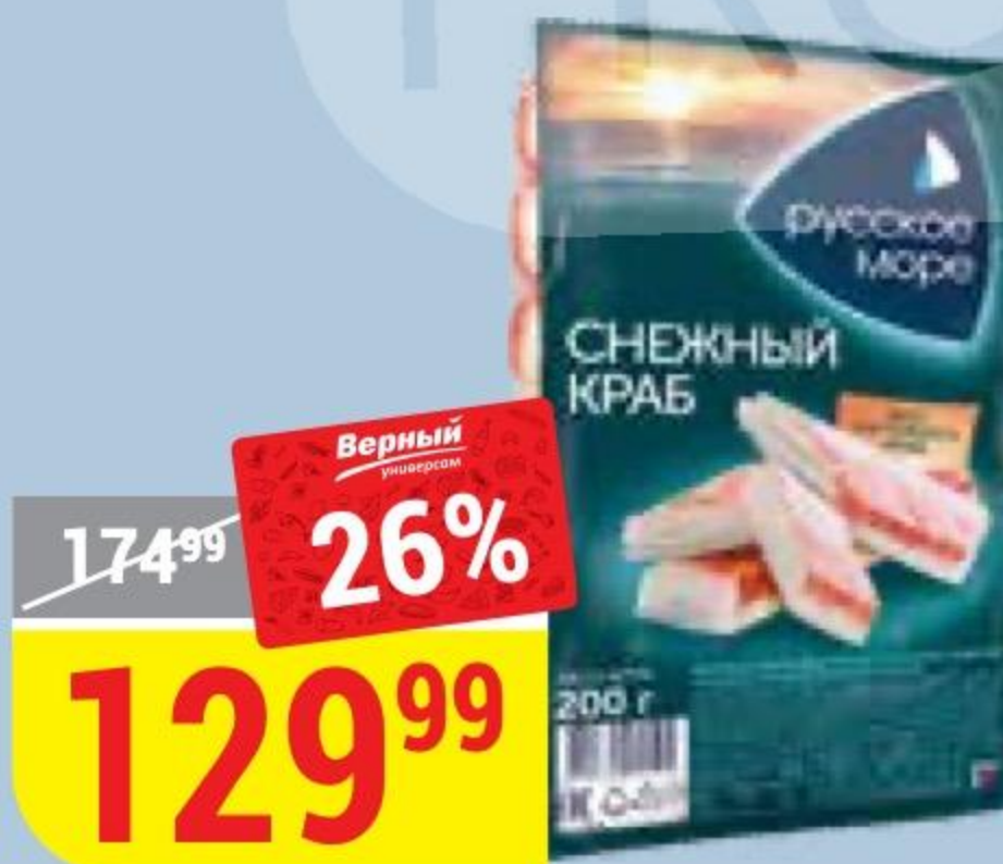
КРАБОВЫЕ ПАЛОЧКИ СНЕЖНЫЙ КРАБ охлажденные, Русское Море, 200 г 141926