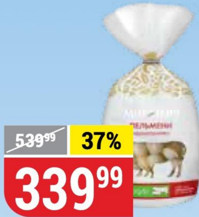
ПЕЛЬМЕНИ ДОМАШНИЕ свино-говяжьки, Мираторг, 800 г 129058