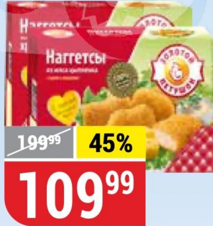
НАГГЕТСЫ ИЗ МЯСА ЦЫПЛЕНКА с сыром; хрустящие, Золотой Петушок, 300 г 120568/130057