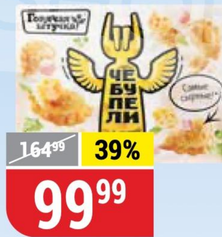
ЧЕБУПЕЛИ сыр-ветчина, Горячая Штучка, 300 г 131173