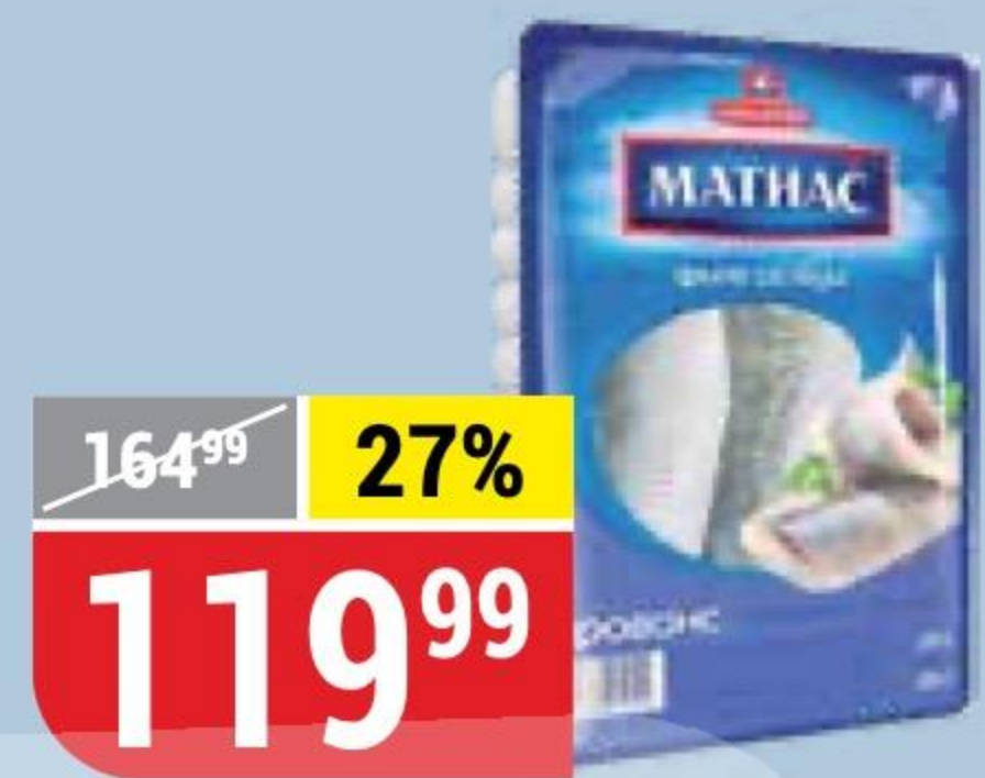
СЕЛЬДЬ МАТИАС филе деликатесное, Санта Бремор, 250 г 107338