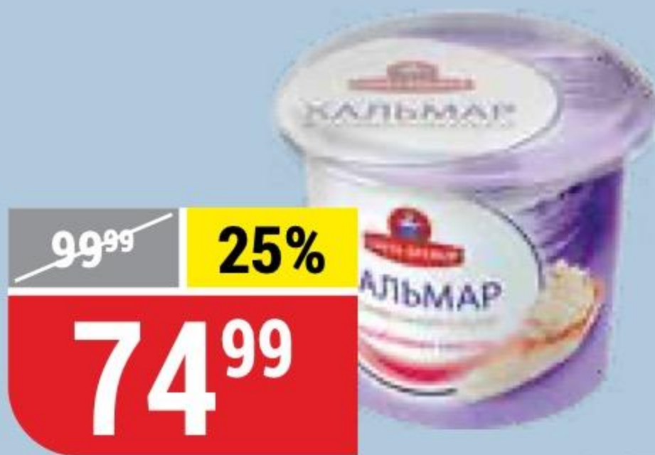
КАЛЬМАР в сливочном соусе с крабовым мясом, Санта Бремор, 150 г 169752