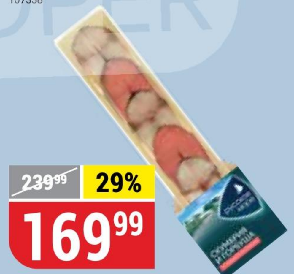
АССОРТИ горбуша-скуприя, холодного копчения, Русское Море, 200 г 163222