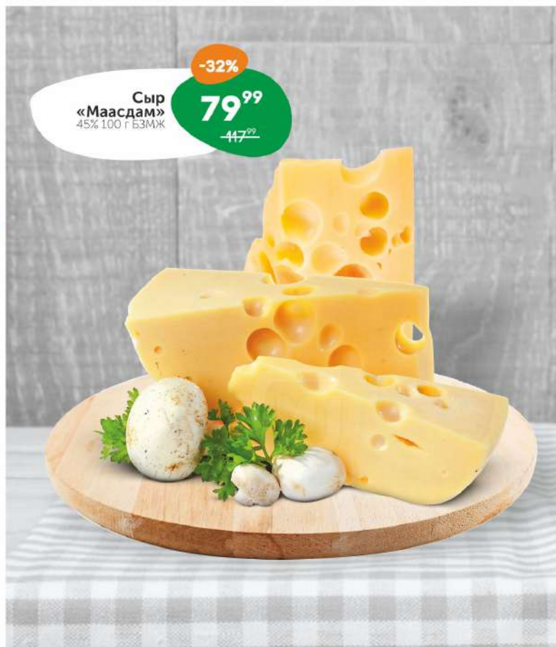
Сыр «Маасдам» 45% 100 г БЗМЖ