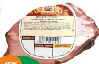
Шейка пряная запеченная в/у Черкашин 100 г