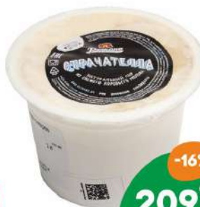
Сыр «Страчателла» 45% Сыроварня Режано 200 г БЗМЖ