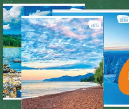
Тетрадь «Природа» клетка 48 листов