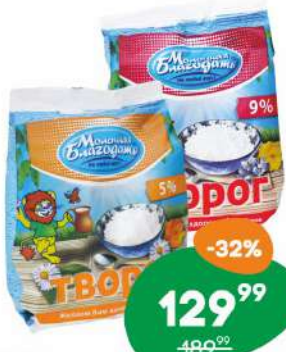
Творог «Молочная благодать» 5% 350г, 9% 300 г БЗМЖ