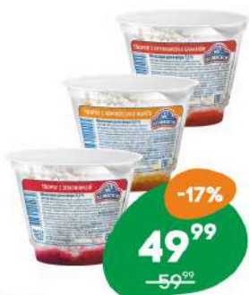
Творог «Полевское» с земляникой, с клубникой и бананом, с абрикосом и манго 5% 120 г БЗМЖ