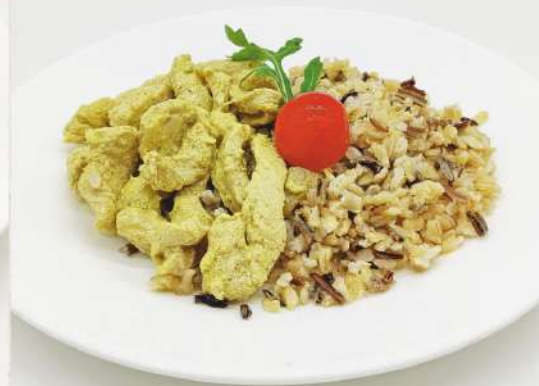
Индейка карри с диким рисом 250 г