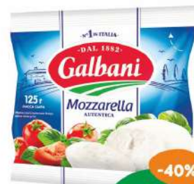
Сыр «Моцарелла» 45% Гальбани 125 г БЗМЖ