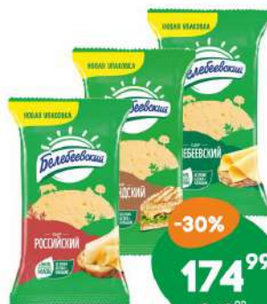
Сыр «Голландский», «Российский», «Белебеевский» 45-50% Белебеевский МК 190г БЗМЖ