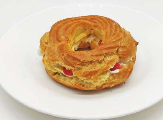
Кольцо заварное без глютена с сырным кремом 150 г