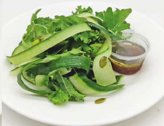
Зелёный салат с заправкой из сока юдзу 150 г