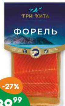
Форель «Три Кита» филе-кусочек с/с 130 г