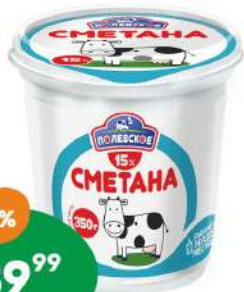
Сметана «Полевское» 15% 350 г БЗМЖ