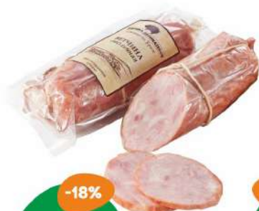
Ветчина «Столичная» Фабрика Деликатесов 350 г