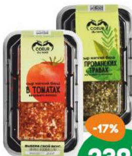
Сыр «Кер дю Норд» из козьего молока в вяленых томатах, в прованских травах 45% 130 г БЗМЖ