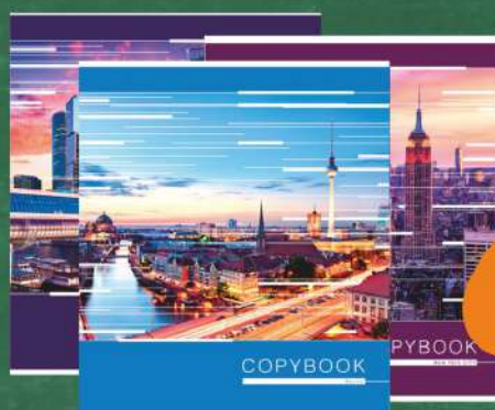
Тетрадь «Города мира» клетка 48 листов