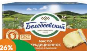
Масло традиционное сладко-сливочное 82.5% Белебеевский МК 170 г БЗМЖ