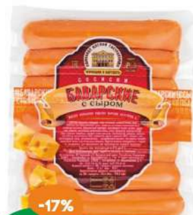
Сосиски «Баварские» с сыром Черкашин 400 г