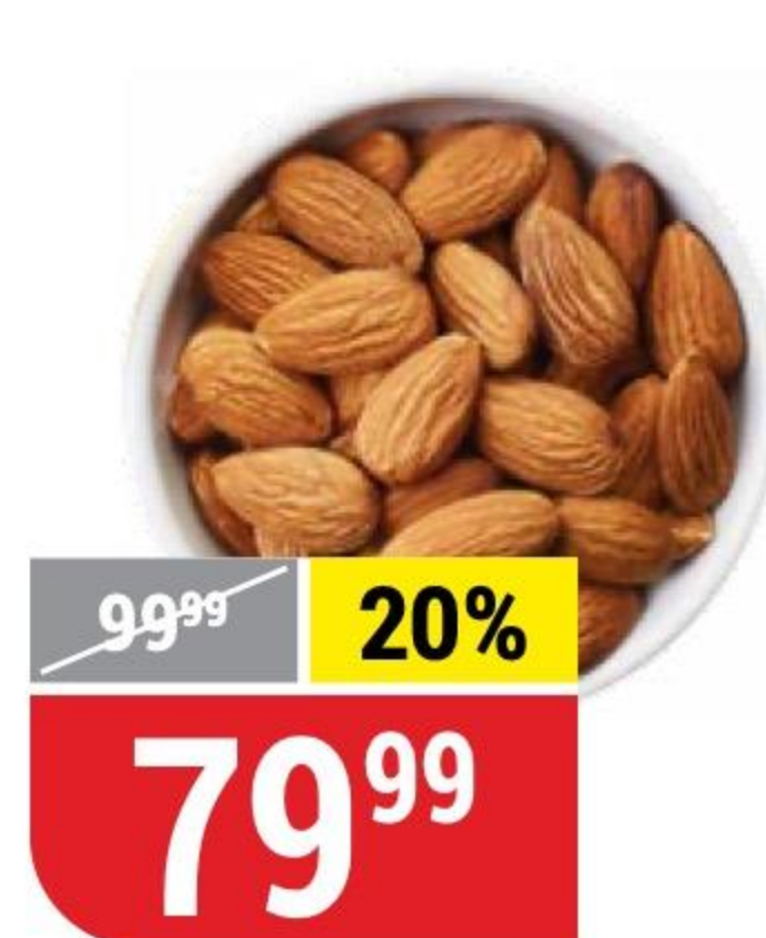
МИНДАЛЬ сушеный, 100 г 3817