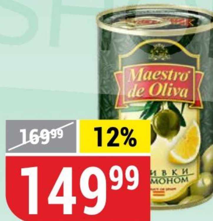
ОЛИВКИ с лимоном, Maestro de Oliva, 300 г 100868