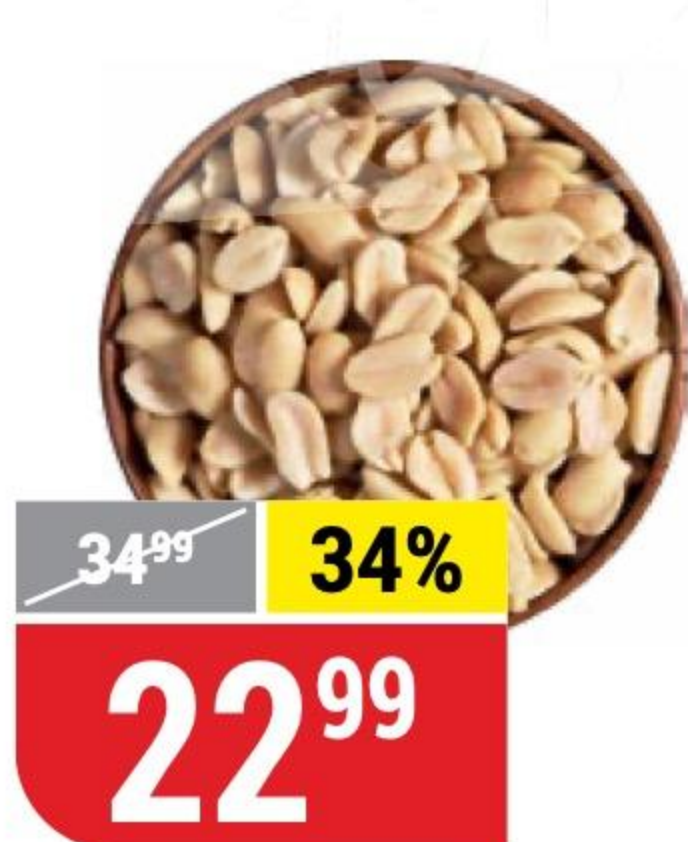
АРАХИС жареный, с солью, 100 г 3819