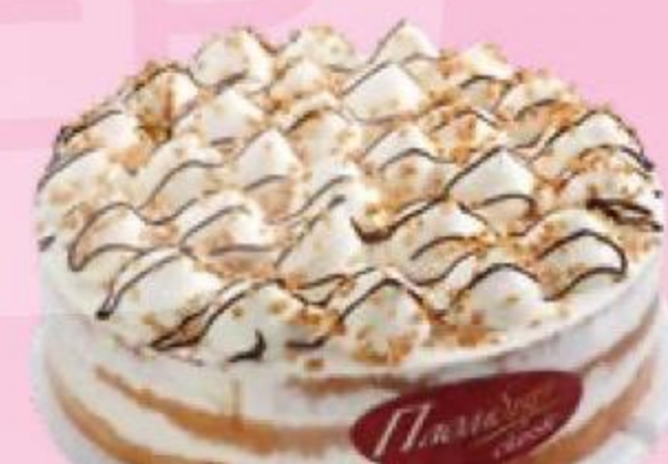
ТОРТ ШОКОЛАДНО- ЧЕРНИЧНЫЙ Русская Нива, 340 г 161401