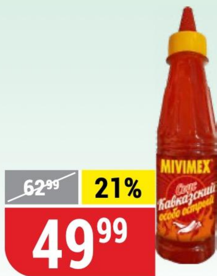
СОУС КАВКАЗСКИЙ особо острый, Mivimex, 200 г 147609