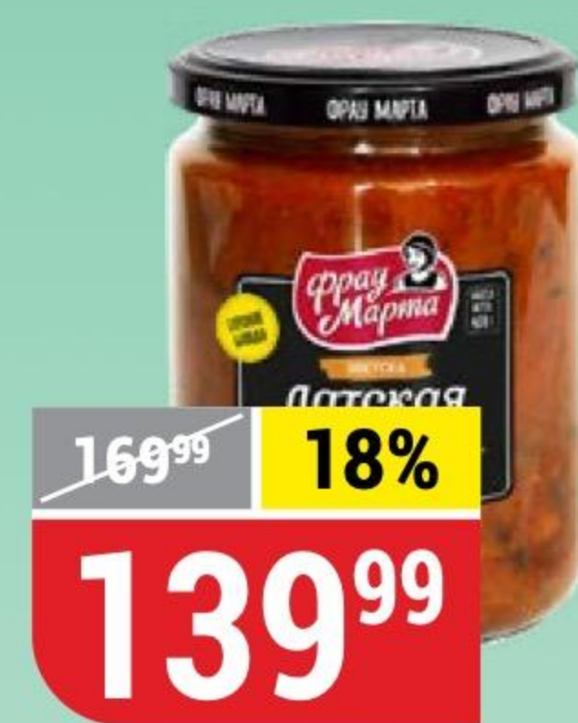
ЗАКУСКА ДАТСКАЯ с грибами, Фрай Марта, 420 г 165218