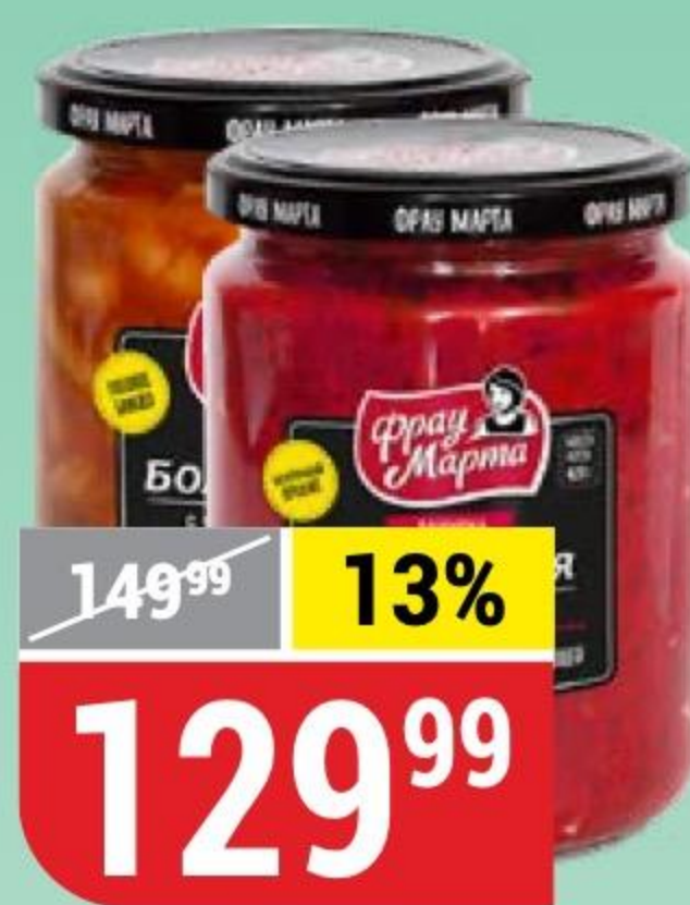
ЗАКУСКА БОЛГАРСКАЯ; РУМЫНСКАЯ Фрай Марта, 420-430 г 165216/165220