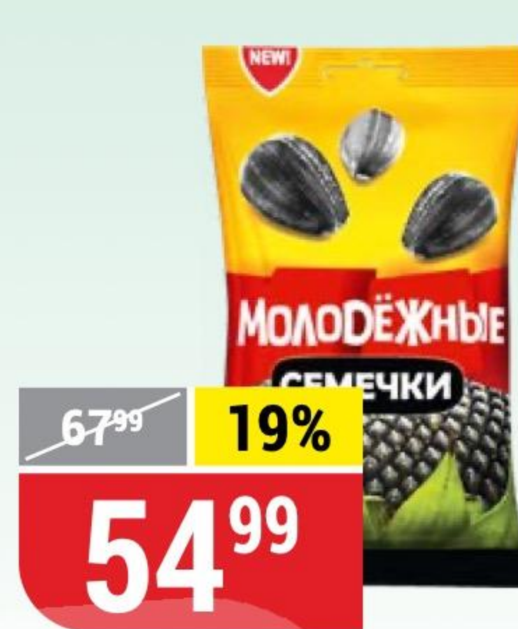
СЕМЕЧКИ МОЛОДЕЖНЫЕ 200 г 124990