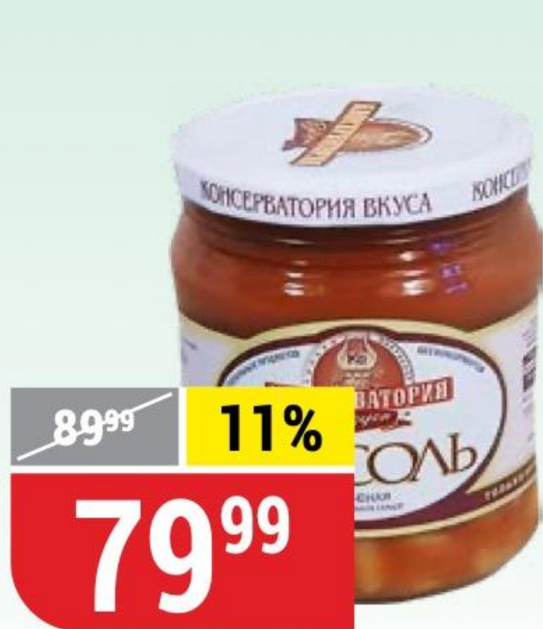
ФАСОЛЬ ПЕЧЕНАЯ в томатном соусе, Консерватория Вкуса, 470 г 172802