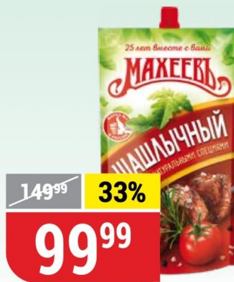
КЕТЧУП ШАШЛЫЧНЫЙ Махеевъ, 500 г 134238