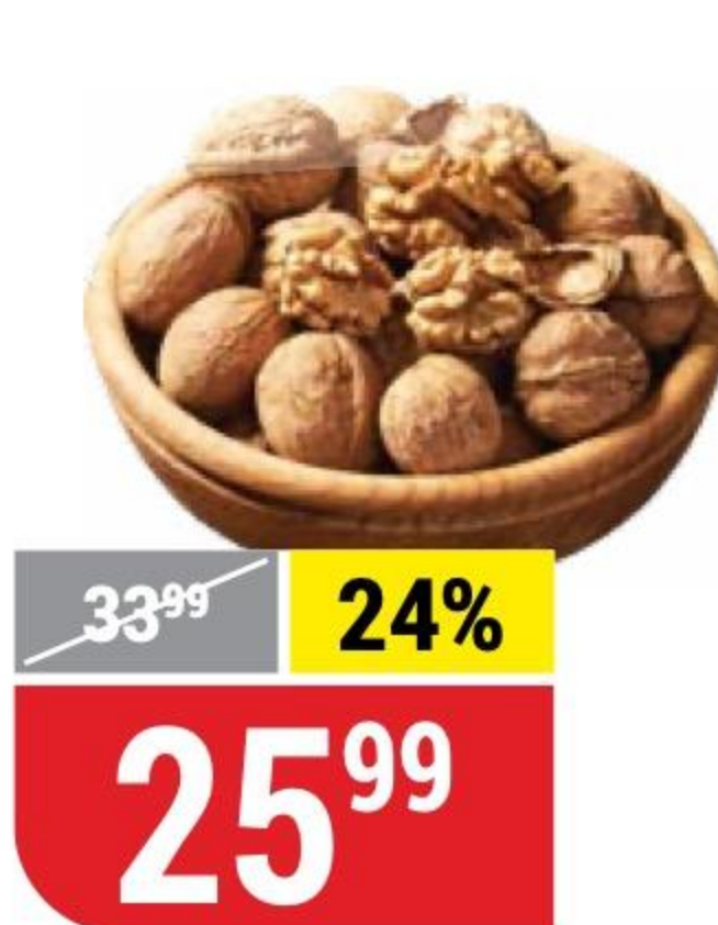
ГРЕЦКИЙ ОРЕХ в скорлупе, 100 г 4319