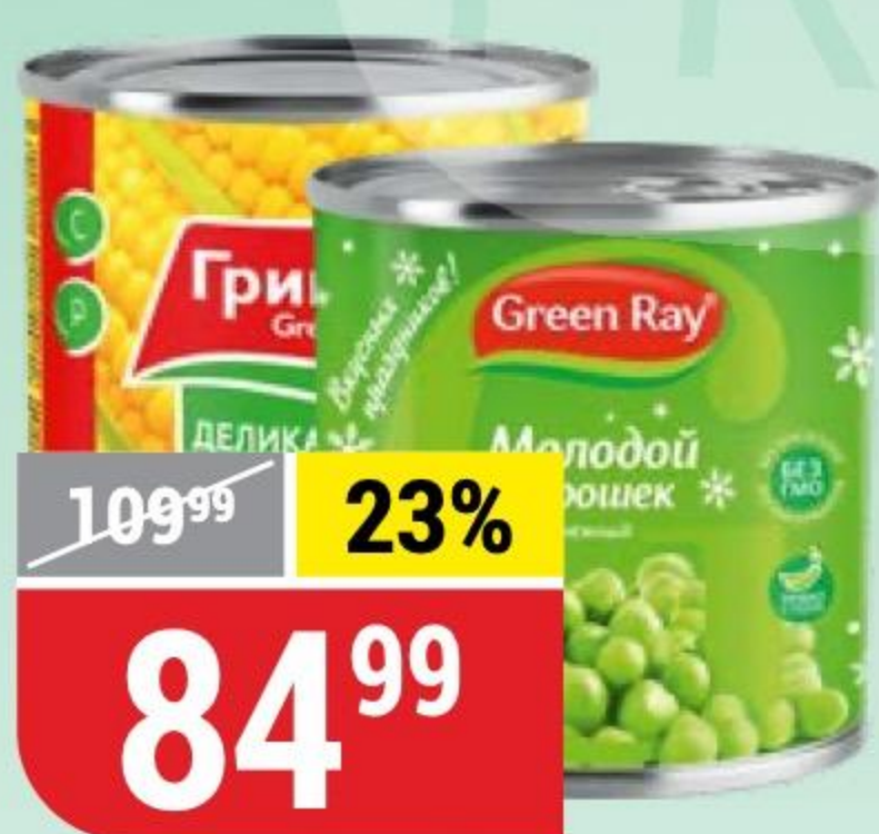
КУКУРУЗА ДЕЛИКАТЕСНАЯ; ГОРОШЕК МОЛОДОЙ Green Ray, 425 мл 137684/138459