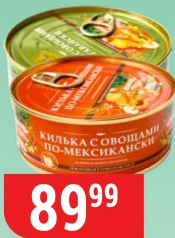
КИЛЬКА ЗА РОДИНУ в ассортименте, 240 г 162738/173525