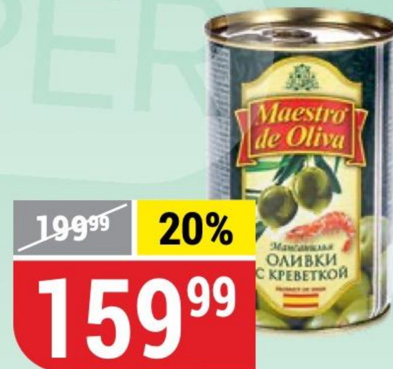
ОЛИВКИ с креветками, Maestro de Oliva, 300 г 100869