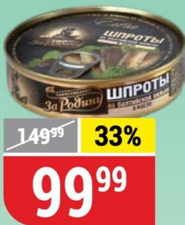
ШПРОТЫ ЗА РОДИНУ в масле, 160 г 166577