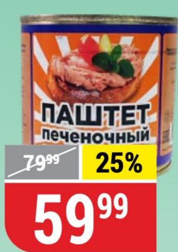
ПАШТЕТ ПЕЧЕНОЧНЫЙ со сливочным маслом, Русь, 250 г 172800