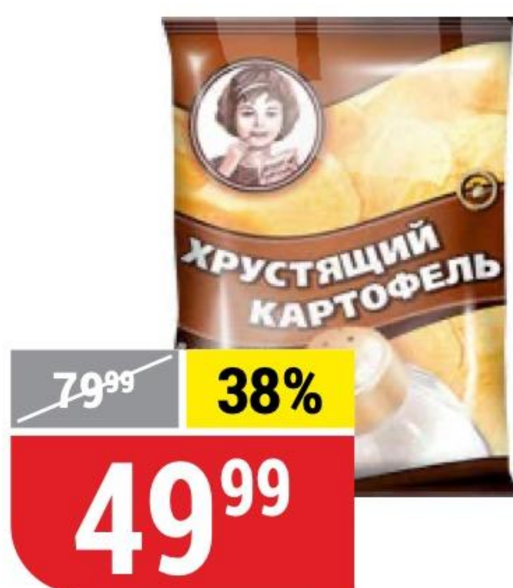
ЧИПСЫ ХРУСТЯЩИЙ КАРТОФЕЛЬ соль, 70 г 100629