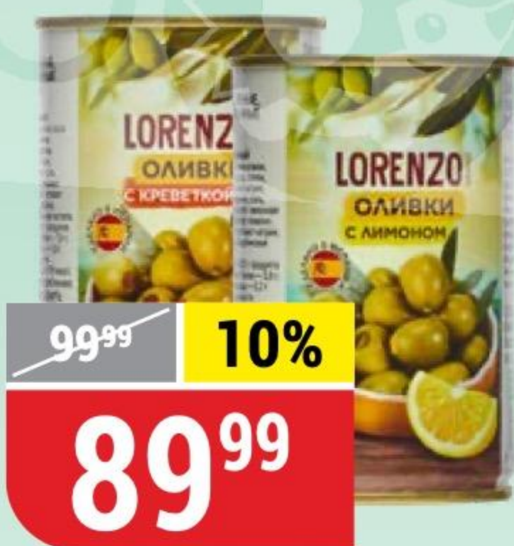
ОЛИВКИ LORENZO GRAND в ассортименте, 314 мл 158078/158080