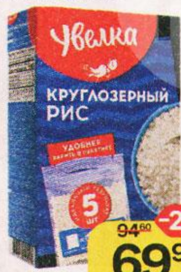
Рис УВЕЛКА , Круглозерный шлифованный, 5 пакетиков х 80 г