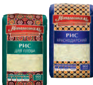
РИС НАЦИОНАЛЬ, 800-900 г, в ассортименте