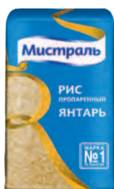
РИС МИСТРАЛЬ ЯНТАРЬ, высший сорт, 900 г