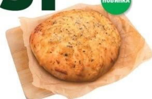
ЛЕПЕШКА СЫРНАЯ «ПРОВАНС», 110 Г