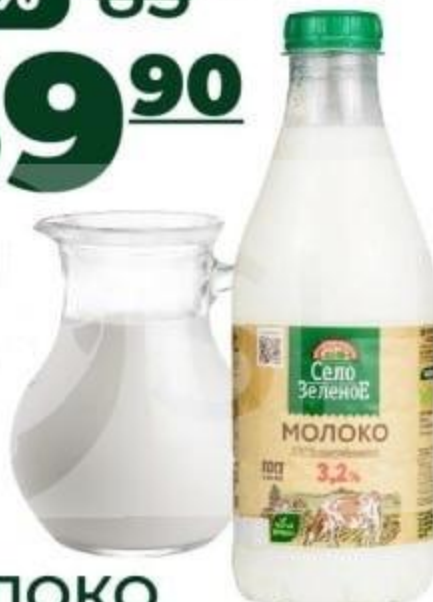
МОЛОКО «СЕЛО ЗЕЛЕНОЕ», 3,2%, 930 Г