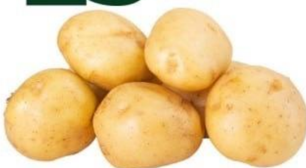
КАРТОФЕЛЬ МОЛОДОЙ, БЕЛЫЙ, 1 КГ