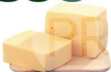
СЫР «СЛИВОЧНЫЙ», ТМ «АЛЕКСЕЕВСКИЕ СЫРЫ», 45%, 1 КГ