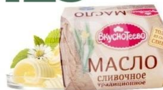
МАСЛО ТРАДИЦИОННОЕ «ВКУСНОТЕЕВО», 82,5%, 200 Г