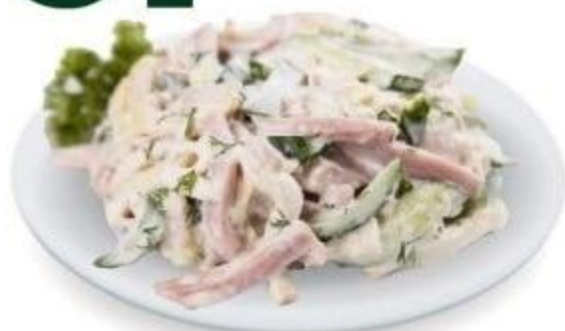
САЛАТ «СМАК», 100 Г