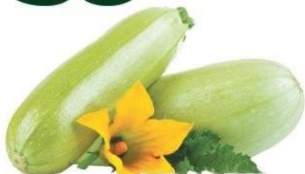
КАБАЧКИ, 1 КГ