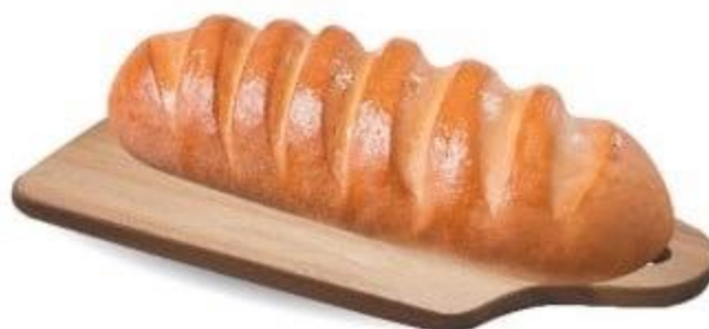
БАТОН «МОЛОЧНЫЙ», 250 Г