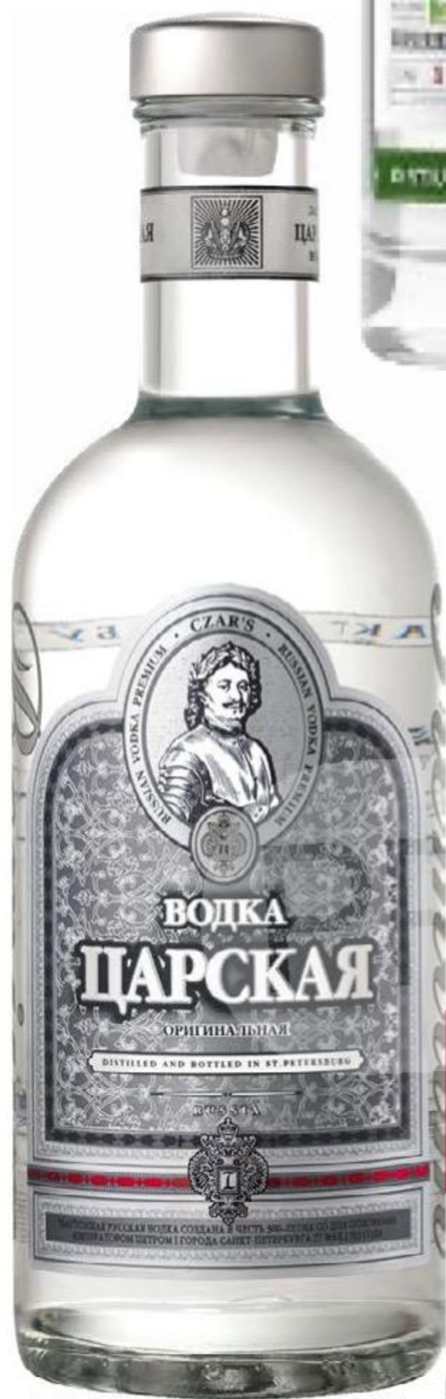
ВОДКА ЦАРСКАЯ ОРИГИНАЛЬНАЯ