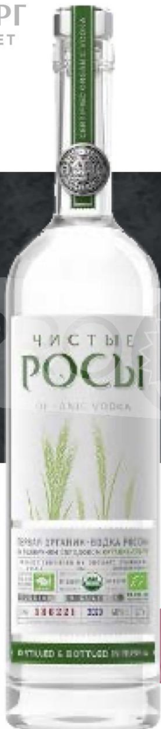
ВОДКА ЧИСТЫЕ РОСЫ ORGANIC 40% | 0.7 л | РОССИЯ

Рекомендуемая температура подачи: 6–12 °С