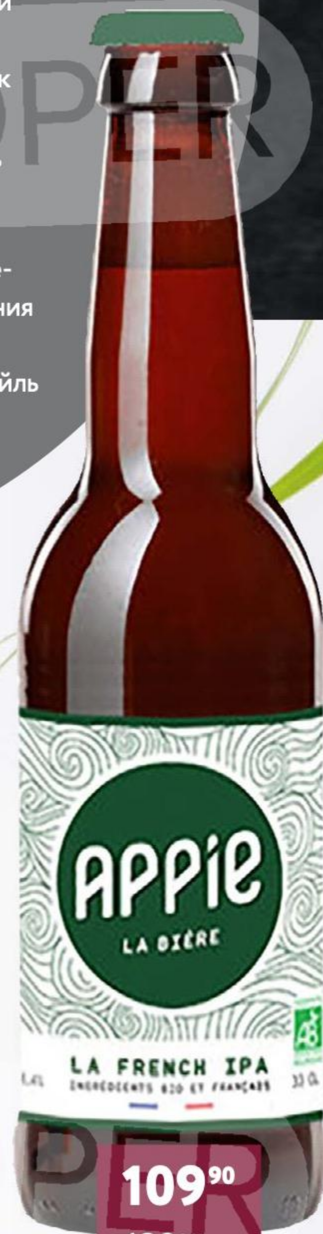
ПИВО APPIE IPA 6% | 0.33 л | ФРАНЦИЯ