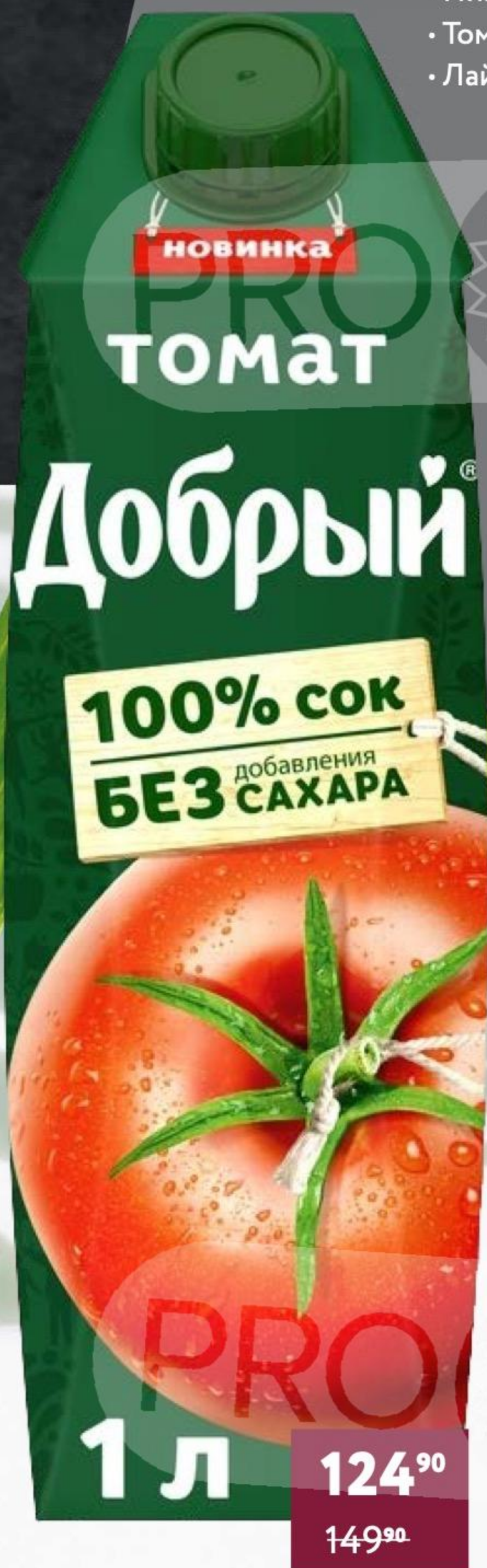
ТОМАТНЫЙ СОК «ДОБРЫЙ» 1 л