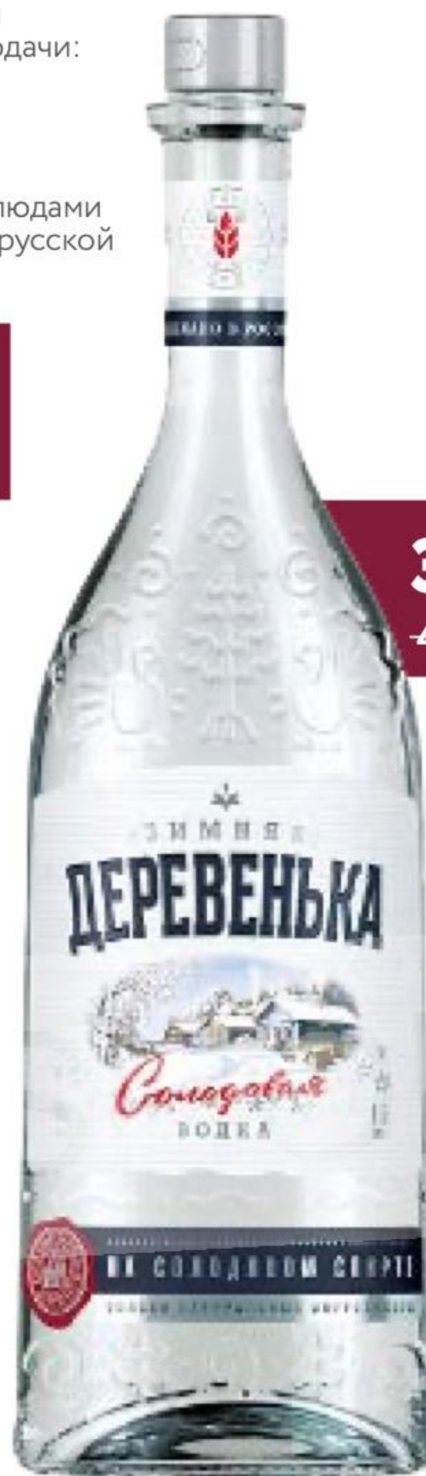
ВОДКА ЗИМНЯЯ ДЕРЕВЕНЬКА

НА СОЛОДОВОМ СПИРТЕ АЛЬФА | 40% | 0.5 л | РОССИЯ