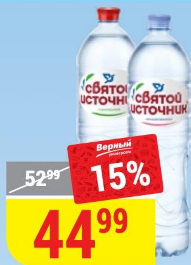
ВОДА СВЯТОЙ ИСТОЧНИК природная, питьевая, газированная; негазированная, 1,5 л 100690/100689