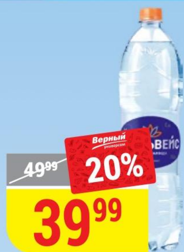
ВОДА ЭДЕЛЬВЕЙС лечебно-столовая, 1,5 л 100688