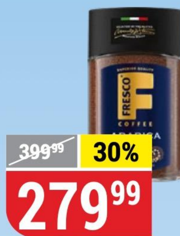
КОФЕ FRESCO arabica doppio, растворимый с добавлением молотого, 100 г 156721