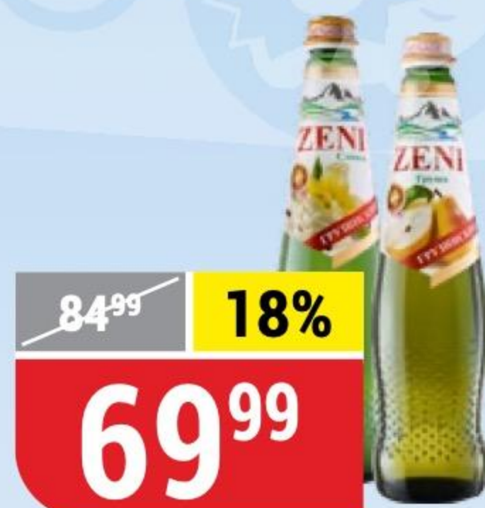
ЛИМОНАД ZENI сливки; груша, 0,5 л 157750/157746