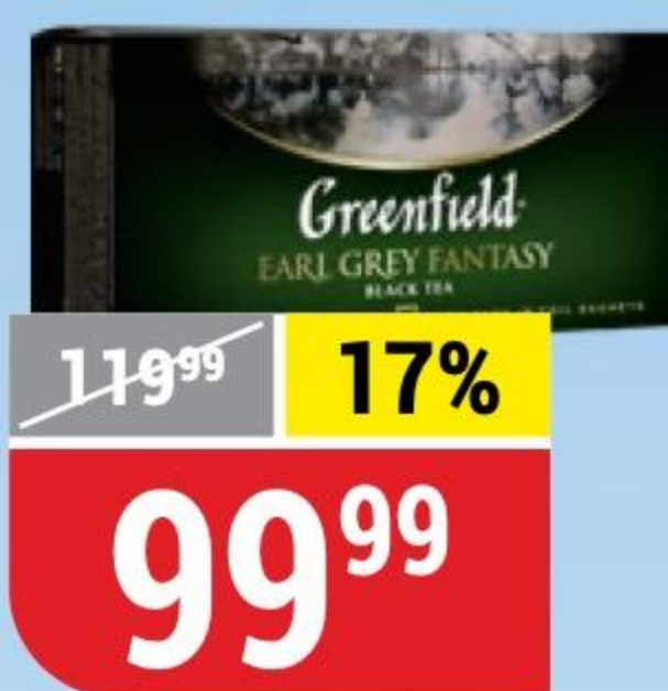
ЧАЙ GREENFIELD earl grey fantasy, черный, 25 пак. x 2 г 130711