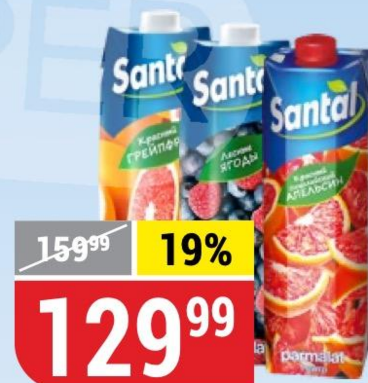
НАПИТОК SANTAL в ассортименте, 1 л 172835/134166/154639