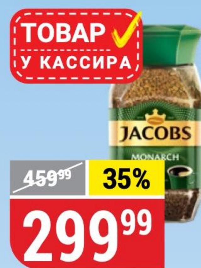
КОФЕ JACOBS MONARCH растворимый, 95 г 100875