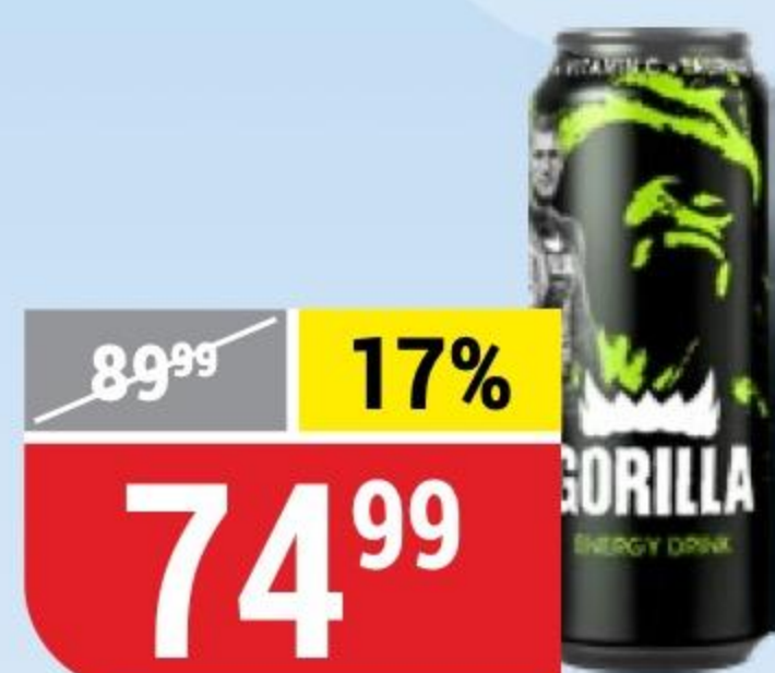
НАПИТОК GORILLA extra energy, энергетический, 450 мл 173205