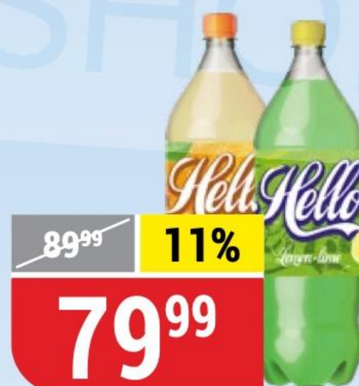
НАПИТОК HELLO STAR lemon-lime; дюшес, 2 л 146982/151337