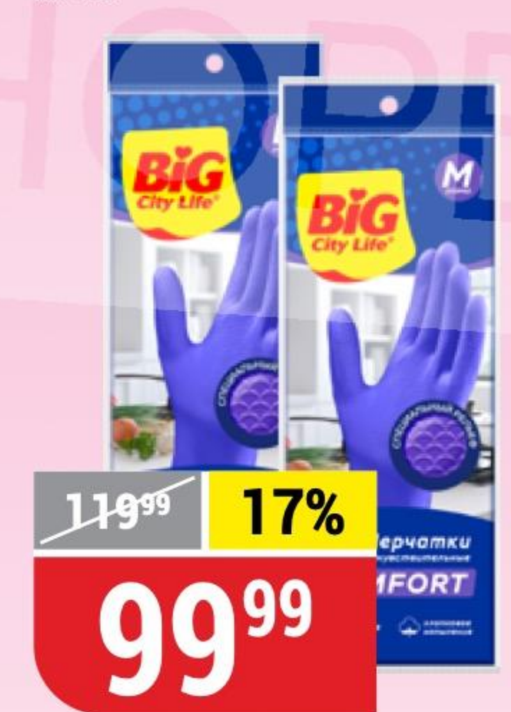
ПЕРЧАТКИ ХОЗЯЙСТВЕННЫЕ BIG CITY латексные, фиолетовые, р. M; L, 1 пара 173845