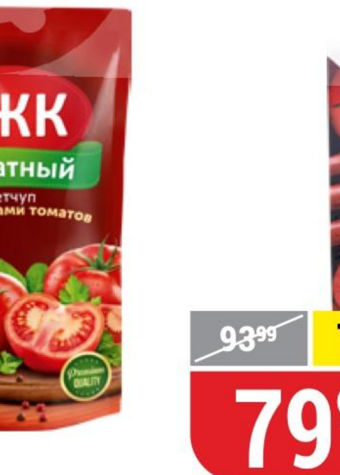
КЕТЧУП ТОМАТНЫЙ ЕЖК, 350 г 145679