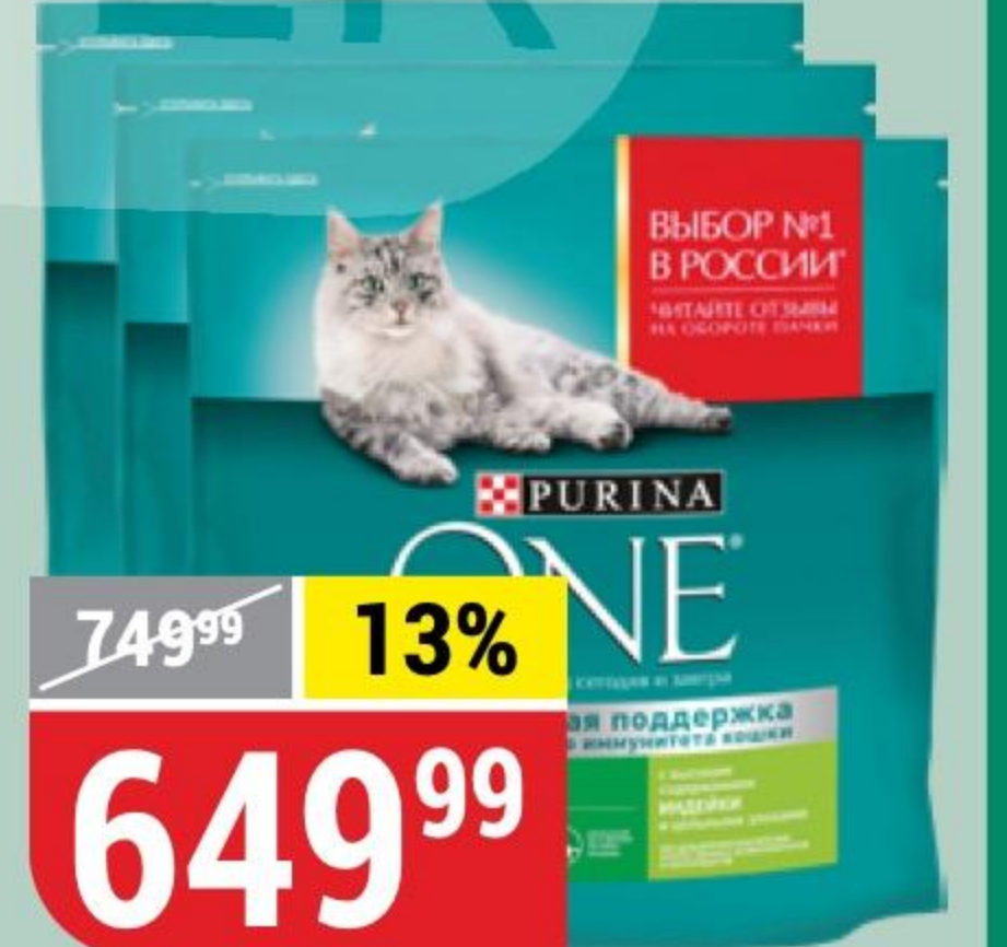
КОРМ ДЛЯ КОШЕК PURINA ONE в ассортименте, 1,5 кг 147478/164419/168152