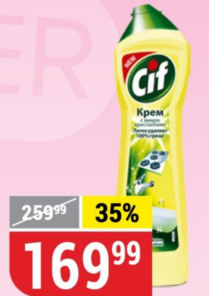
ЧИСТЯЩИЙ КРЕМ CIF лимон, 500 мл 145130