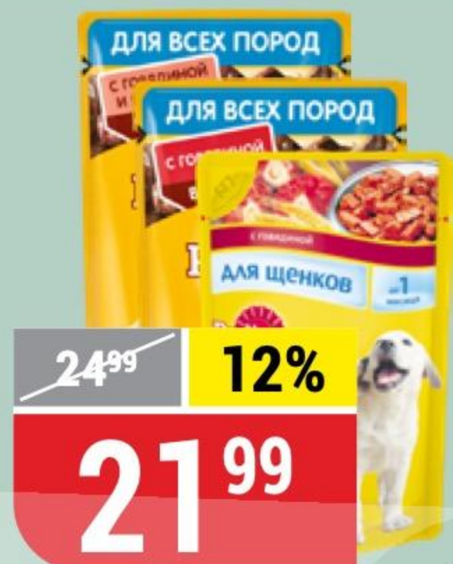
КОРМ ДЛЯ СОБАК PEDIGREE в ассортименте, 85 г 146071/146072/118301