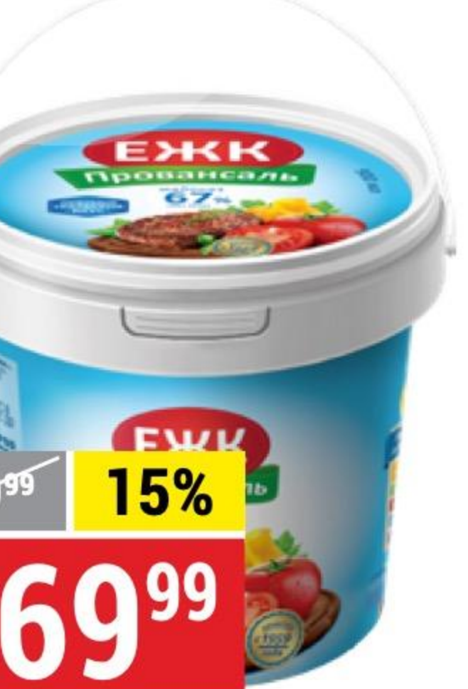
МАЙОНЕЗ ПРОВАНСАЛЬ 67%, ЕЖК, 868 г 107179