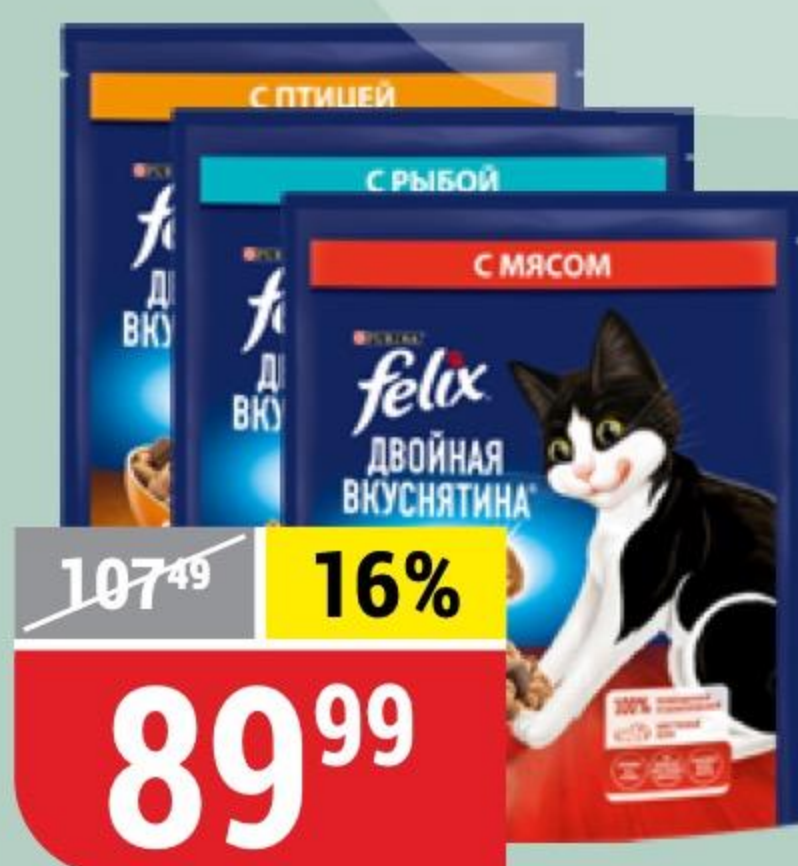
КОРМ ДЛЯ КОШЕК FELIX в ассортименте, 200 г 168056/168054/168160/168177