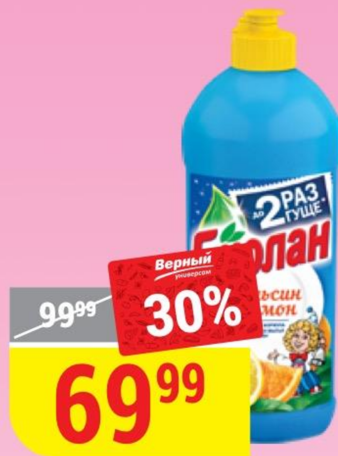
СРЕДСТВО ДЛЯ МЫТЬЯ ПОСУДЫ БИОЛАН апельсин и лимон, 450 г 132416