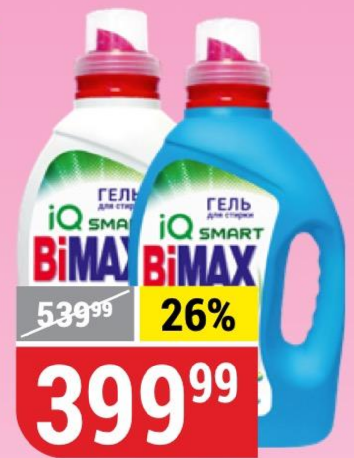
СРЕДСТВО ДЛЯ СТИРКИ BIMAX color; 100 пятен, гель, 1,3 л 153631/153637