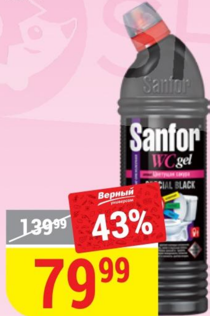
ЧИСТЯЩЕЕ СРЕДСТВО SANFOR special black, 750 мл 110032