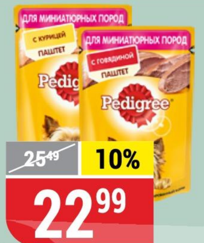
КОРМ ДЛЯ СОБАК PEDIGREE для мелких пород, говядина; курица, 80 г 146009/146011