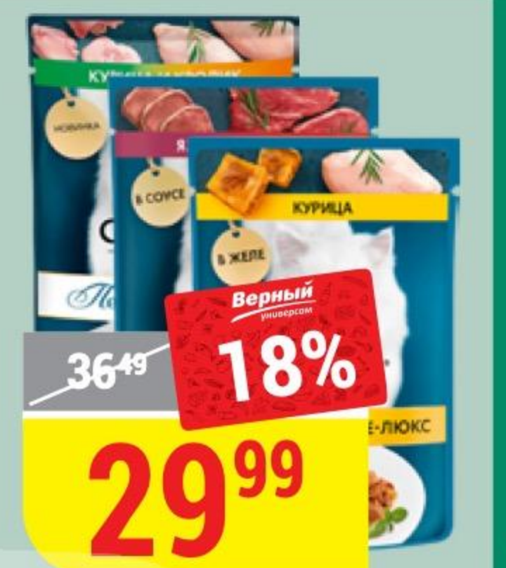
КОРМ ДЛЯ КОШЕК ГУРМЭ в ассортименте, 75 г 176982/176980/176971/176967/176973