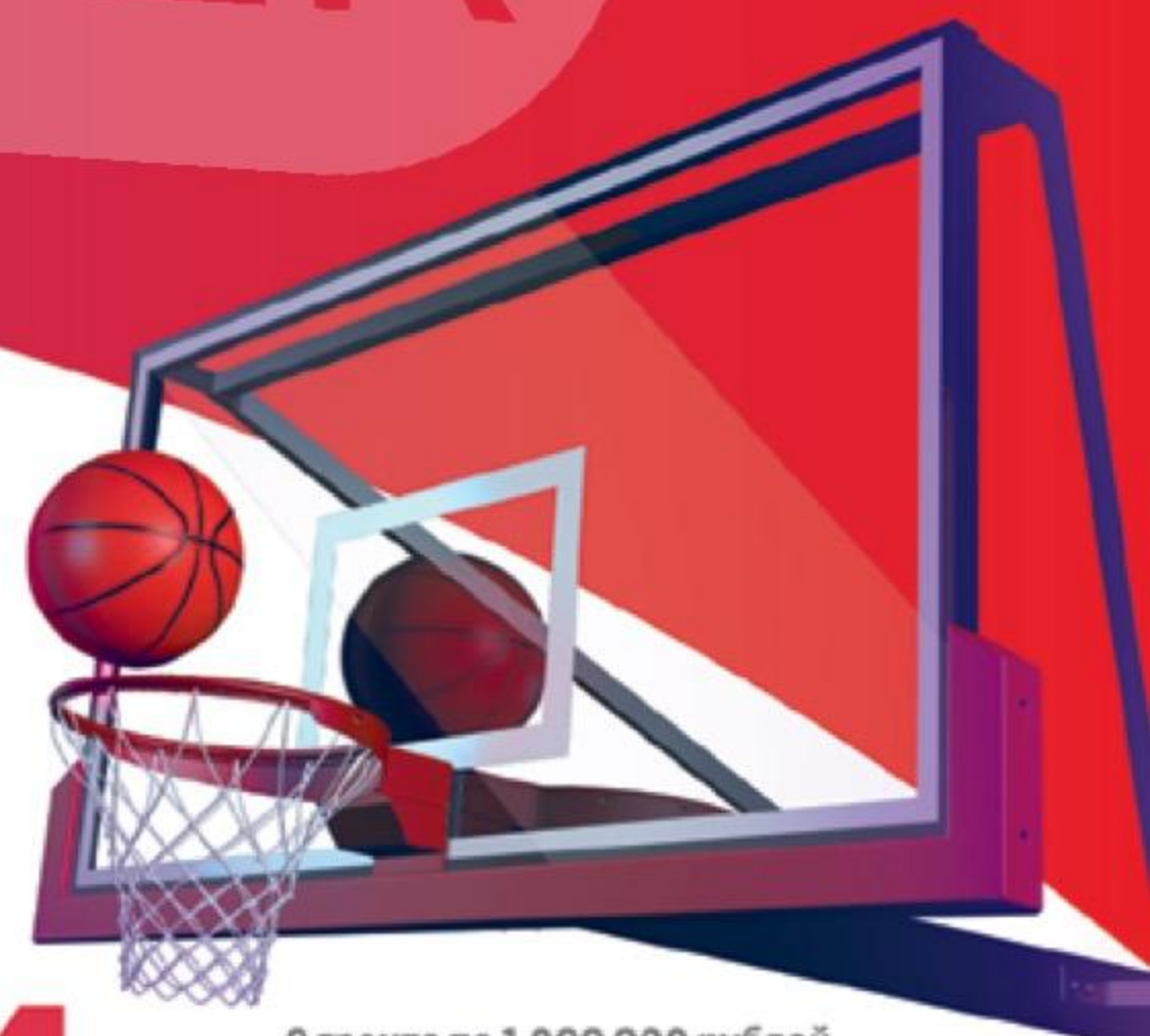
2 гранта по 1 000 000 рублей на спортивные площадки для школ****

ПРИНЕСИ ДНЕВНИК С ПЯТЁРКАМИ и выиграй поездку в турецкий