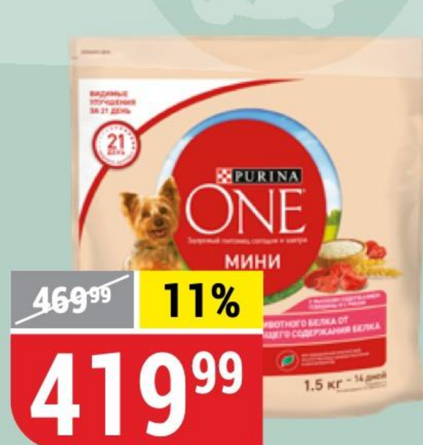
КОРМ ДЛЯ СОБАК PURINA ONE говядина-рис, 1,5 кг 168196