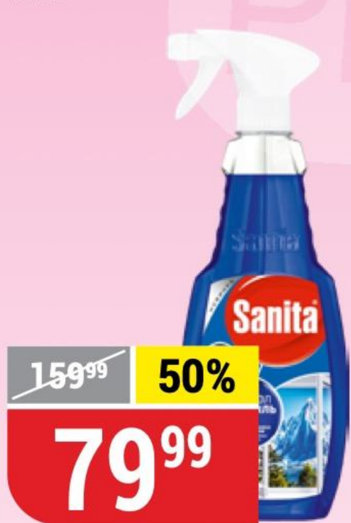
СРЕДСТВО ДЛЯ СТЕКОЛ SANITA антипыль, 500 г 110049