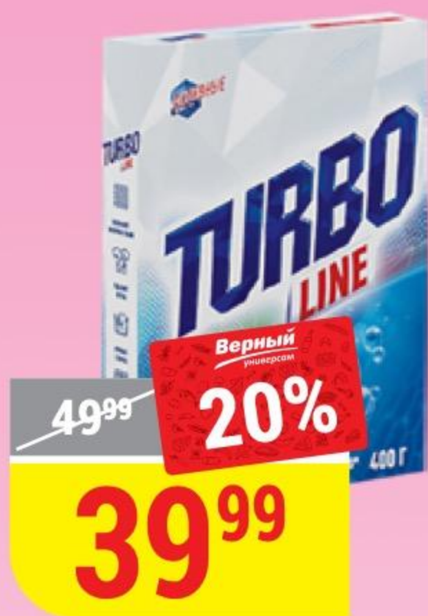
СТИРАЛЬНЫЙ ПОРОШОК TURBO LINE ручная стирка, 400 г 141915