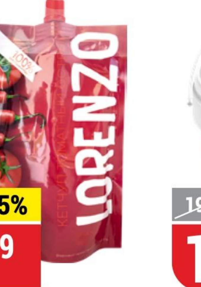
КЕТЧУП LORENZO томатный, острый, 350 г 152711