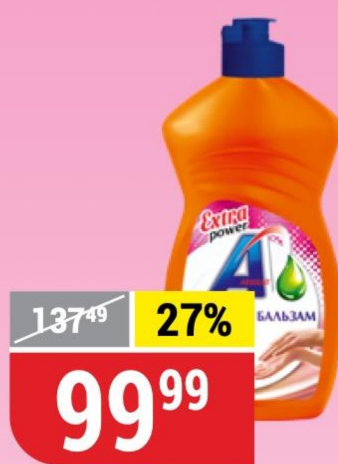
СРЕДСТВО ДЛЯ МЫТЬЯ ПОСУДЫ AOS бальзам, 450 г 132414