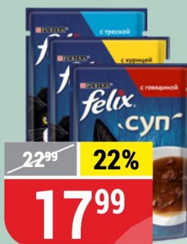
КОРМ ДЛЯ КОШЕК FELIX суп, в ассортименте, 48 г 168067/168069/168184