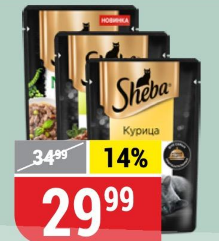
КОРМ ДЛЯ КОШЕК SHEBA в ассортименте, 75 г 175660/166703/166705/164220/175656