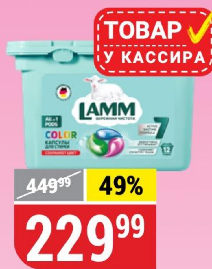
СРЕДСТВО ДЛЯ СТИРКИ LAMM color, капсулы, 12 шт. 177712