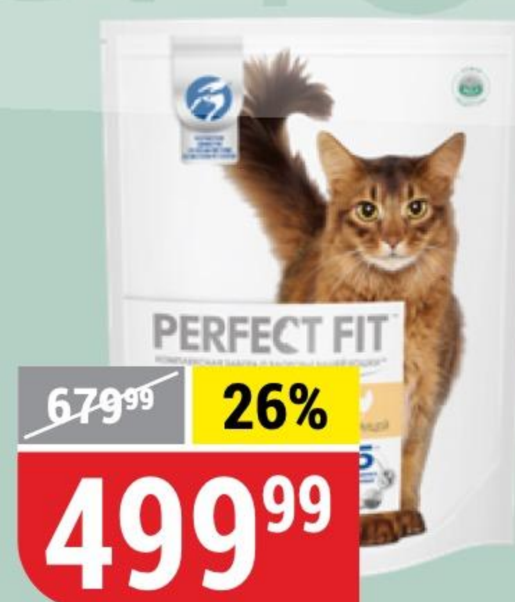
КОРМ ДЛЯ КОШЕК PERFECT FIT для стерилизованных котов и кошек, курица, 1,2 кг 132662