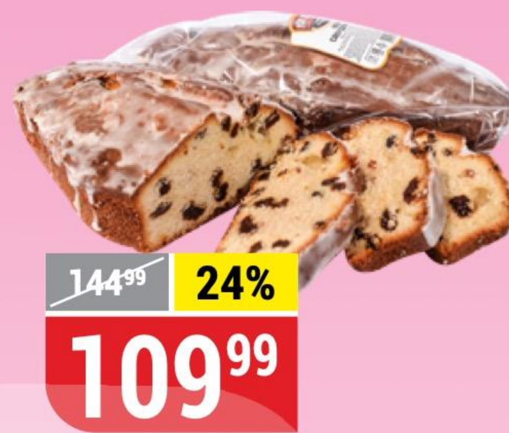
КЕКС СВЕРДЛОВСКИЙ Режевской ХК, 500 г 117837