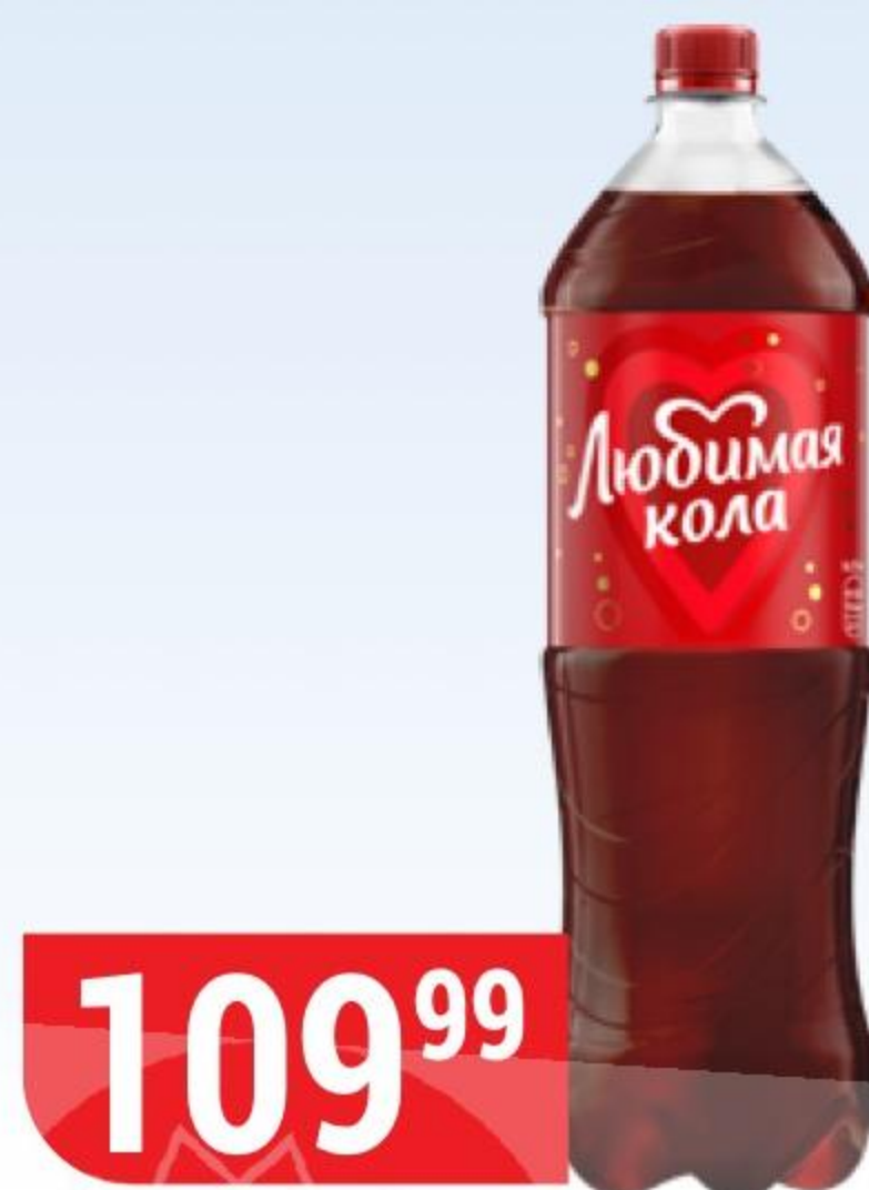
НАПИТОК ЛЮБИМАЯ КОЛА 1,5 л 180352