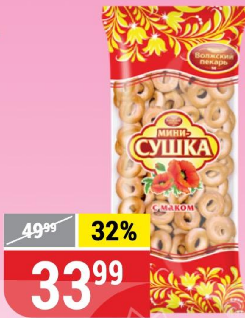
МИНИ-СУШКА с маком, Волжский Пекарь, 180 г 173389