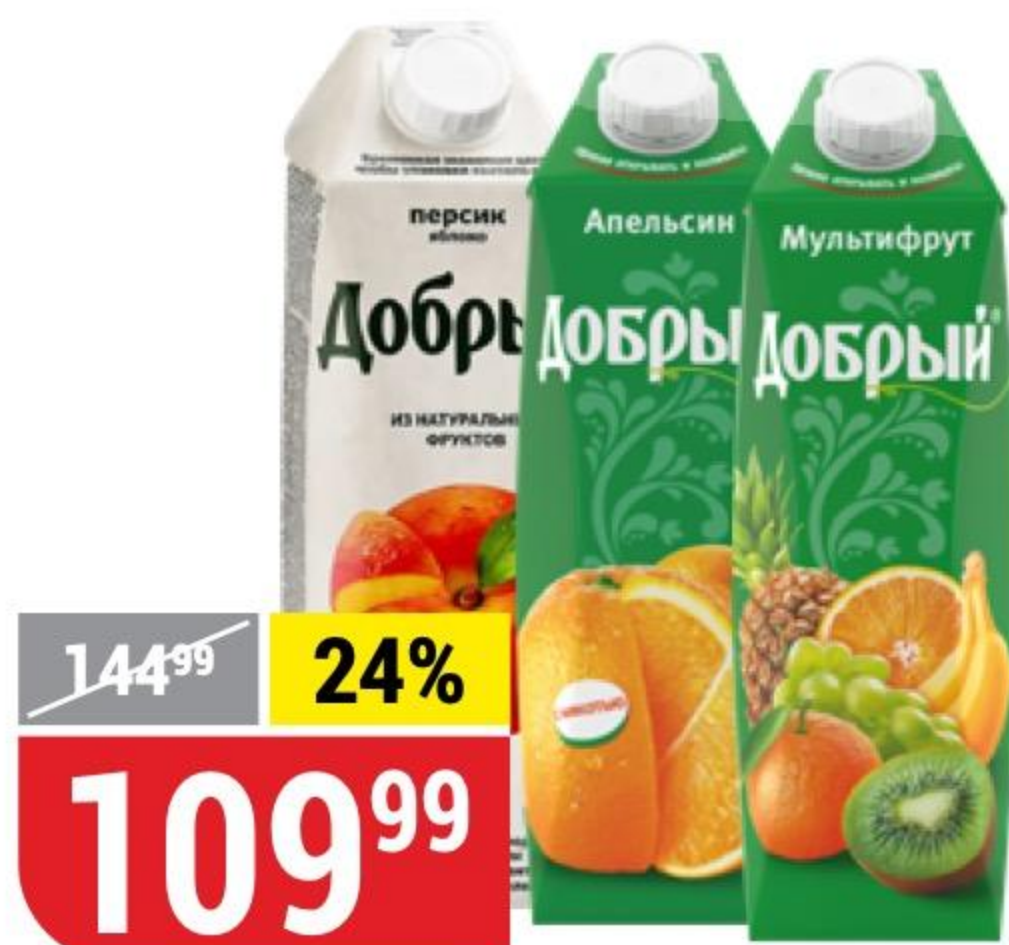
НЕКТАР ДОБРЫЙ в ассортименте, 1 л 101773/101774/101775