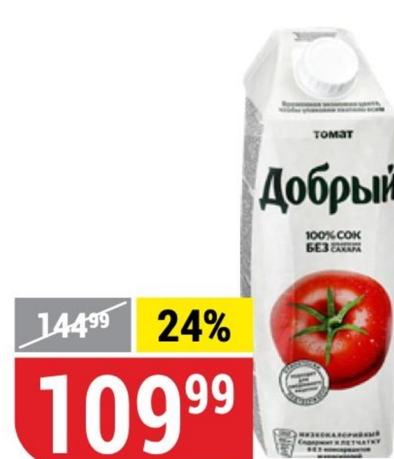
СОК ДОБРЫЙ томат, 1 л 101776