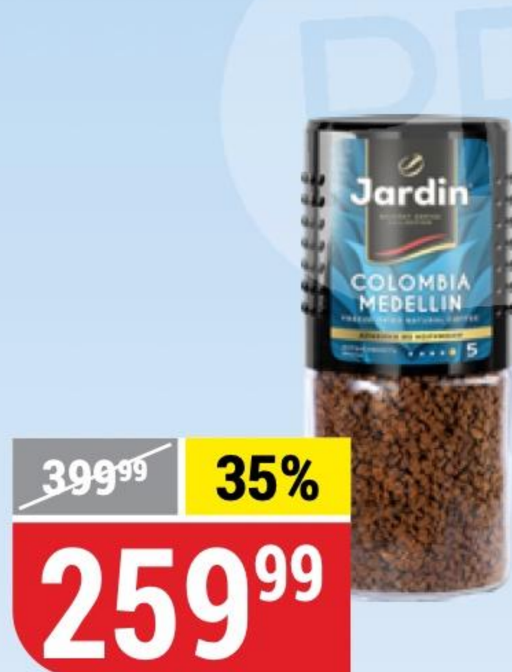
КОФЕ JARDIN Colombia Medellin, растворимый, 95 г 131320