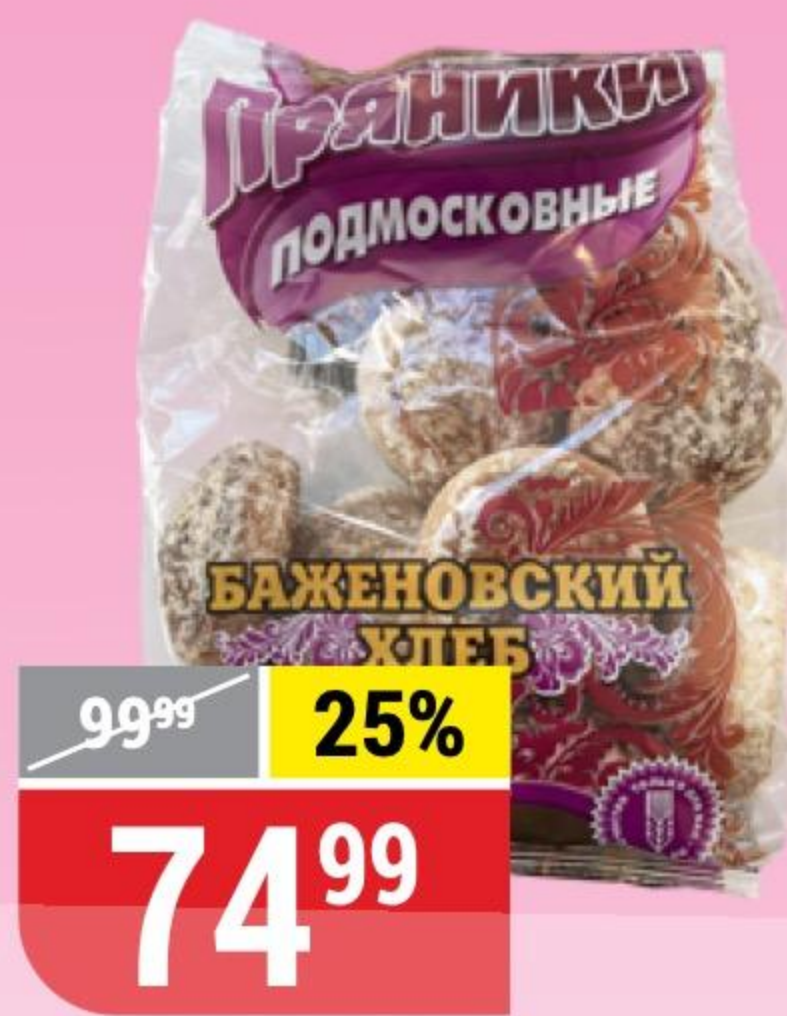
ПРЯНИКИ ПОДМОСКОВНЫЕ Баженовский Хлеб, 500 г 180256