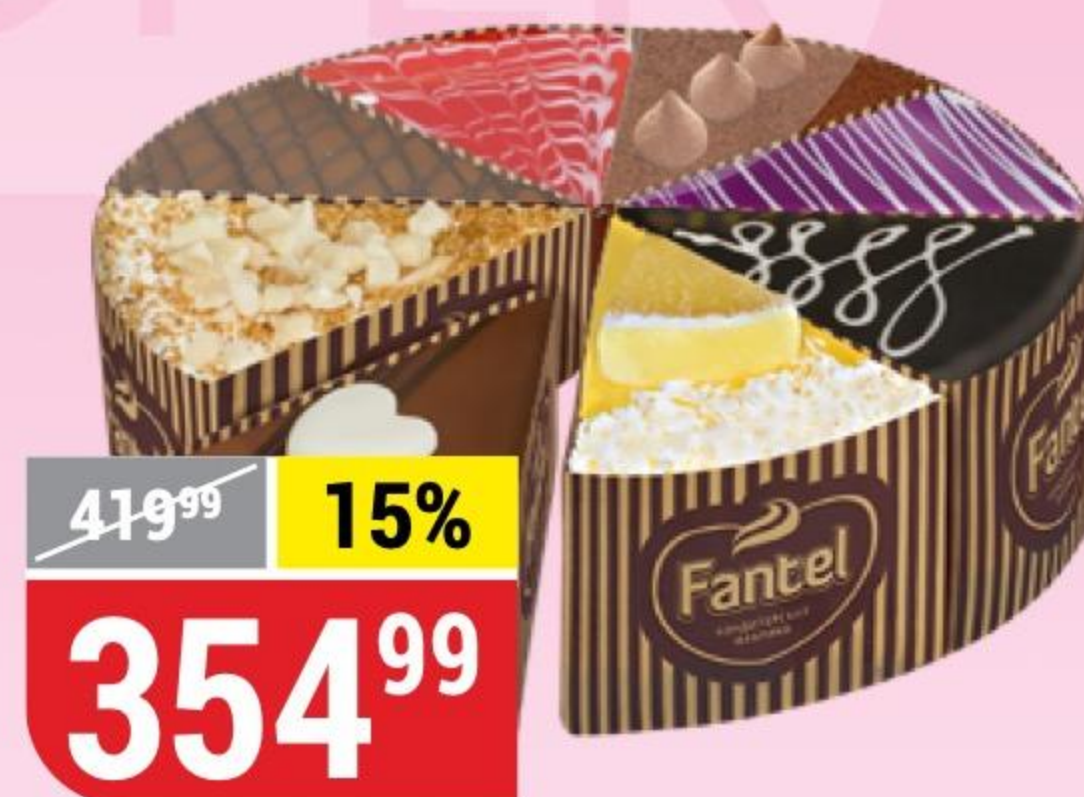
ТОРТ ЖЕЛАНИЕ Fantel, 625 г 152298