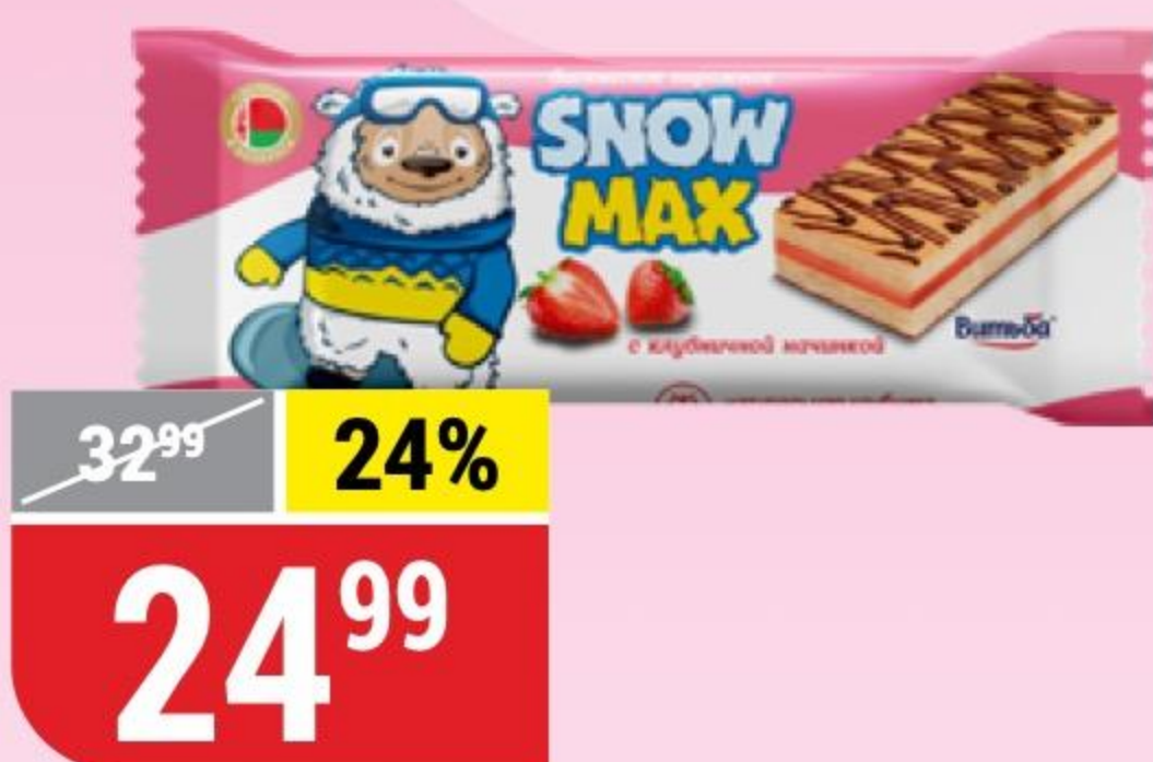
ПИРОЖНОЕ SNOW MAX бисквитное, глазированное, клубничная начинка, 30 г 173354