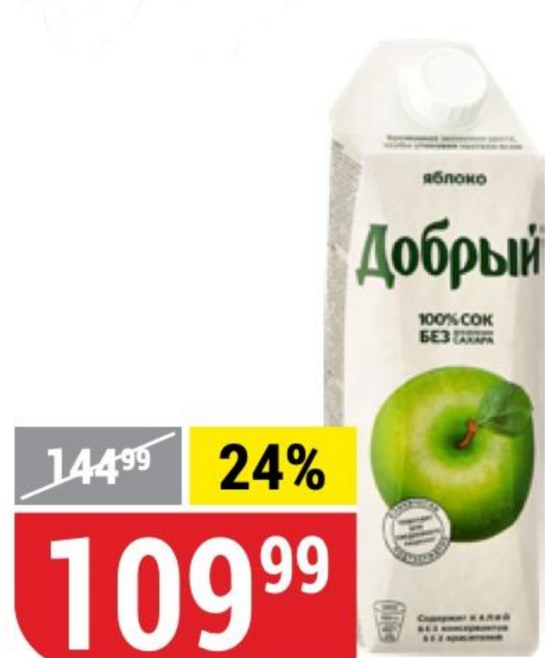
СОК ДОБРЫЙ яблоко, 1 л 101772