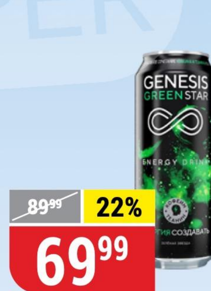
НАПИТОК GENESIS GREEN STAR энергетический, 0,45 л 180688