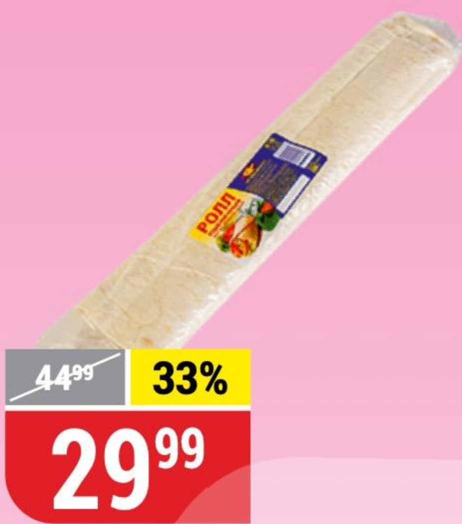
РОЛЛ ПШЕНИЧНЫЙ Мхитарян, 200 г 127153