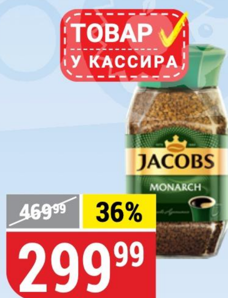
КОФЕ JACOBS MONARCH растворимый, 95 г 100875