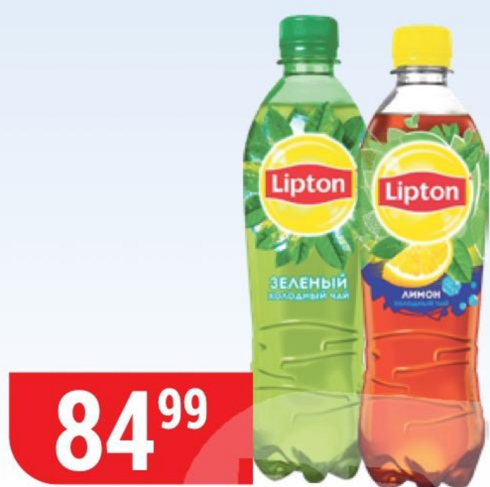
ХОЛОДНЫЙ ЧАЙ LIPTON лимон; зеленый, 0,5 л 121846/121847