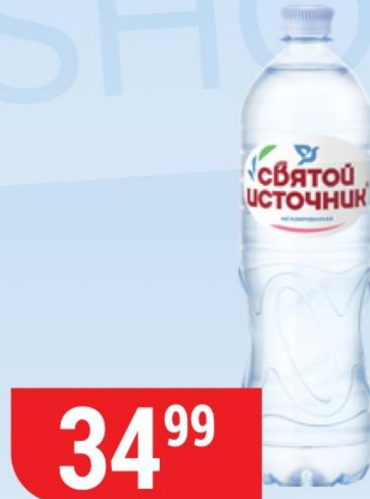
ВОДА СВЯТОЙ ИСТОЧНИК природная, негазированная, 1 л 131780