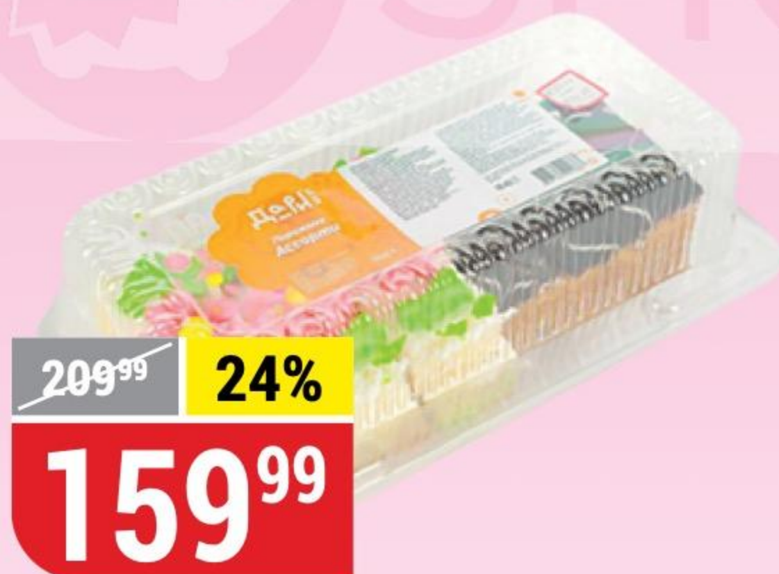
ПИРОЖНОЕ АССОРТИ Дари Вкус, 350 г 172596