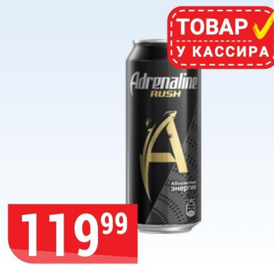
НАПИТОК ADRENALINE RUSH энергетический, 0,449 л 154671