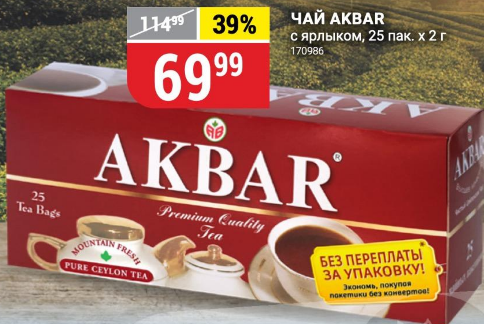
ЧАЙ АКВАР с ярлыком, 25 пак. x 2 г 170986