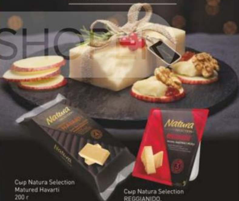
Сыр Natura Selection Matured Havarti 200 г