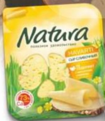
Сыр Оливочный Natura нарезка 150 г