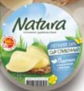
Сыр Лепной Natura 400 г