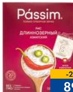
РИС PASSIM АЗИАТСКИЙ, длиннозерный, 500 г, 4 пак. в уп.