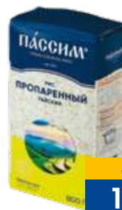
РИС ПАССИМ ТАЙСКИЙ, длиннозерный, пропаренный, 800 г