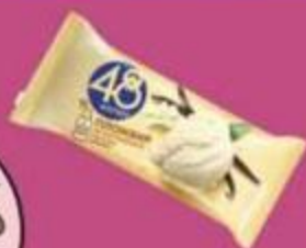
Мороженое "48 копеек", пломбир, 400 мл