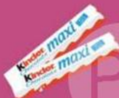
Шоколад "Киндер", 50 г макс, 21 г