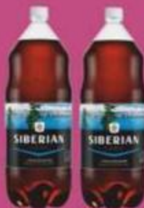
Напиток "ИЗРМВ", сибиряк лэнд, 2 л