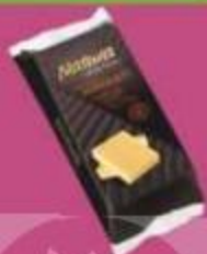
Сыр "Натура", хястелло мат'юред хаварты, 45%, 200 г