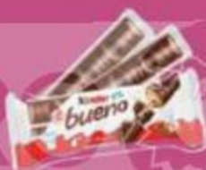
Батончик "Киндер", буэно, 43 г