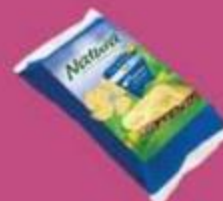
Сыр "Натура", тильзентер, 50%, 250 г