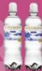
Вода "Байкальская", спорт, питьевая, 500 мл