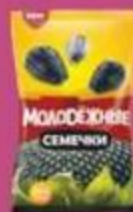
Семячки "Молодежные", черные, 200 г