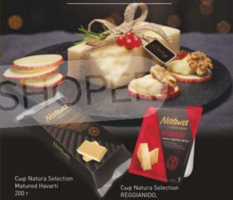
Сыр Natura Selection Matured Havarti 200 г