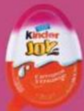
Яйцо шоколадное "Киндер", джой, для девочек, классика герои мультфильмов, 20 г