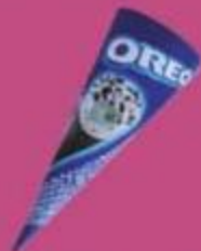
Мороженое "Орео", рожок, 120 мл