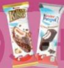
Пирожное "Киндер", молочный лонтик, 26 г, макс кинг, 35 г, делис 39 г пинги с шоколадом, 30 г