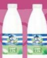
Кефир "Простоквашино", 2,5%, 930 г