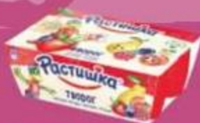
Творог "Растышка", клубника-банан-пломбир, клубника-абрикос, лесные ягоды, персик-груша, 6 шт x 45 г