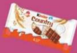
Шоколад "Киндер", макси, со злаками, 84-100 г