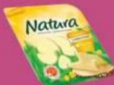
Сыр "Натура", сливочный нарезка, 45%, 150 г