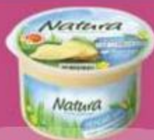
Сыр "Натура", легкий 30%, 400 г