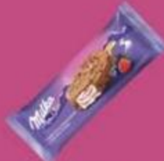
Мороженое эскимо "Милка", лесные ягоды, 64 г