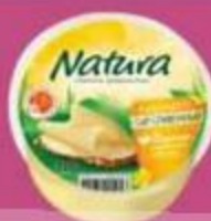
Сыр "Натура", сливочный, 45%, 300 г