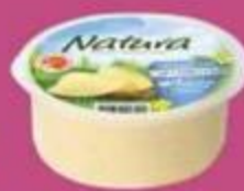
Сыр "Натура", легкий 16%, 200 г