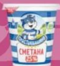
Сметана "Простоквашино", 10-25%, 300 г