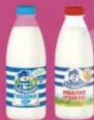
Молоко "Простоквашино", топленое 3,2%, 930 мл, отборное 3,4-4,5%, 930 мл, 2,5% 930 мл