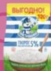
Творог "Простоквашино", 5-9%, 320 г