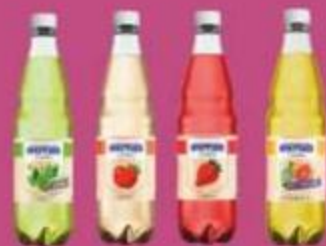
Минеральная вода соком "Иркутская", яблоко, цитрусовый микс, мята, клубника, 600 мл