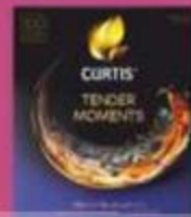
Чай "Кертис", тендер моментс с черниковой л'жавиковой и мятой, 100 пак