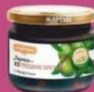
Варенье из грецких орехов "Мартин", 390 г