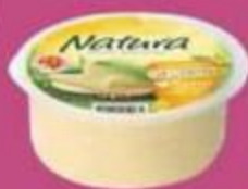
Сыр "Натура", сливочный, 45%, 200 г