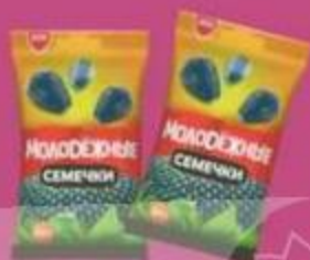
Семечки "Молодежные", черные, 100 г