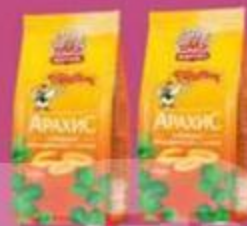
Арахис "от Мартина", отборный жареный с солью, 100 г