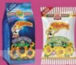
Семечки "от Мартина", черные с морской солью, отборные, белые сальные, 100 г