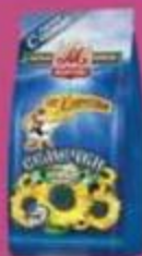
Семячки "от Мартина", в ассортименте 100-200 г