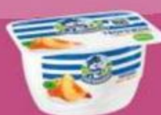
Творожок "Простоквашино", в ассортименте, 3,6% 130 г