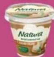
Сыр "Натура", мягкий сливочный, 60%, 150 г, с зеленью 55%, 150 г, с грибами 55%, 150 г