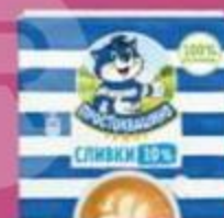
Сливки "Простоквашино", 20-30%, 500 г