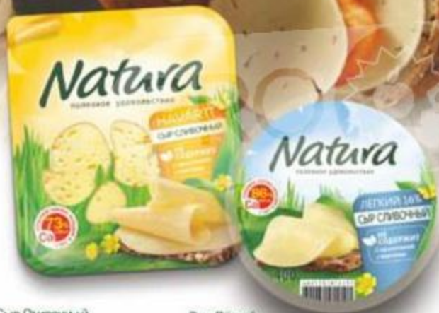
Сыр Сливочный Natura нарезка 150 г