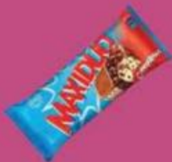
Мороженое "Нестле Максидуо", страчателла, 92 г