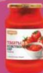
Томаты "Мартин" в собственном соку, 930 г