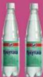
Вода "Иркутская", минеральная газированная, 600 мл