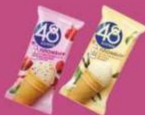
Мороженое "48 копеек", пломбир 160 мл, пломбир малина вафельный стакан, 160 мл, шоколадный пломбир, 160 мл, рожок пломбир, 200 мл