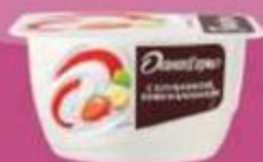
Творожок "Даниссимо", в ассортименте, 5,6% 110 г