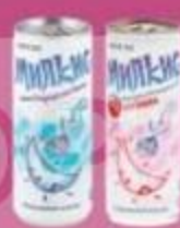
Напиток газированный "Молкис", клубника, оригинальный, 250 мл