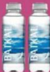
Вода "Байкал", байкальская, глубинная, 450 мл