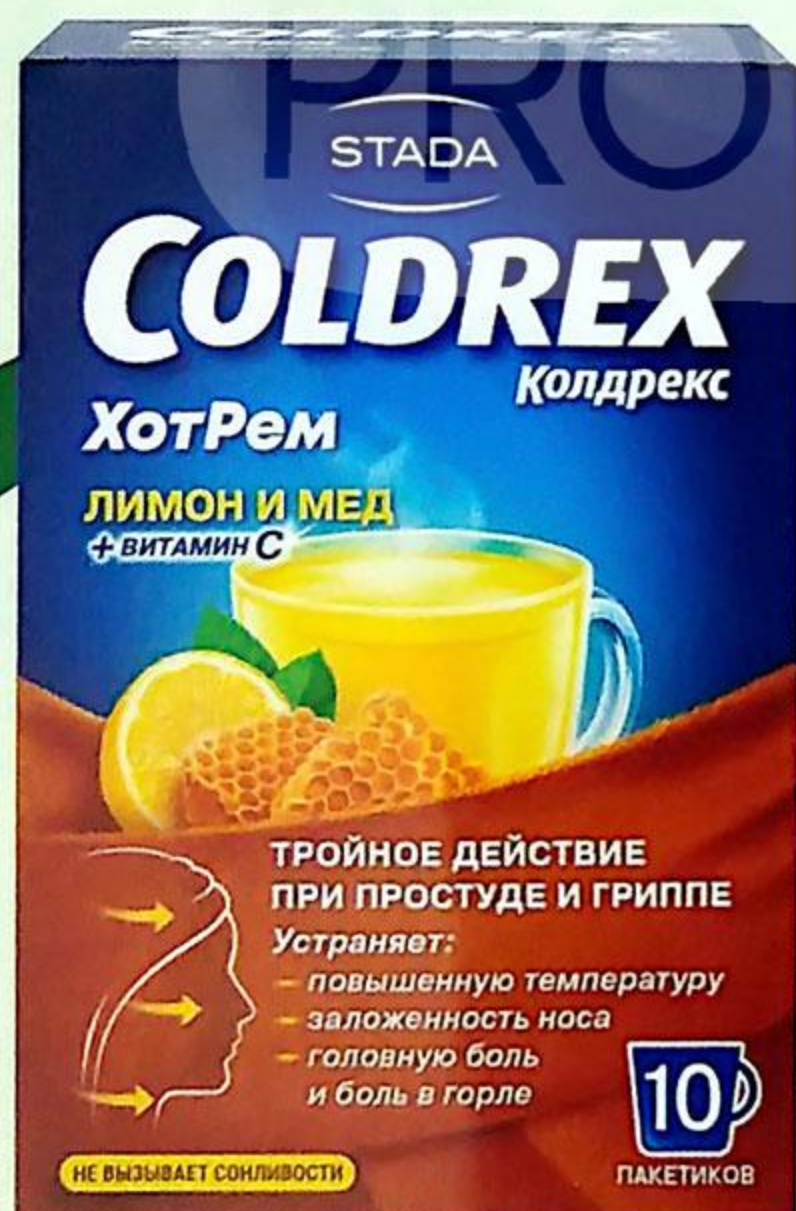
Колдрекс Хотрем пор. пак. Лимон/Мед №10