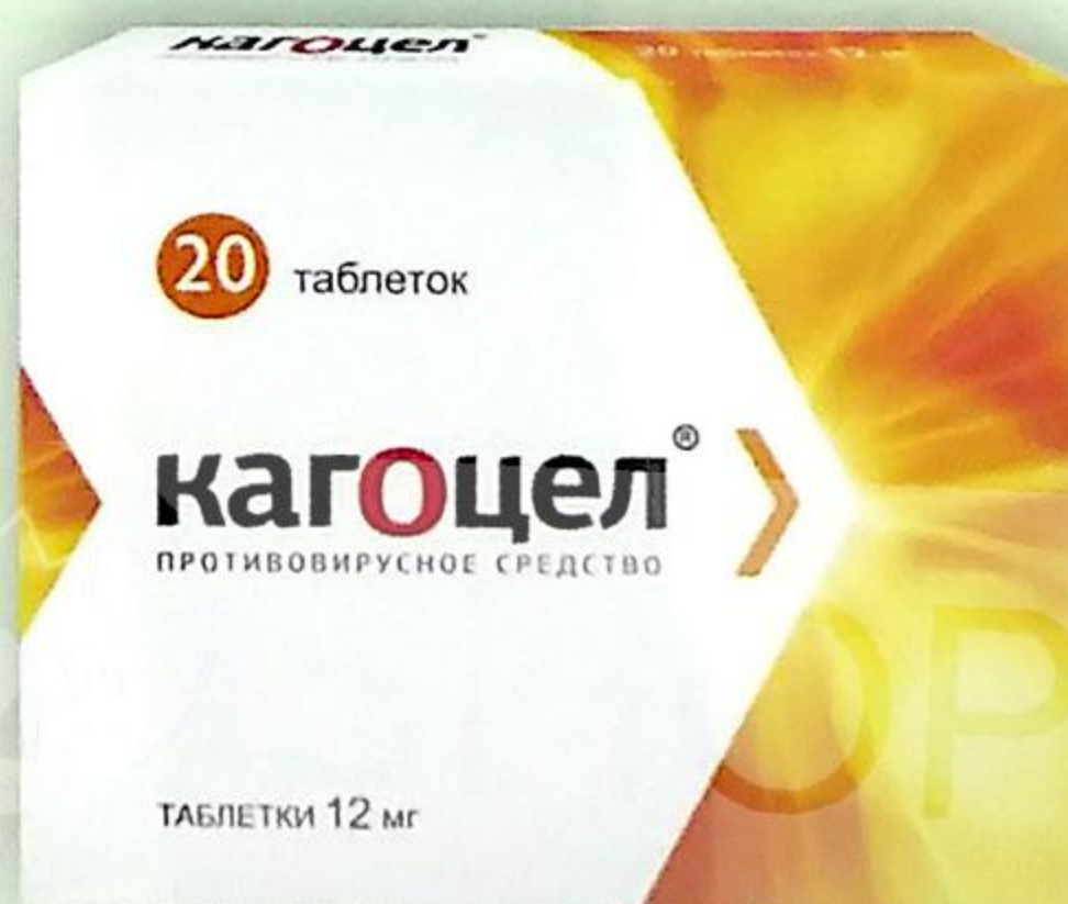
Кагоцел таб. 12 мг №20