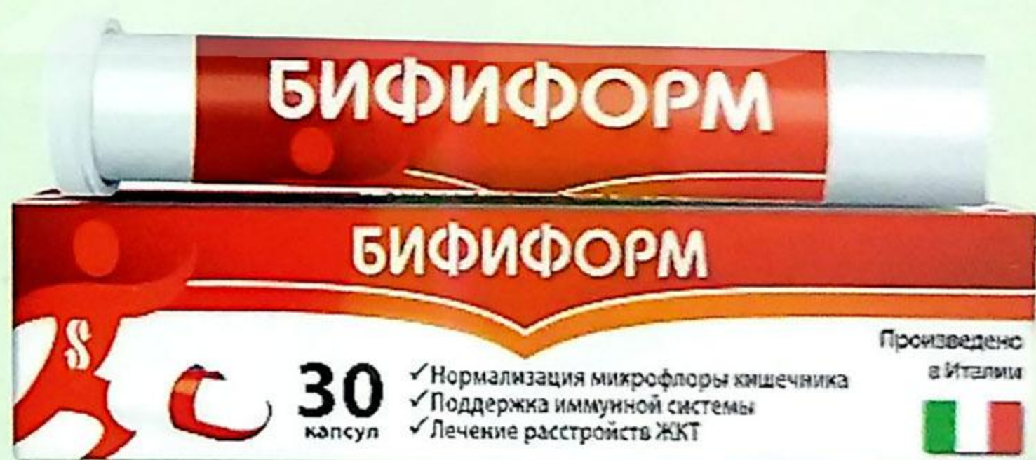
Бифиформ капс. №30