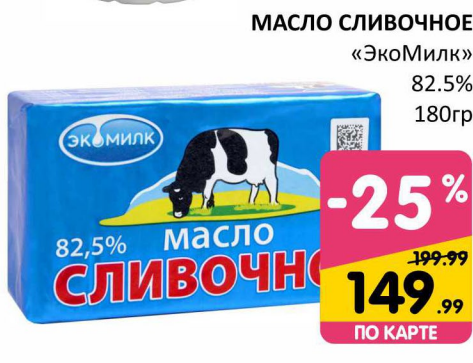
МАСЛО СЛИВОЧНОЕ «ЭкоМилк» 82.5% 180гр