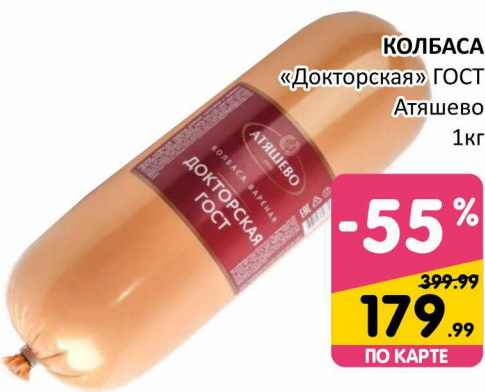
КОЛБАСА «Докторская» ГОСТ Атяшево 1кг