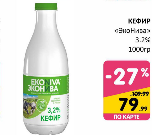
КЕФИР «ЭкоНива» 3.2% 1000гр