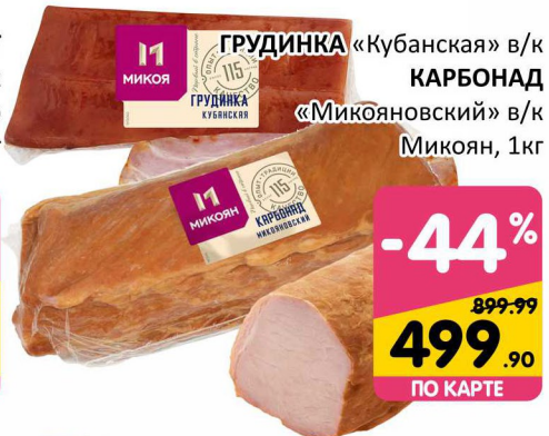
ГРУДИНКА «Кубанская» в/к КАРБОНАД «Микояновский» в/к Микоян, 1кг