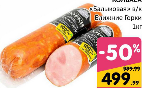
КОЛБАСА «Балыковая» в/к Ближние Горки 1кг