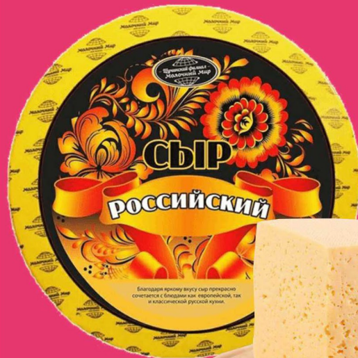
СЫР «Российский» Молочный мир новый экстра 50%, 1кг