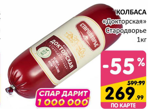
КОЛБАСА «Докторская» Стародворье 1кг