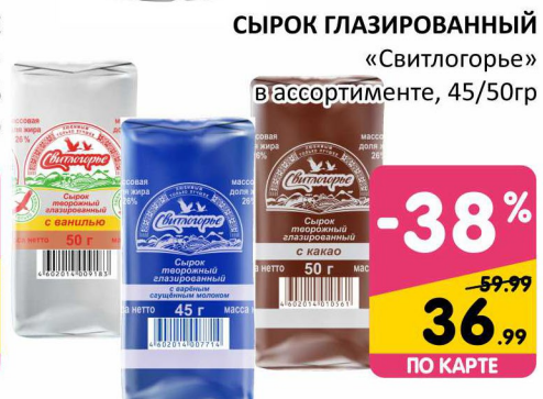
СЫРОК ГЛАЗИРОВАННЫЙ «Свитлогорье» вассортименте, 45/50гр