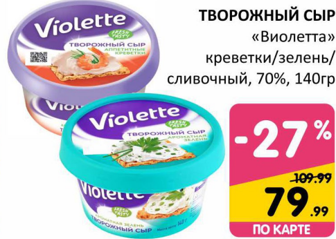
ТВОРОЖНЫЙ СЫР «Виолетта» креветки/зелень/ сливочный, 70%, 140гр