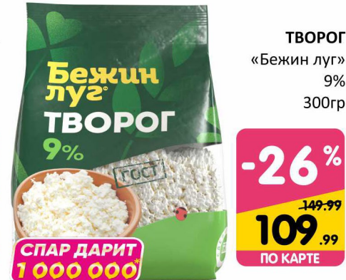
ТВОРОГ «Бежин луг» 9% 300гр