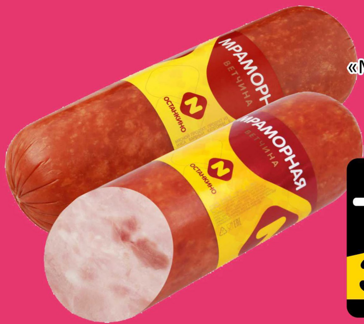
ВЕТЧИНА «Мраморная» Останкино 1кг