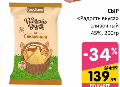
СЫР «Радость вкуса» сливочный 45%, 200гр