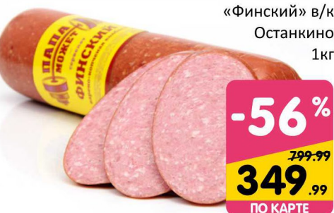
СЕРВЕЛАТ «Финский» в/к Останкино 1кг