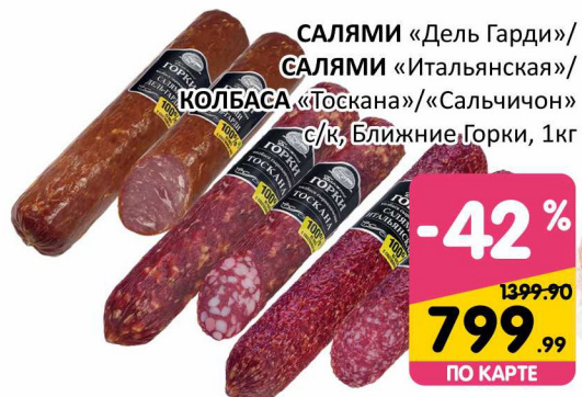
САЛЯМИ «Дель Гарди»/ САЛЯМИ «Итальянская»/ КОЛБАСА «Тоскана»/«Сальчичон» с/к, Ближние Горки, 1кг