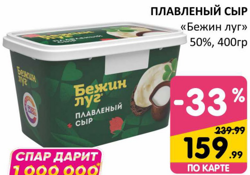
ПЛАВЛЕННЫЙ СЫР «Бежин луг» 50%, 400гр