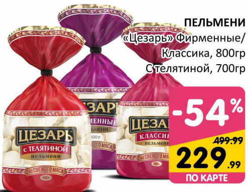
ПЕЛЬМЕНИ «Цезарь» Фирменные/ Классика, 800гр Стелятиной, 700гр