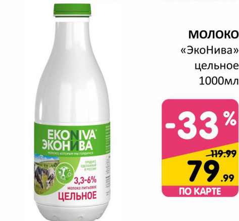
МОЛОКО «ЭкоНива» цельное 1000мл