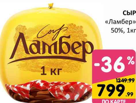
СЫР «Ламбер» 50%, 1кг