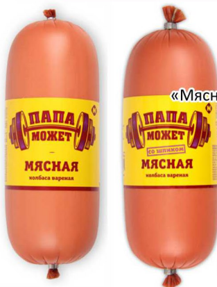
КОЛБАСА «Мясная»/ «Мясная со шпиком» Останкино, 1кг