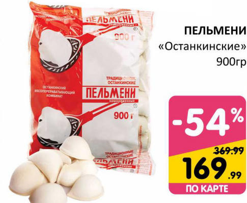
ПЕЛЬМЕНИ «Останкинские» 900гр