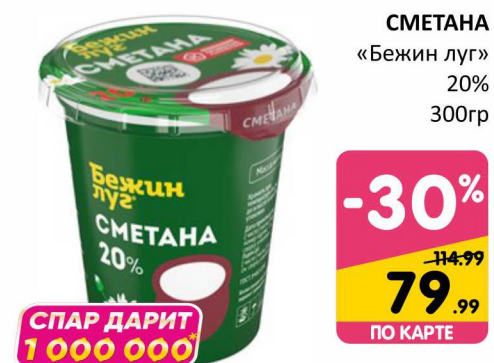
СМЕТАНА «Бежин луг» 20% 300гр