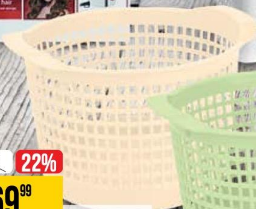
КОРЗИНА ECONOVA универсальная, d 187 мм, 1,8 л, 1 шт. 178317