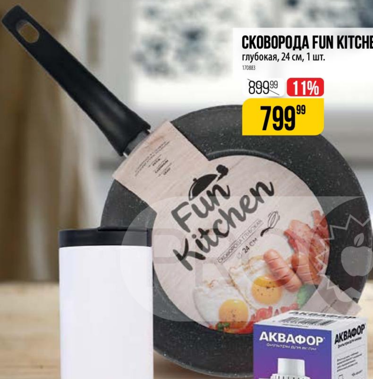
СКОВОРОДА FUN KITCHEN глубокая, 24 см, 1 шт. 170883