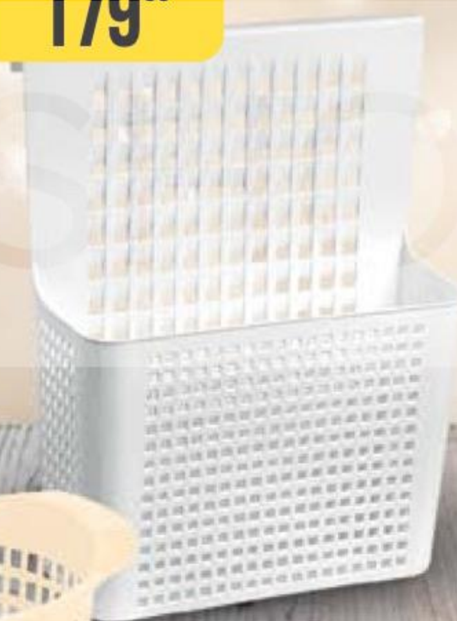
ПАНТОЛЕТЫ ЖЕНСКИЕ р. 36-40, Амора, 1 пара 180974