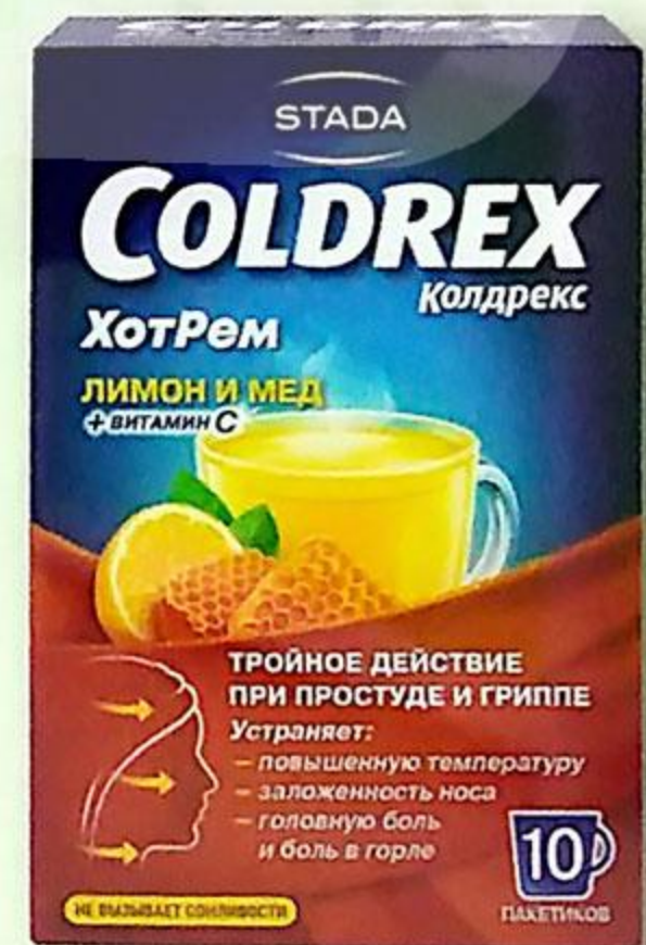
Колдрекс Хотрем пор. пак. Лимон/Мед №10