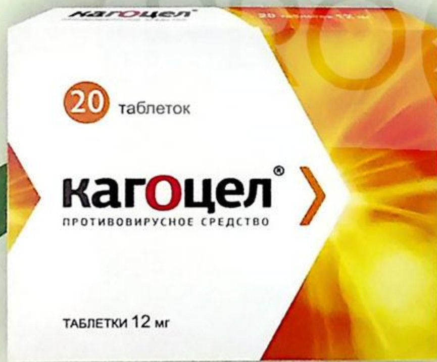
Кагоцел таб. 12 мг №20