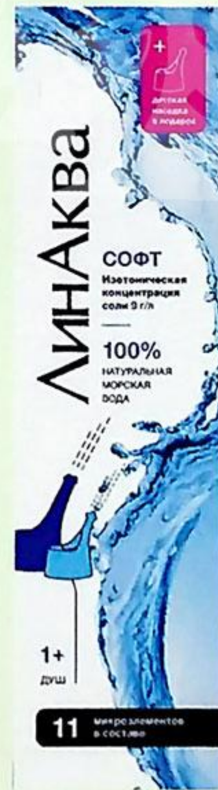
Линаква Софт аэрозоль д/промывания носа 150мл