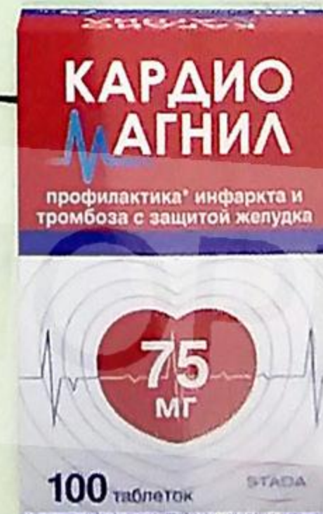
Кардиомагнил таб. п/п/о 75 мг+15.2 мг №100