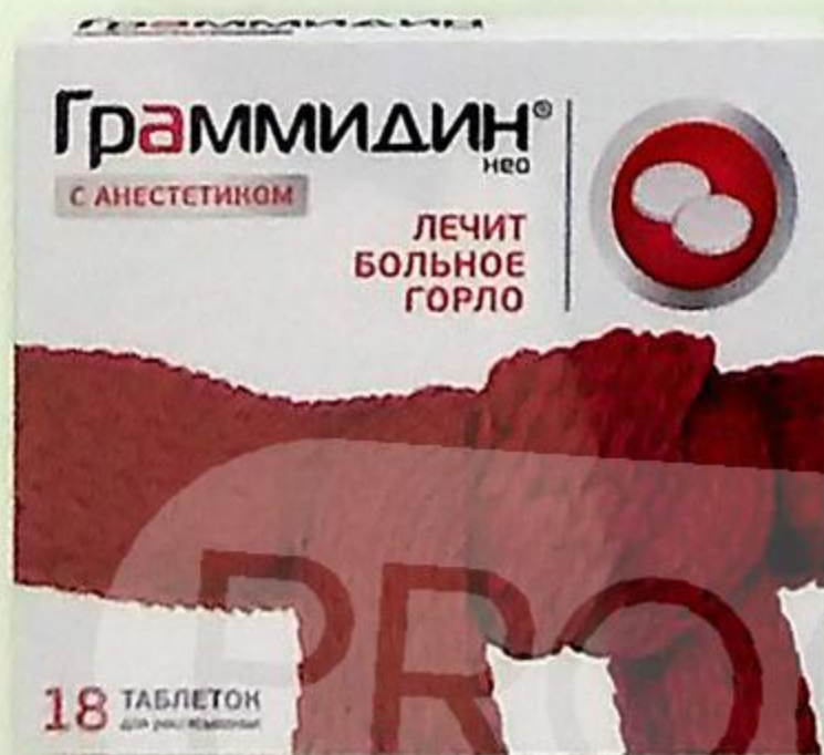
Граммидин Нео с анестетиком таб. д/рассас. №18