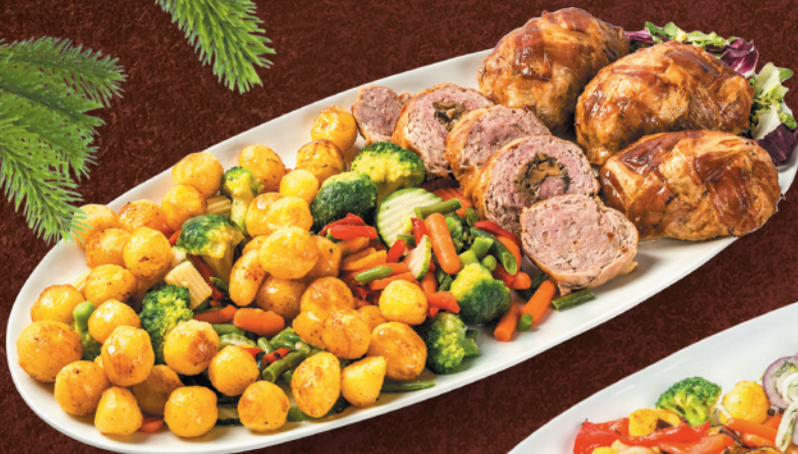
Блюдо Сплоченный коллектив, 100 г