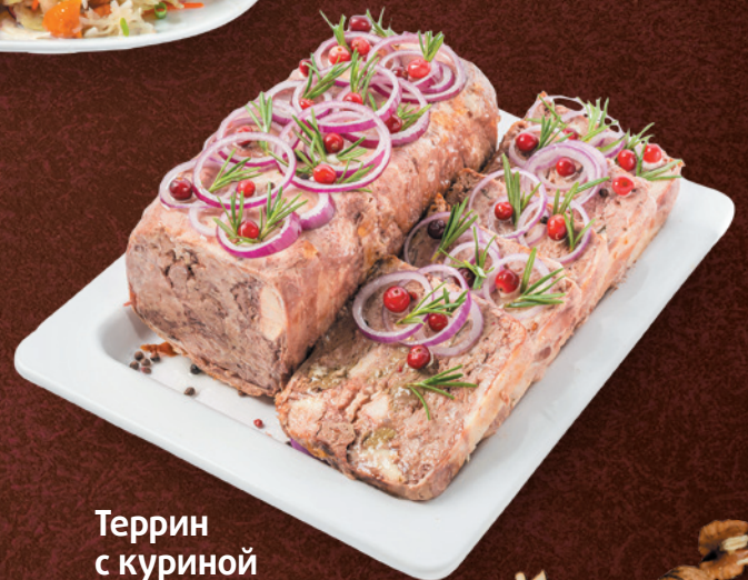
Террин с куриной печенью, 100 г