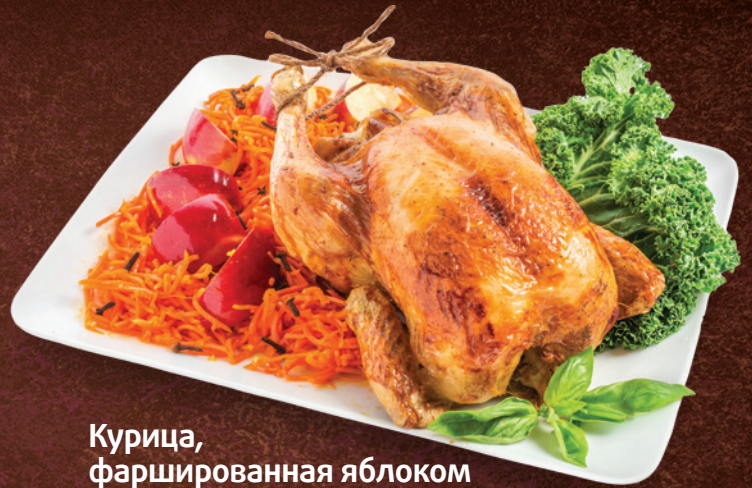
Курица, фаршированная яблоком и черносливом, 100 г