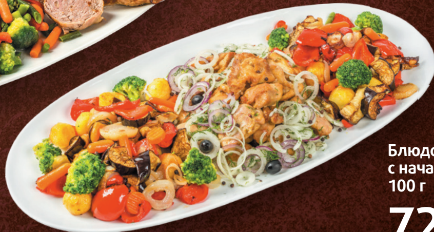
Блюдо Мы с начальником, 100 г