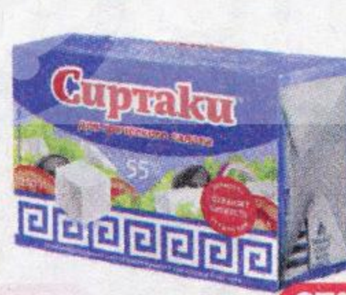
Продукт рассольный СИРТАКИ , Фета, для греческого салата, 55%, 200 г