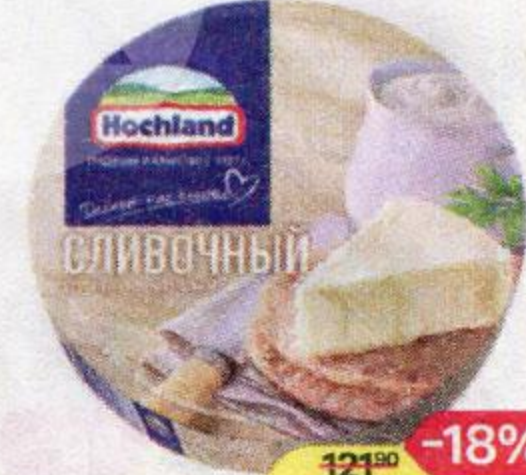
Сыр плавленный HOCHLAND сливочный, 140 г