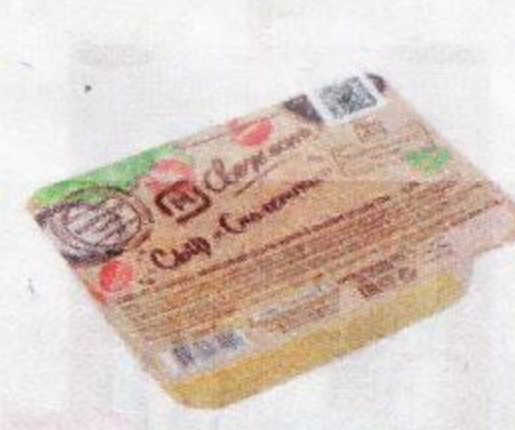
Сыр МАГНИТ СВЕЖЕСТЬ ®, Спагетти, 40%, 100 г