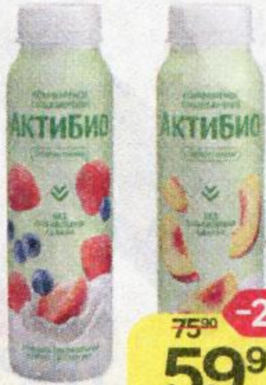
Биоюгurt питьевой АКТИБИО , без сахара: яблоко-клубника-черника/яблоко-персик/вишня-яблоко-финик, 260 г