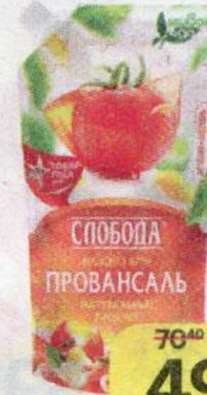
Майонез СЛОБОДА , Провансаль, 67%, 216 г