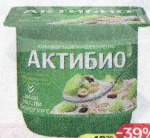
Биоюгurt АКТИБИО киви-мюсли 3%, 130 г