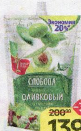
Майонез СЛОБОДА , Оливковый, 67%, 750 г