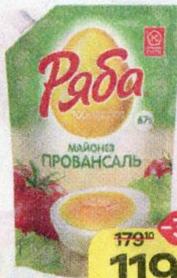
Майонез РЯБА Провансаль, 67%, 630 г