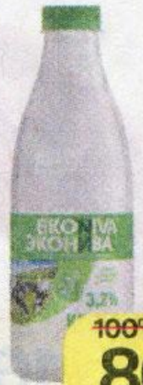
Кефир ЭКОНИВА 3,2%, 1 л