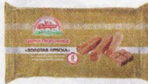
Сырki творожные СВИТЛОГОРЬЕ , золотая ириска, в карамельной глазури, 180 г