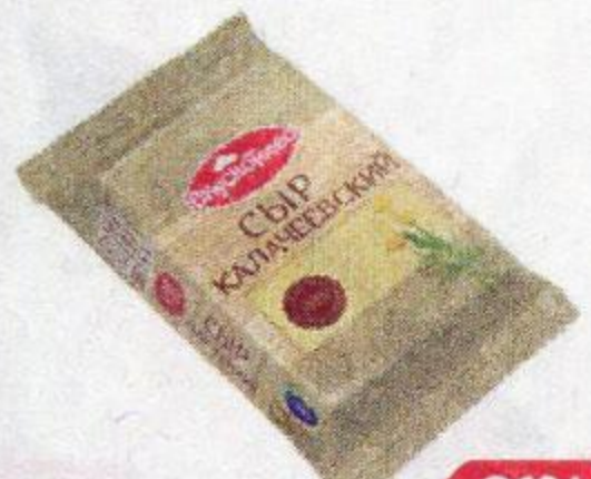
Сыр ВКУСОТЕЕВО Калачеевский, 200 г