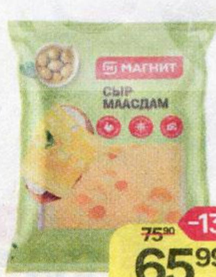
Сыр МАГНИТ ®, Маасдам, 100 г