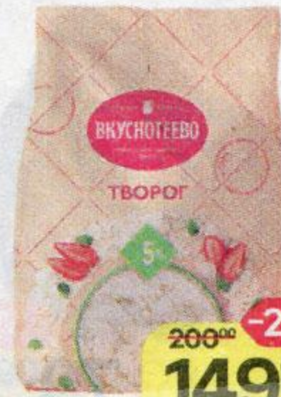
Творог ВКУСОТЕЕВО 5%, 450 г