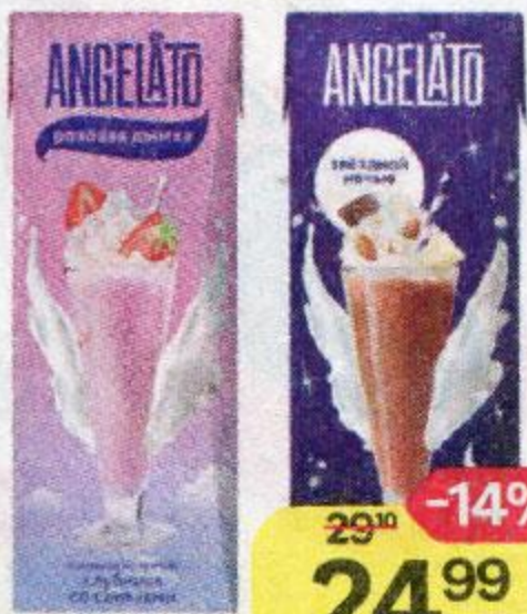
Коктейль молочный ANGELATO клубничный со сливками/шоколадный, 200 г