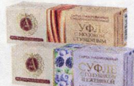
Сырок А.РОСТАГРОКОМПЛЕКС , суфле в молочном шоколаде: голубика-ежевика/сгущенное молоко, 40 г