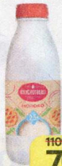
Молоко ВКУСОТЕЕВО , ультрапастеризованное, 2,5%, 900 г