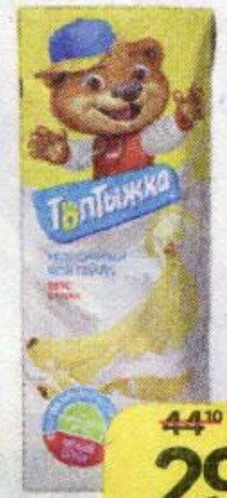
Коктейль молочный ТОПТЫЖКА , Банан, 3,2%, 200 г