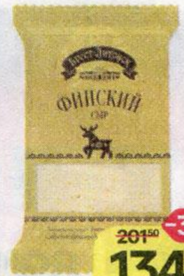
Сыр БРЕСТ-ЛИТОВСК Финский, 200 г