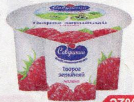
Творог САВУШКИН , зерненный Малина, 130 г