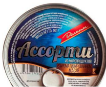
АССОРТИ КАЛЬМАР-МИДИИ 180 г, ароматизированное масло, Делатос 19.12.2023-08.01.2024