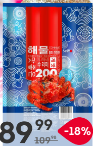
КРАБОВЫЕ ПАЛОЧКИ 200 г, з/м, SeYo 19.12.2023-08.01.2024