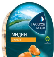
МЯСО МИДИИ В МАСЛЕ 180 г, чеснок-зелень, Русское море 19.12.2023-08.01.2024