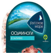
МЯСО ОСЬМИНОГА 180 г, в заливке, Русское море 19.12.2023-08.01.2024