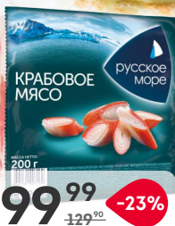
КРАБОВОЕ МЯСО 200 г, имитация, охлажденное, Русское море 19.12.2023-08.01.2024