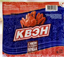
КРАБОВЫЕ ПАЛОЧКИ 500 г, с мясом краба, з/м, КВЭН 19.12.2023-08.01.2024