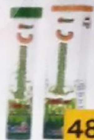
ТАБЛ. №60 AM. 01.48.01.003.R.0007709.19