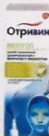
ТАБЛ. КИШЕЧНОРАСТВ. П. О. №40 РУ П. №014796/01