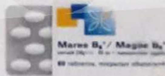
ТАБЛ П/ПЛ. ОБ. 10 МГ, №30 лп-49020205-07-164