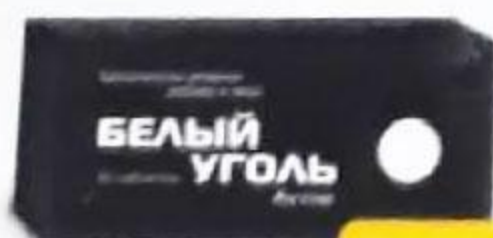
ТАБЛ. Д/Р-РА Д/МЕСТ. ПРИМ. 2% №2 П. П. ПРОСВЕТЛОВ