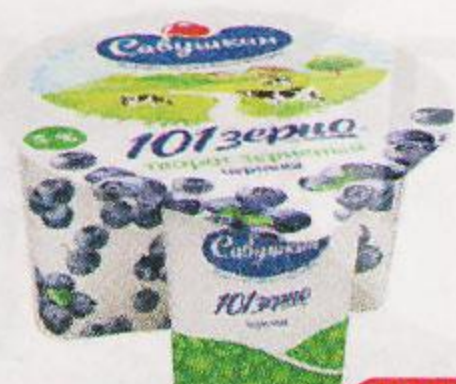
Творог зерненный САВУШКИН Черника , 130 г