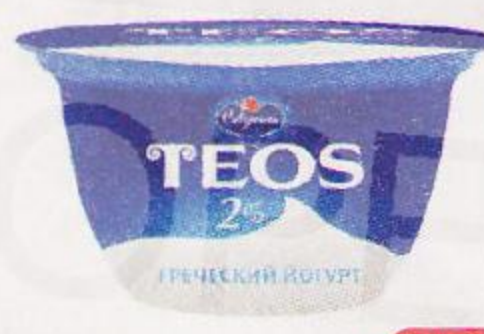
Йогурт греческий ТЕОС , 2% (Савушкин), 140 г