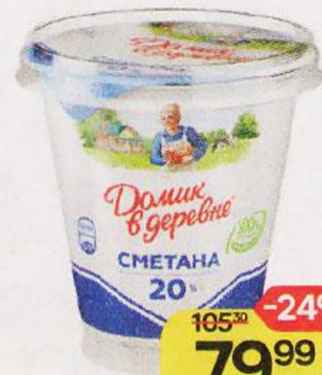
Сметана ДОМИК В ДЕРЕВНЕ 20%, 300 г