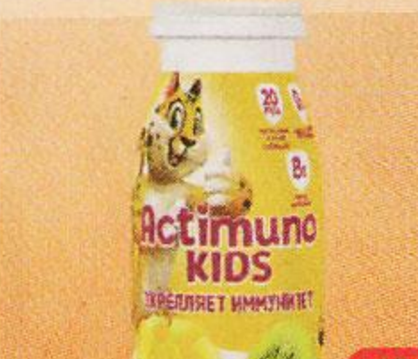
Продукт кисломолочный АКТИМУНО детский, Тропический микс 1,5%, 95 г