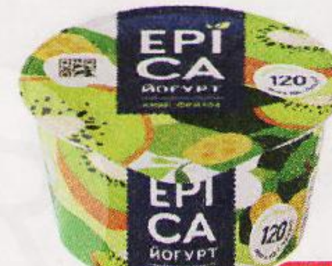
Йогурт ЕРІСА киви-фейхоа, 4,8%, 130 г