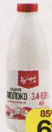
Молоко ХУТОРОК пастеризованное 3,4%-6%, 900 мл