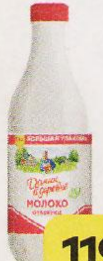
Молоко ДОМИК В ДЕРЕВНЕ , Отборное, пастеризованное, 1,4 л