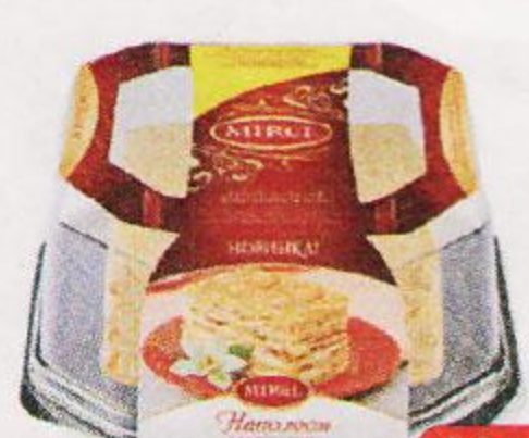
Торт MIREL , Наполеон, классический, 550 г