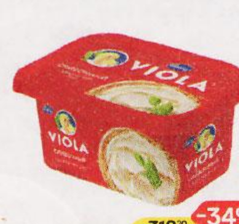
Сыр плавленый VIOLA , сливочный, 400 г