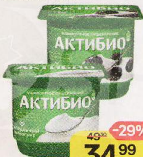
Биоюгurt АКТИБИО , с сахаром, натуральный/чернослив, 130 г