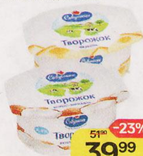
Продукт творожный САВУШКИН , Чизкейк/Кокос-миндаль, 120 г