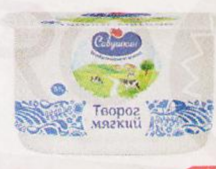
Творог САВУШКИН , мягкий, 5%, 125 г