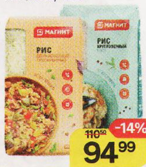
Рис МАГНИТ®, длиннозерный, пропаренный/ круглозерный, ГОСТ, 800г/ 900г