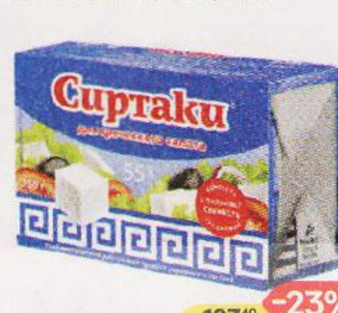
Продукт рассольный СИРТАКИ , Фета, для греческого салата, 55%, 200 г