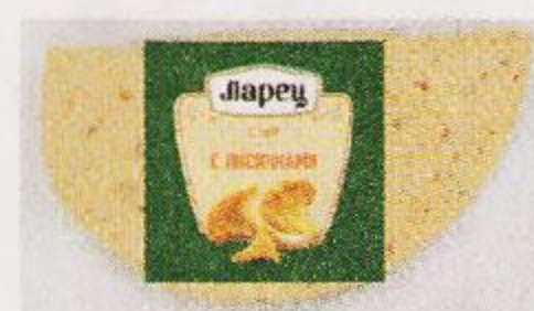
Сыр ЛАРЕЦ с лисичками, 245 г