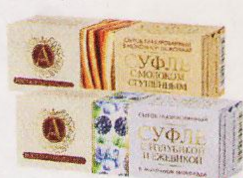
Сырок А.РОСТАГРОКОМПЛЕКС , суфле в молочном шоколаде: голубика-ежевика/сгущенное молоко, 40 г