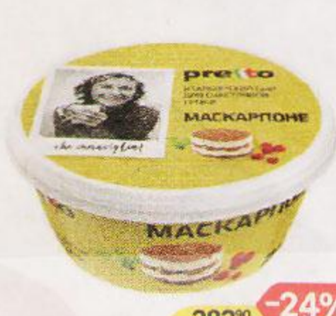
Сыр PRETTO , Маскарпоне, мягкий, 250 г