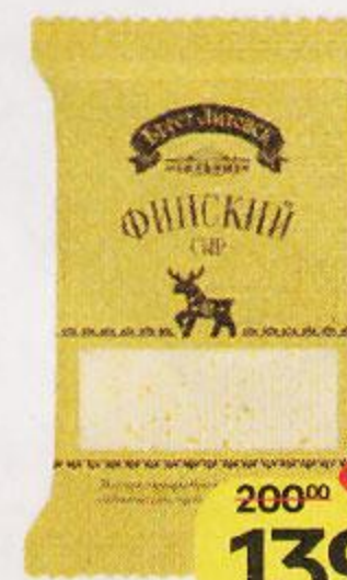
Сыр БРЕСТ-ЛИТОВСК Финский, 200 г