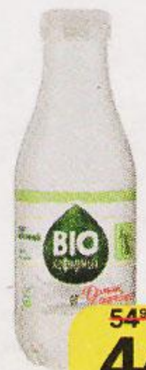
Продукт БИО КЕФИРНЫЙ от Домик в деревне, 1%, 450 г