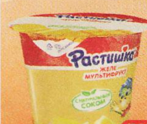
Желе РАСТИШКА мультифрукт ананас-манго, 100 г