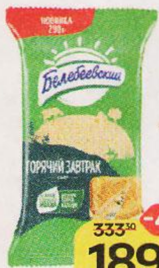
Сыр БЕЛЕБЕВСКИЙ Горячий завтрак 52%, 290 г