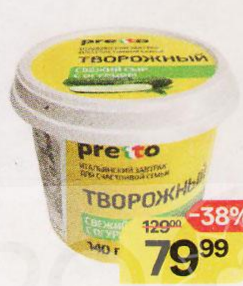
Сыр творожный PRETTO с огурцом, 65%, 140 г