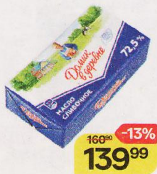
Масло сливочное ДОМИК В ДЕРЕВНЕ , 72,5%, 180 г