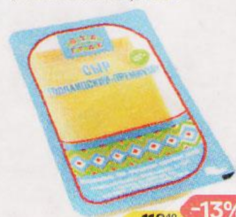
Сыр ГОЛЛАНДСКИЙ премиум, нарезка, 45% (Поставский М3), 150 г