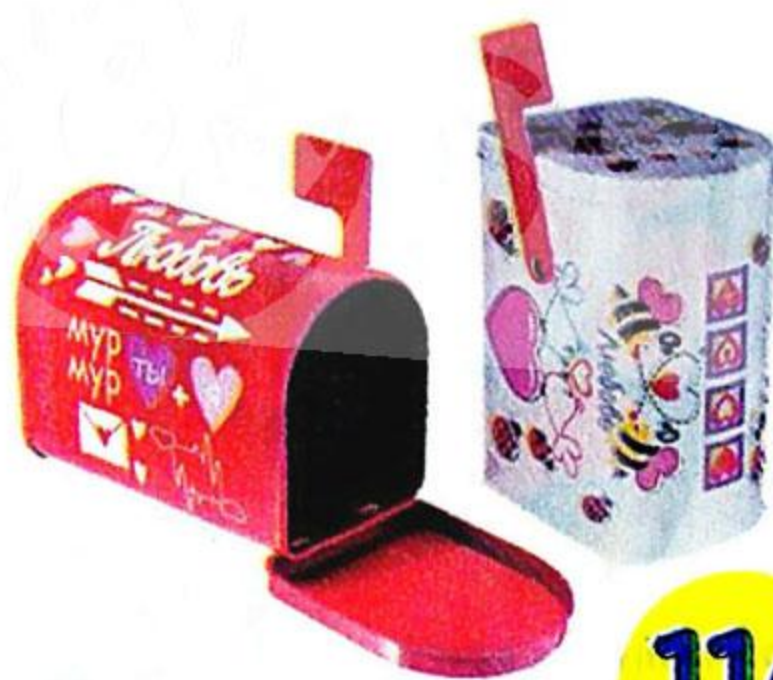
Коробка подарочная «Почтовый ящик»