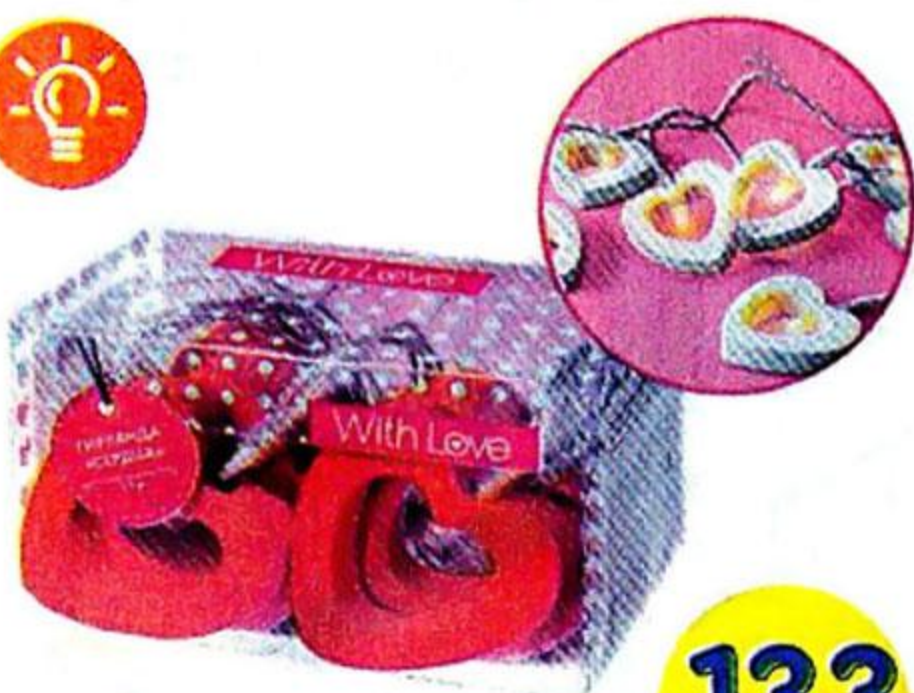
Гирлянда «Сердца», 1,5 м Батарейки 2 x AA не в комплекте