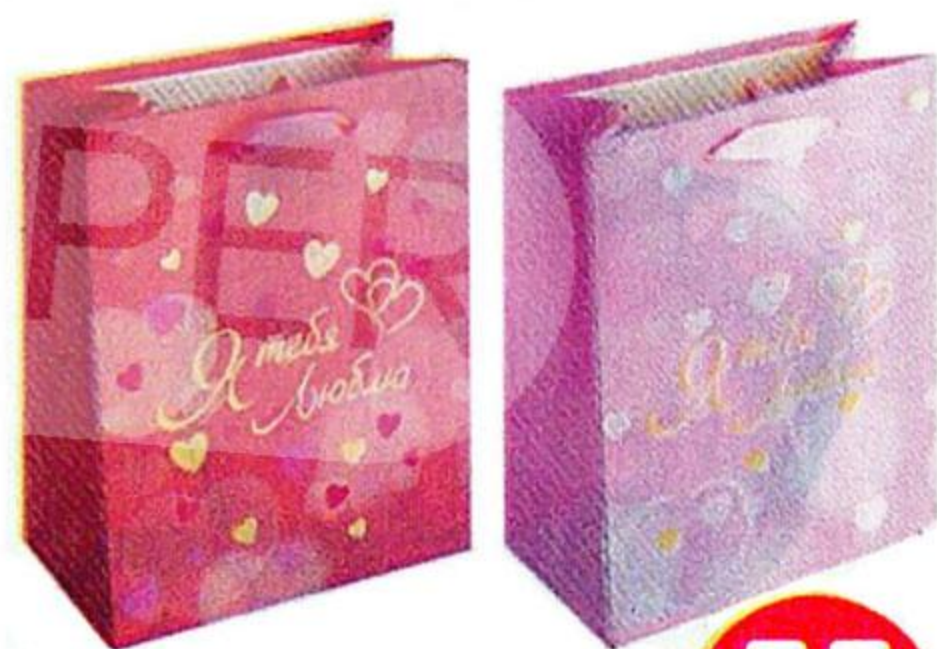
Пакет подарочный, 23 x 18 x 10 см