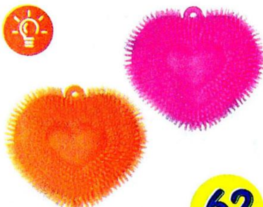
Игрушка «Светящееся сердце» Батарейки 3 x AG3 в комплекте