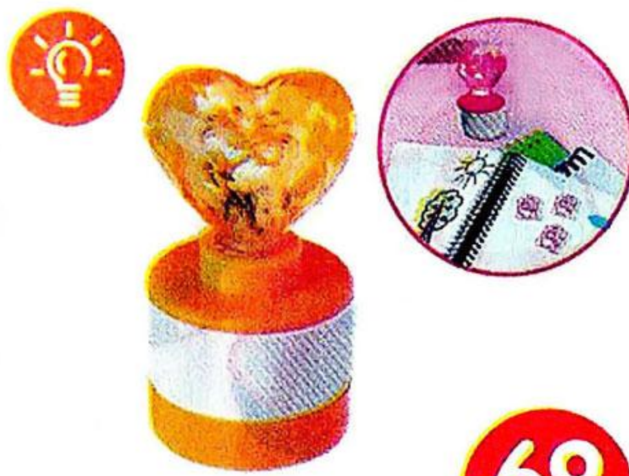
Игрушка-штампик «Люблю» светящаяся Батарейки 2 x LR41 в комплекте