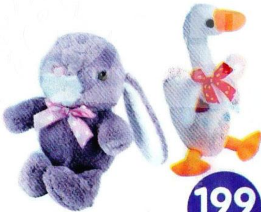
Игрушка мягконабивная «Люблю»