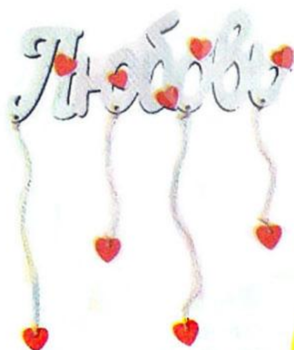
Декорация «Люблю» Прищепки декоративные 16 шт. в комплекте