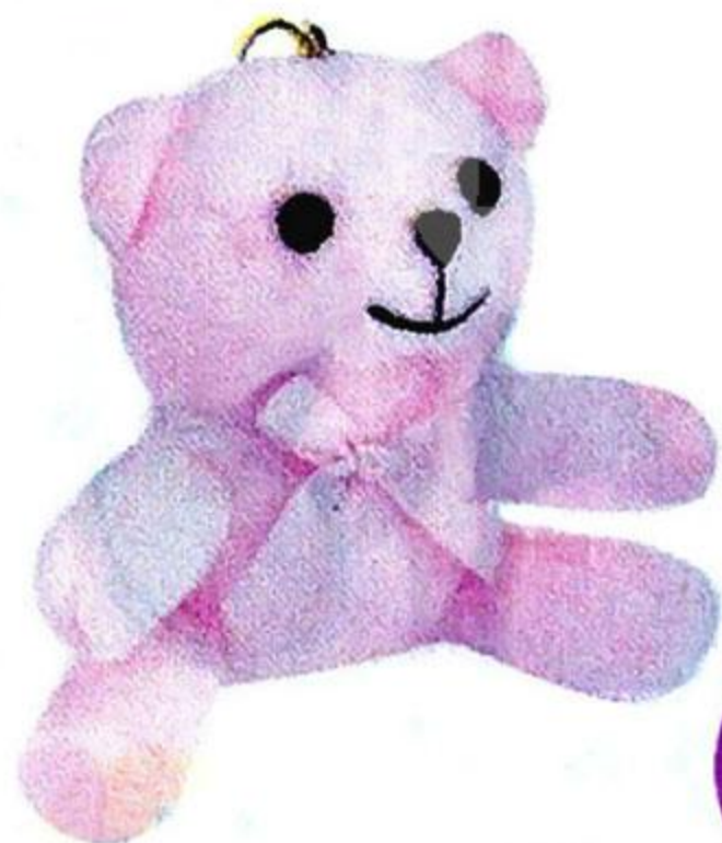
Игрушка «Мишка», 11 см