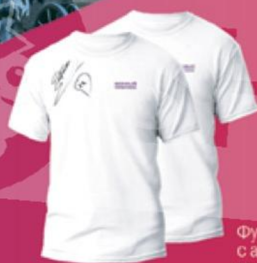
Футболки с автографами звезд