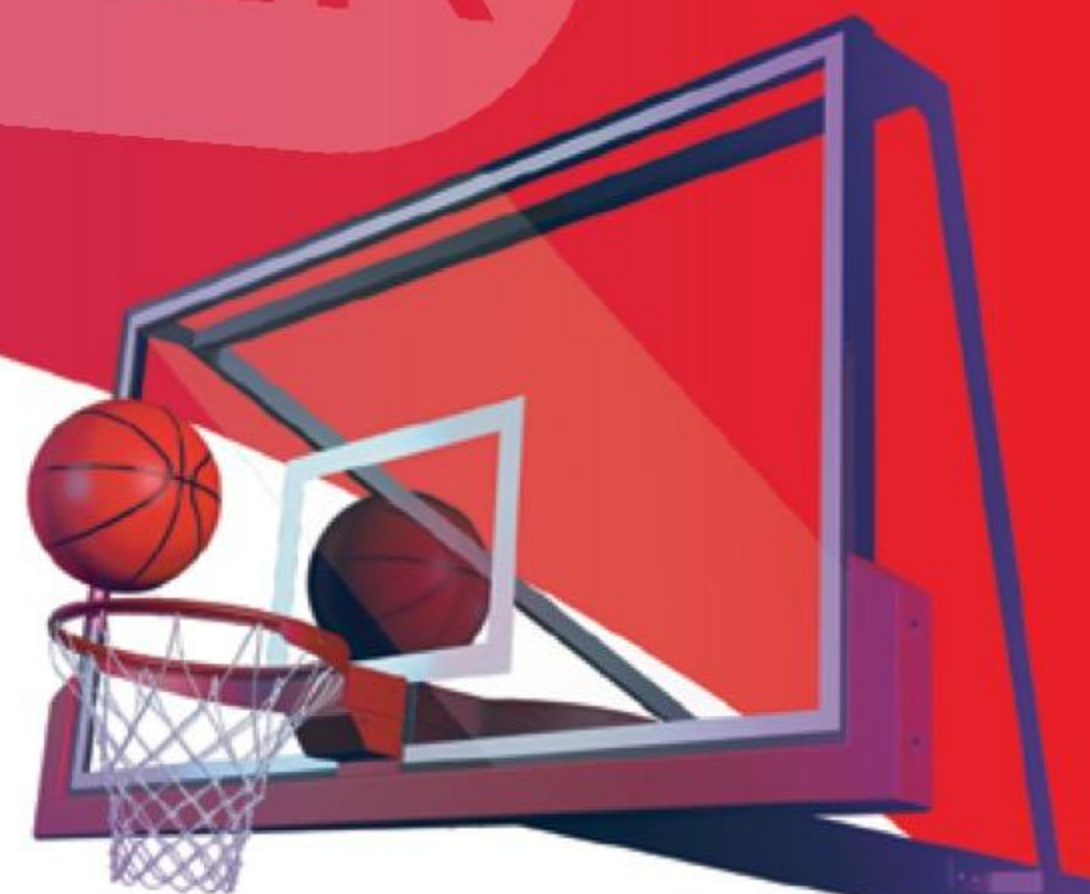
2 гранта по 1 000 000 рублей на спортивные площадки для школ****