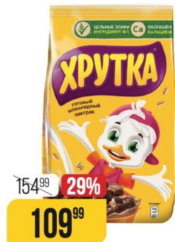
ГОТОВЫЙ ЗАВТРАК ХРУТКА шарики шоколадные, 230 г 170802