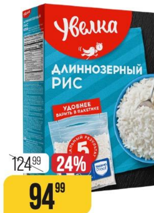
РИС ДЛИННОЗЕРНЫЙ шлифованный, Увелка, 5 пак. x 80 г 123542