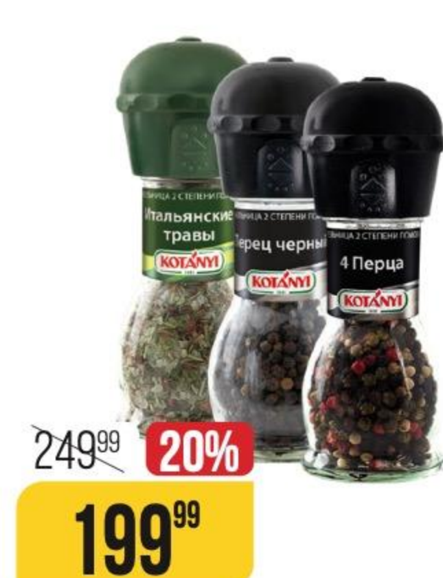
ПРИПРАВА КОТАНЫ в ассортименте, 35-48 г 108342/108340/108339