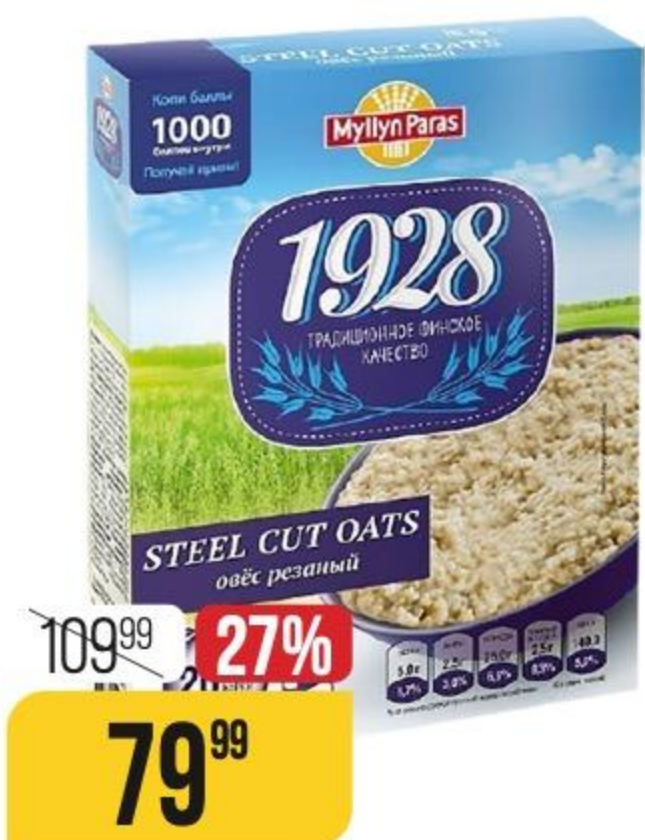
ОВЕС РЕЗАНЫЙ Myllyn Paras, 500 г 157983