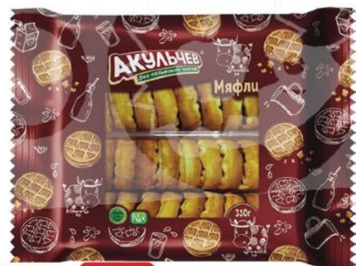
ВАФЛИ МЯГКИЕ МЯФЛИ Акульчев, 310 г 146480