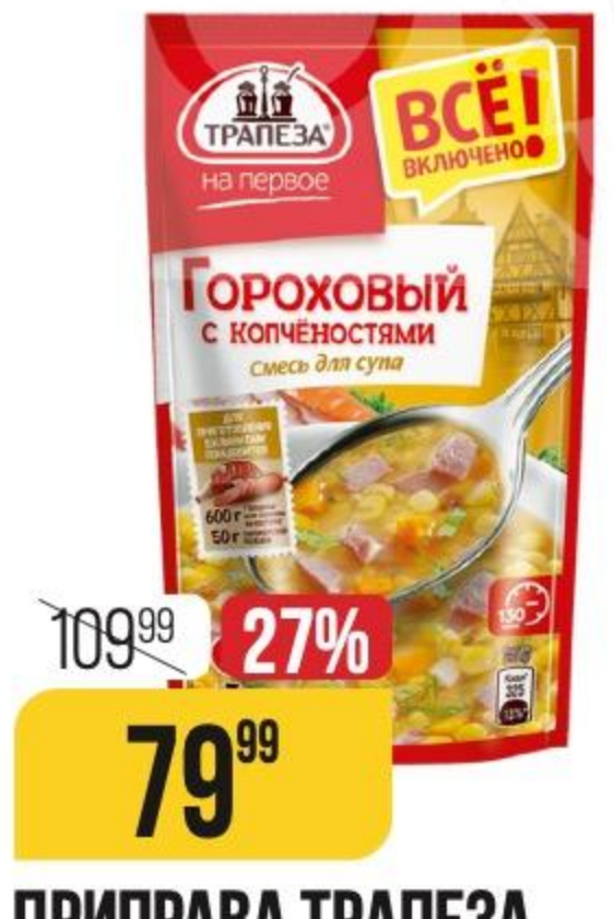
ПРИПРАВА ТРАПЕЗА для горохового супа с копченостями, 130 г 162591