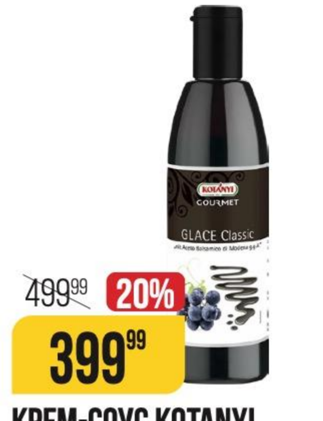
КРЕМ-СОУС КОТАНЫ бальзамический, классический, 250 мл 151133