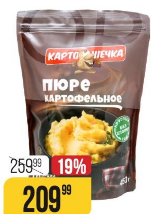
ПЮРЕ КАРТОФЕЛЬНОЕ КАРТОШЕЧКА 450 г 169108