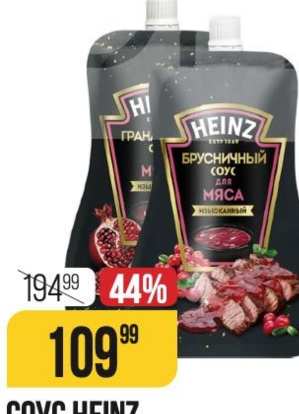
СОУС HEINZ для мяса, в ассортименте, 200 г 177514/181323