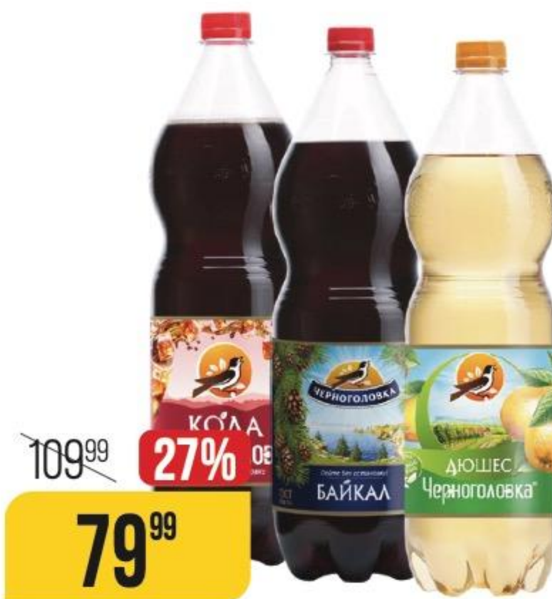
ЛИМОНАД КОЛА; БАЙКАЛ; ДЮШЕС Черноголовка, 1,5 л 183487/183484/153282