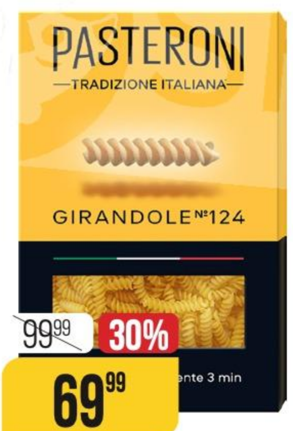
МАКАРОНЫ PASTERONI girandole №124, 400 г 183451