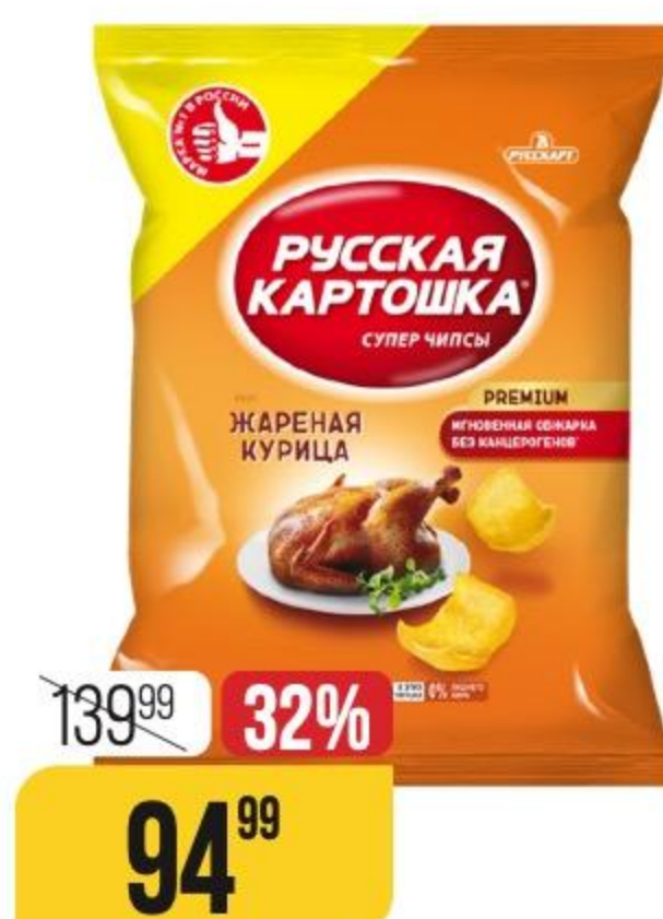
ЧИПСЫ РУССКАЯ КАРТОШКА в ассортименте, 140 г 171551