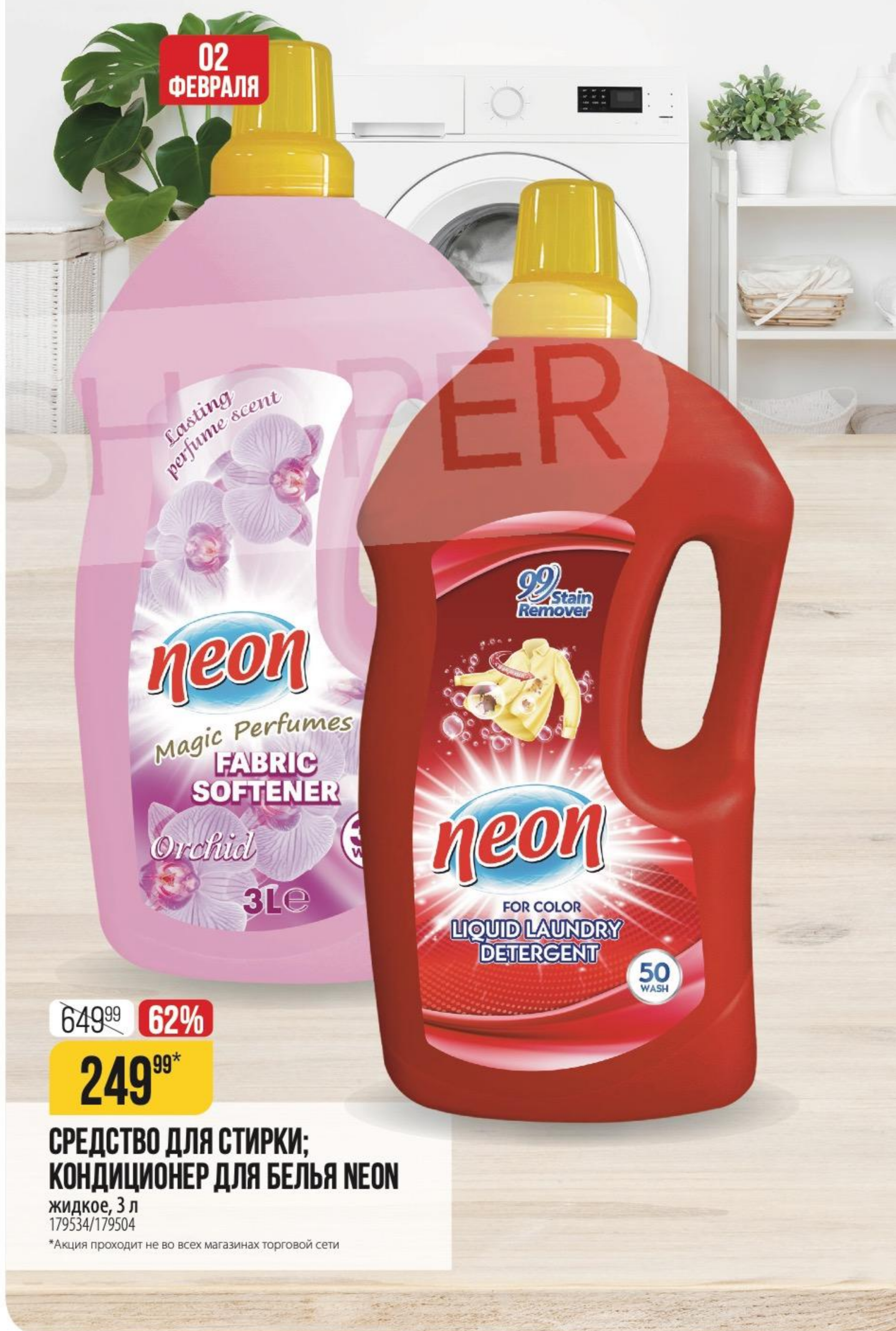
02 ФЕВРАЛЯ СРЕДСТВО ДЛЯ СТИРКИ; КОНДИЦИОНЕР ДЛЯ БЕЛЬЯ NEON жидкое, 3 л 179534/179504 *Акция проходит не во всех магазинах торговой сети