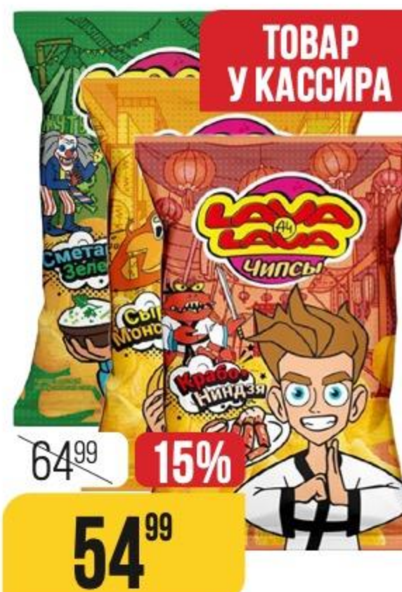
ЧИПСЫ LAVA LAVA A4 в ассортименте, 50 г 170848/172085/170846