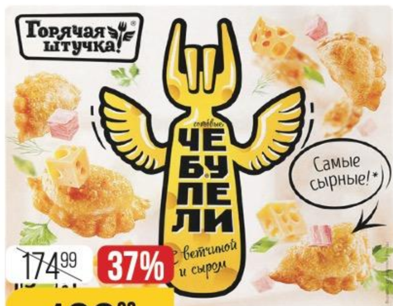
ЧЕБУПЕЛИ сыр-ветчина, Горячая Штучка, 300 г 131173