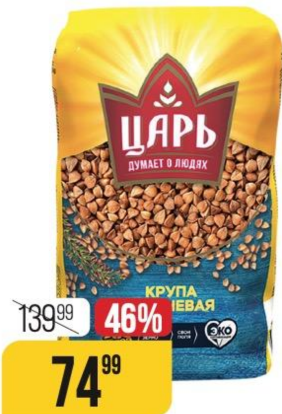
КРУПА ГРЕЧНЕВАЯ ЦАРЬ ядрица, 800 г 179014