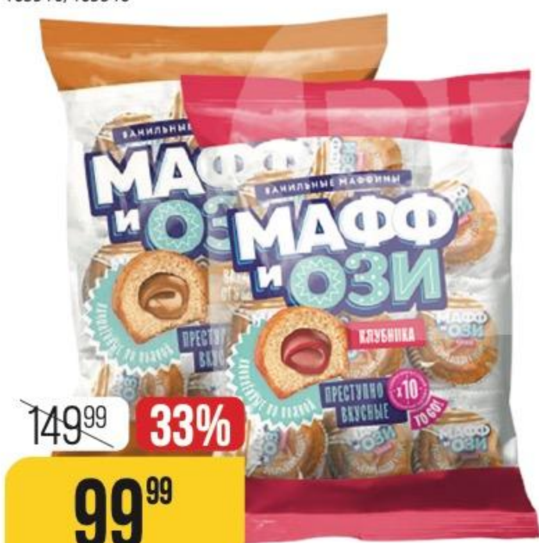
МАФФИНЫ МАФФ И ОЗИ ванильные, в ассортименте, 450 г 176944/177031