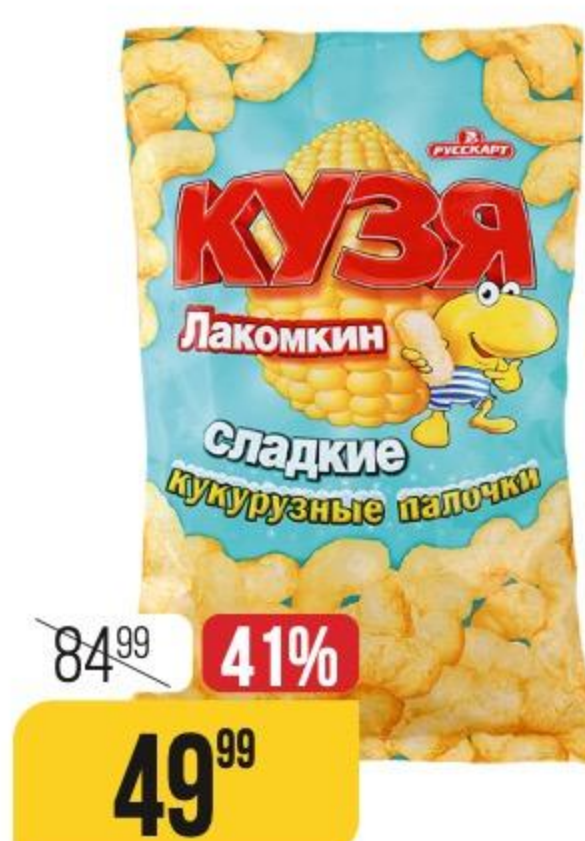
ПАЛОЧКИ КУКУРУЗНЫЕ КУЗЯ ЛАКОМКИН сладкие, 140 г 105290