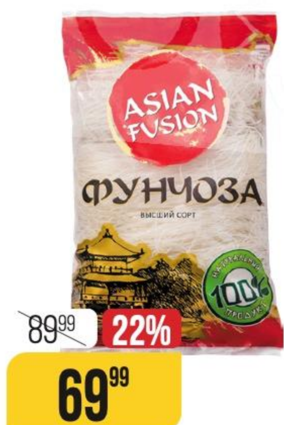
ВЕРМИШЕЛЬ ФУНЧОЗА Asian Fusion, 100 г 182281