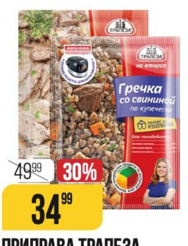
ПРИПРАВА ТРАПЕЗА на второе, в ассортименте, 22-24 г 155817/132776