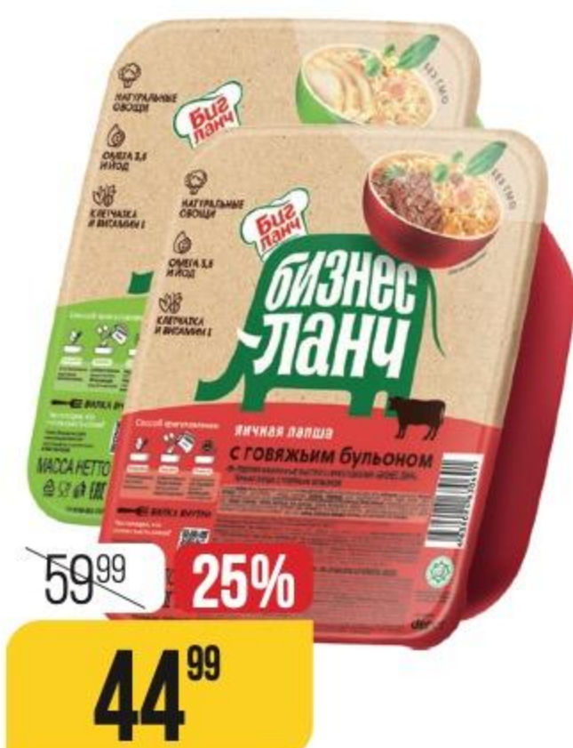
ЛАПША БИЗНЕС ЛАНЧ яичная, в ассортименте, 90 г 179264/179262