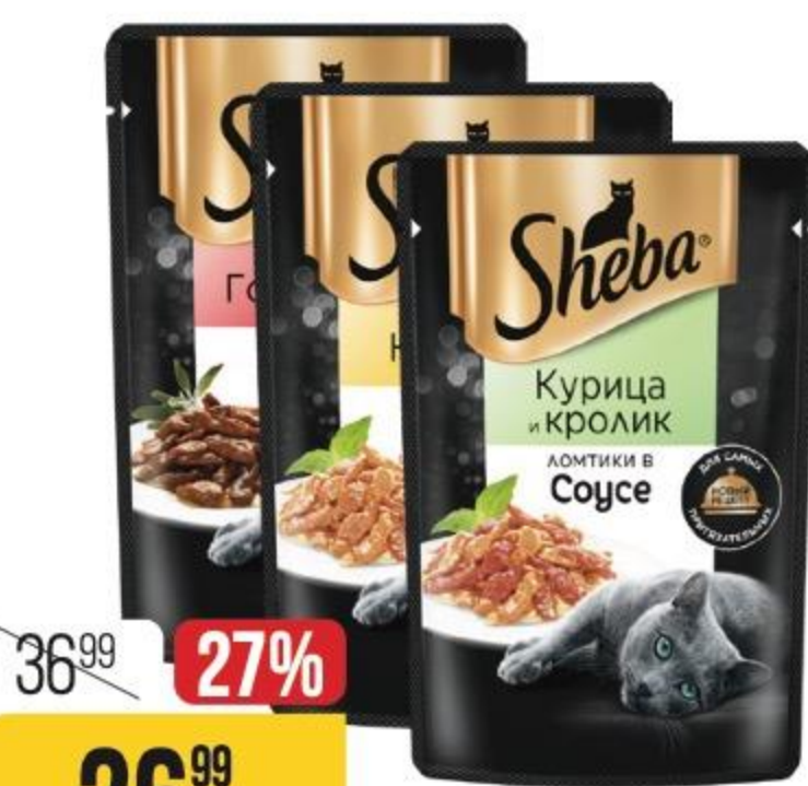
КОРМ ДЛЯ КОШЕК SHEBA в ассортименте, 75 г 175660/166703/166705/164220/175656