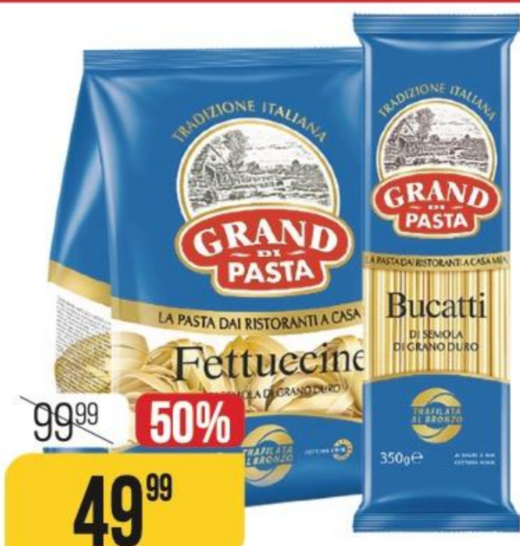
МАКАРОНЫ GRAND DI PASTA в ассортименте, 250-350 г 183516/183518