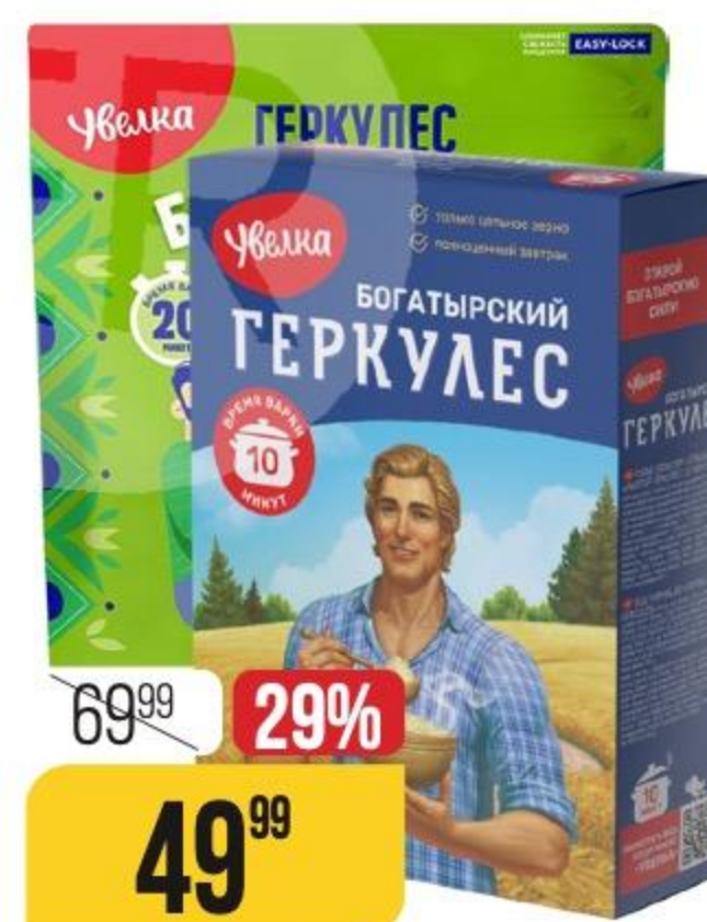
ХЛОПЬЯ ОВСЯНЫЕ ГЕРКУЛЕС БОГАТЫРСКИЙ 10; 20 минут, Увелка, 500 г 177298/177300