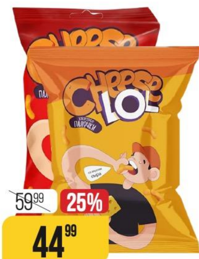
ПАЛОЧКИ КУКУРУЗНЫЕ CHEESE LOL в ассортименте, 60 г 182233