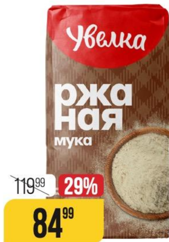
МУКА РЖАНАЯ хлебопекарная, обдирная, Увелка, 1,9 кг 150067