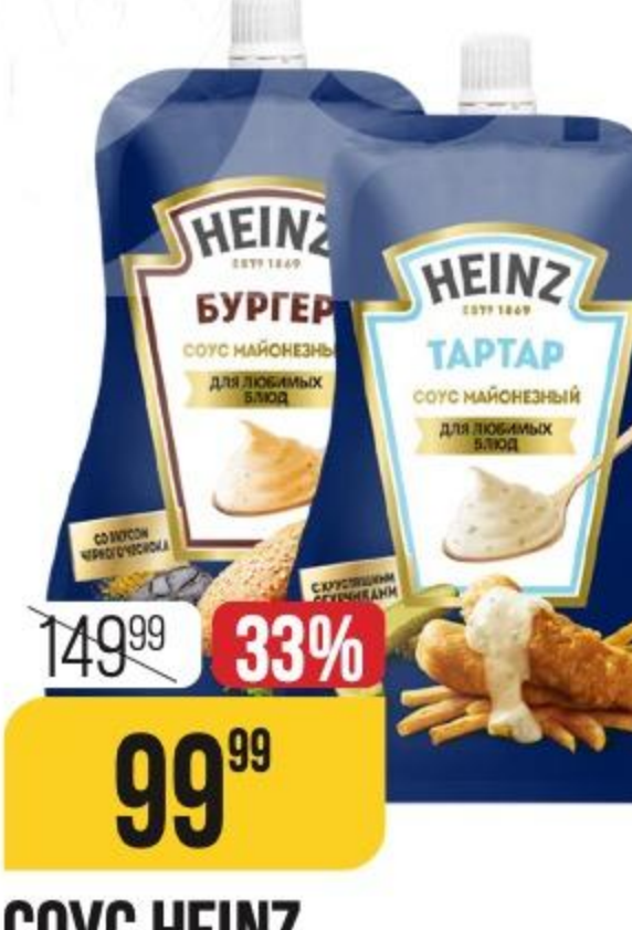
СОУС HEINZ майонезный, в ассортименте, 200 г 177545/177543