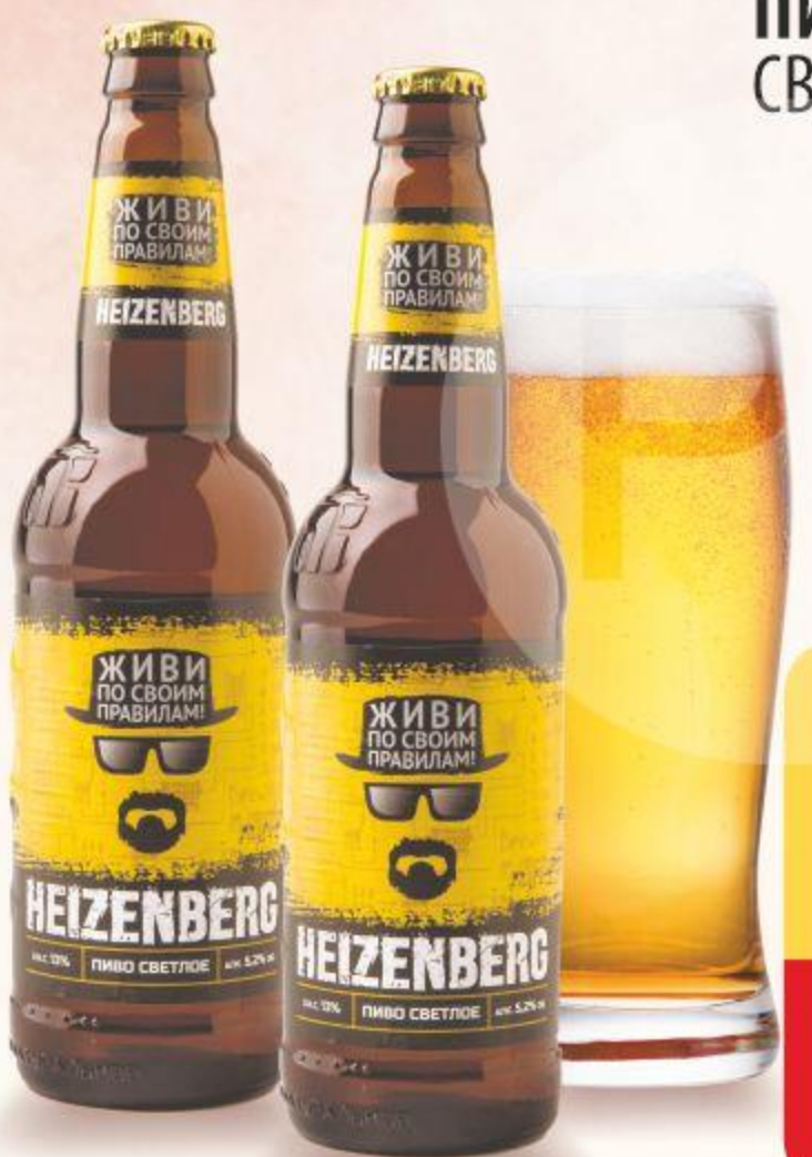
ПИВО ХАЙЗЕНБЕРГ, СВЕТЛОЕ, 0,5 Л