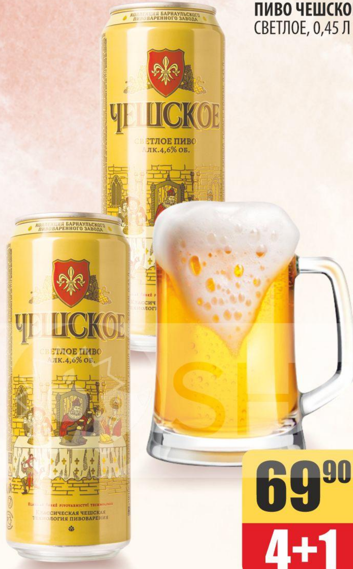
ПИВО ЧЕШСКОЕ, СВЕТЛОЕ, 0,45 Л