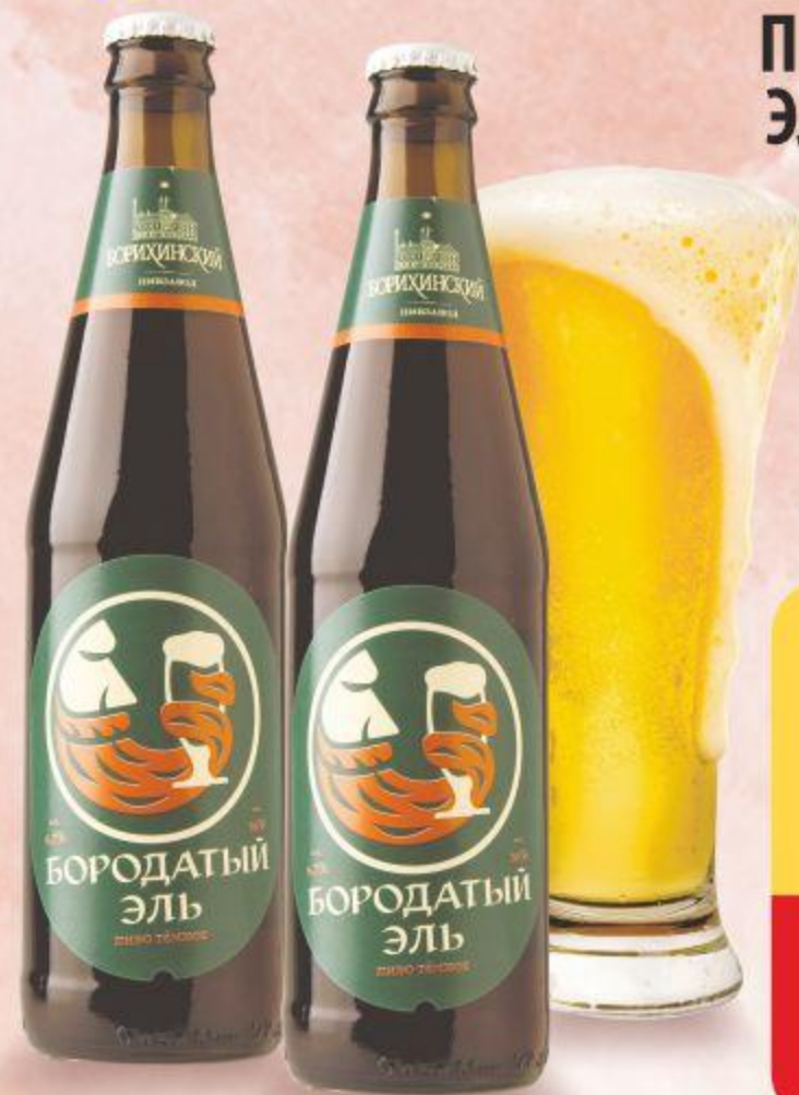
ПИВО БОРОДАТЫЙ ЭЛЬ, ТЁМНОЕ, 0,5 Л