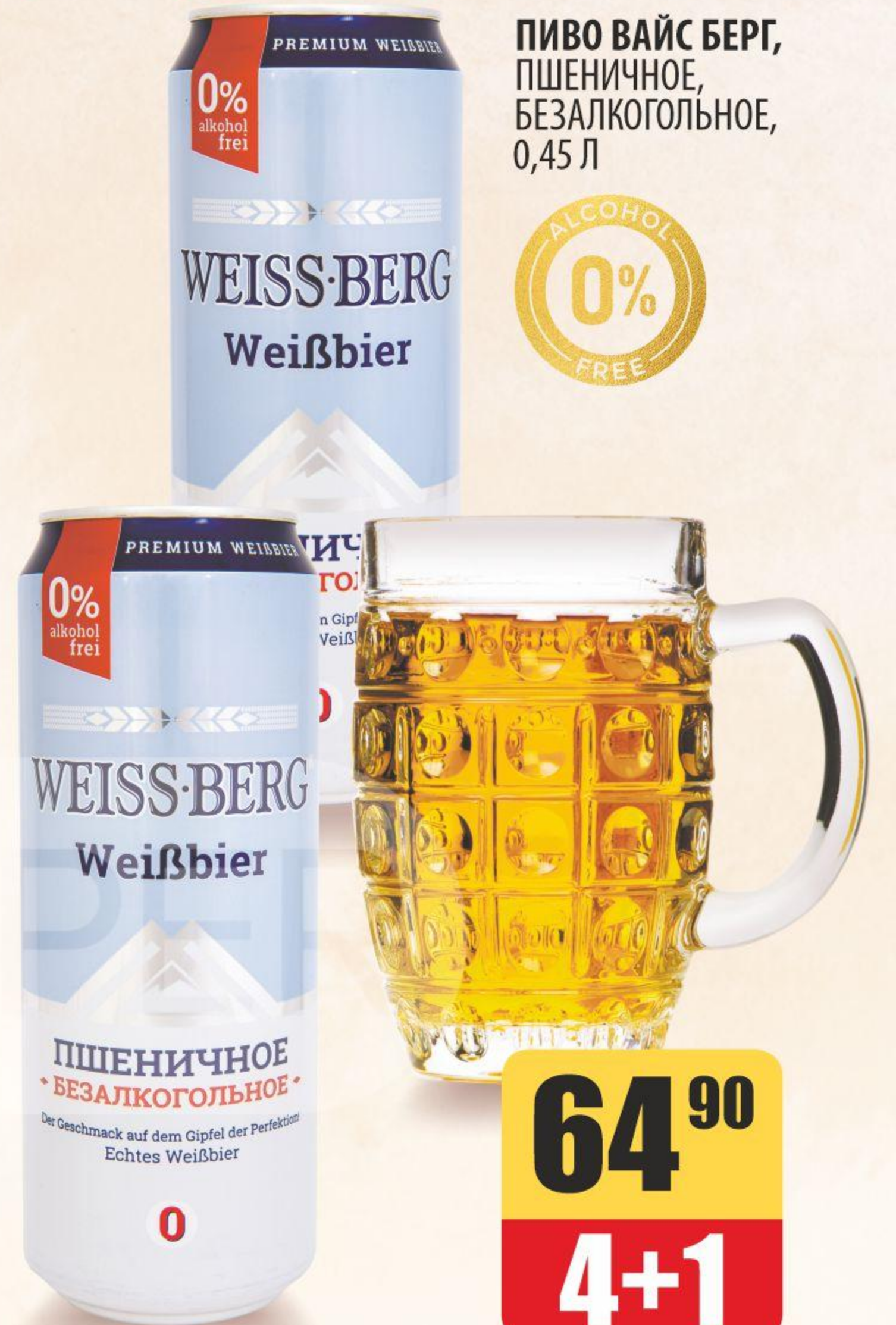
ПИВО ВАЙС БЕРГ, ПШЕНИЧНОЕ, БЕЗАЛКОГОЛЬНОЕ, 0,45 Л