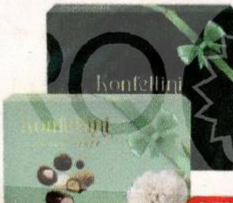
Набор конфет KONFELLINI , глазированные с начинкой, 255 г