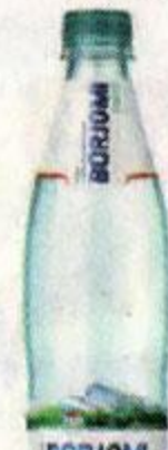
Вода минеральная BORJOMI , 500 мл