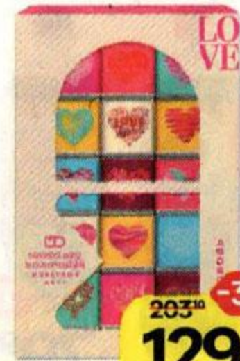
Шоколадный набор МОНЕТНЫЙ ДВОР молочный, Это любовь, 75 г