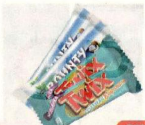
Конфеты BOUNTY/ TWIX , соленая карамель, 100 г