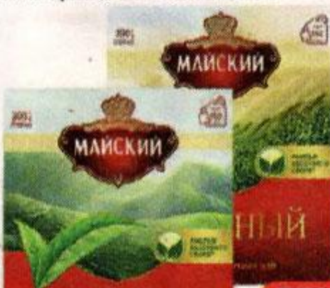
Чай МАЙСКИЙ , Черный: Отборный/ Корона Российской Империи, 100 пакетиков