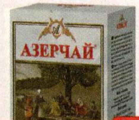
Чай черный АЗЕРЧАЙ крупнолистовой, 100 г