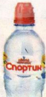
Вода питьевая СВЯТОЙ ИСТОЧНИК , Спортик, негазированная, 330 мл