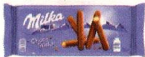
Печенье-палочки MILKA Lila Sticks, в молочном шоколаде, 112 г