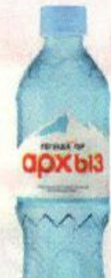
Вода негазированная ЛЕГЕНДА ГОР АРХЫЗ , 500 мл