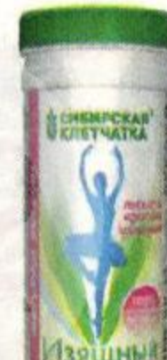
Клетчатка СИБИРСКАЯ КЛЕТЧАТКА , Изящный силуэт, 170 г