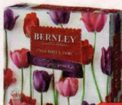
Чай черный BERNLEY , Инглиш классический, 100 пакетиков