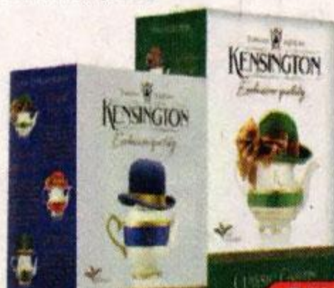
Чай KENSINGTON ® крупнолистовой Классик: черный/зеленый, 90 г