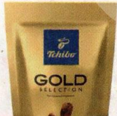
Кофе TCHIBO , Голд Селекшн, сублимированный, 75 г