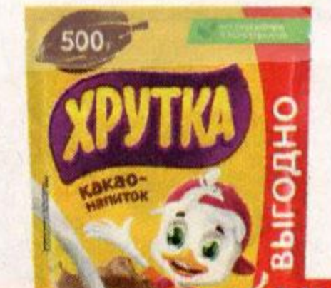
Какао-напиток ХРУТКА , 500 г