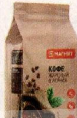
Кофе МАГНИТ ®, Натуральный, в зернах, 1 кг