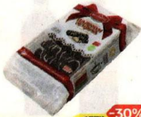
Печенье ПАЛЬЧИКИ ОБЛИЖЕШЬ , В темной глазури (Белогорье), 265 г