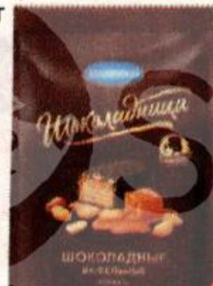
Конфеты ШОКОЛАДНИЦА шоколадные, вафельные, арахис-карамель (Коломенский), 160 г