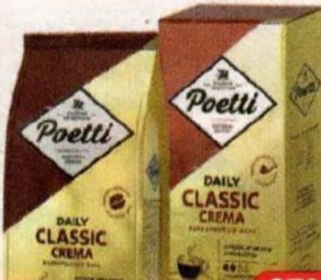
Кофе POETTI Daily Classic Crema: в зернах/ молотый, 250 г