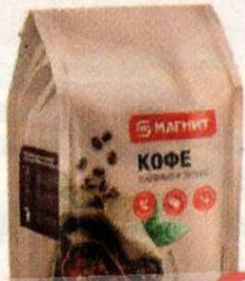
Кофе МАГНИТ ®, зерна, натуральный, 200 г