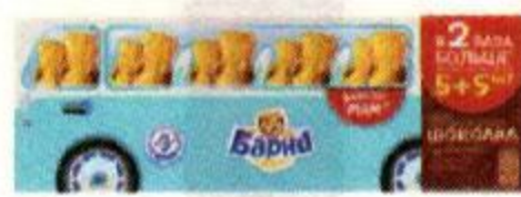
Пирожное БАРНИ , бисквитное с шоколадной начинкой, 300 г