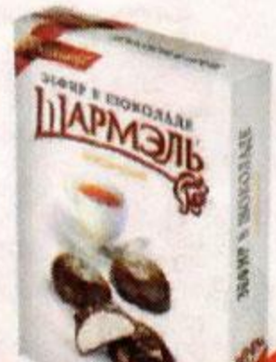
Зефир ШАРМЭЛЬ , классический, в шоколаде, 250 г