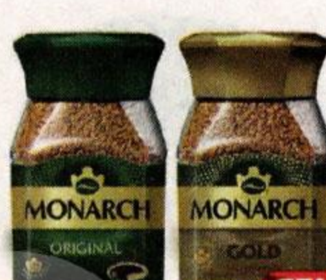
Кофе MONARCH , растворимый: Голд/ Ориджинал, 95 г