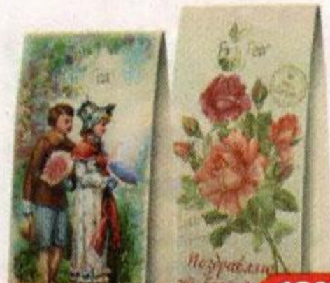
Чай FRUTEA чёрный листовый, подарочный, Весна микс, 50 г