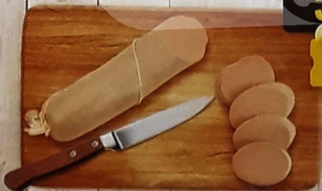
КОЛБАСА «ЯИЧНАЯ» ливерная