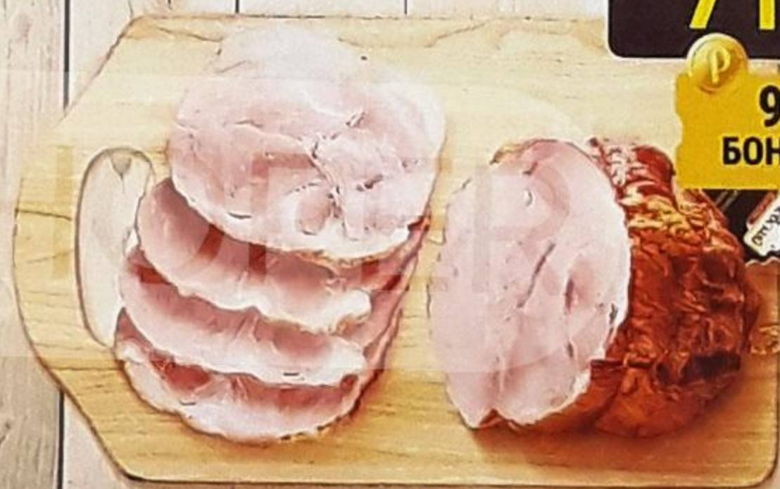
БАРИНОК «БОРОВИЦКИЙ» варёно-копчёный