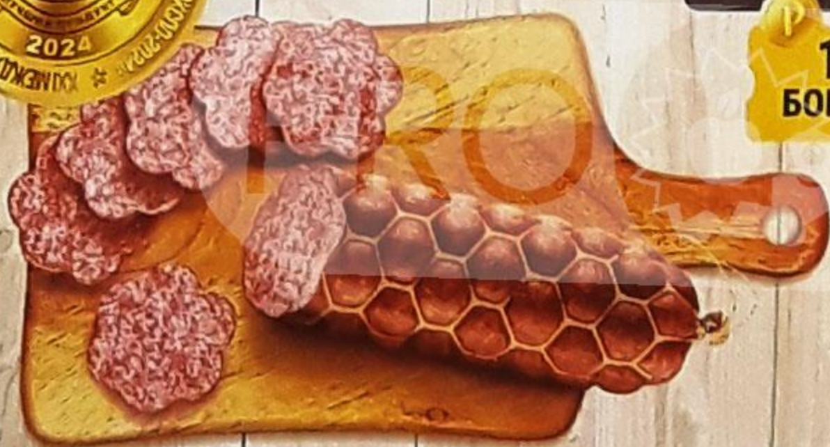
СЕРВЕЛАТ «РУБЛЁВСКИЙ ГУРМАН» варёно-копчёный