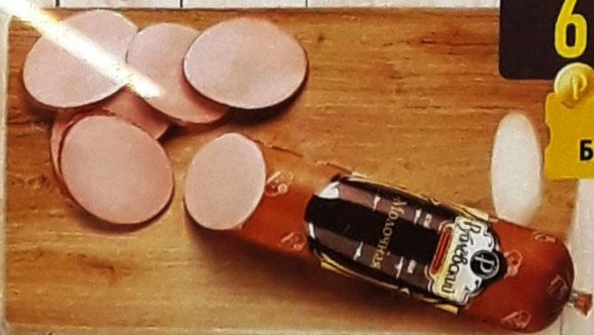
КОЛБАСА «МОЛОЧНАЯ» варёная, в белкозине