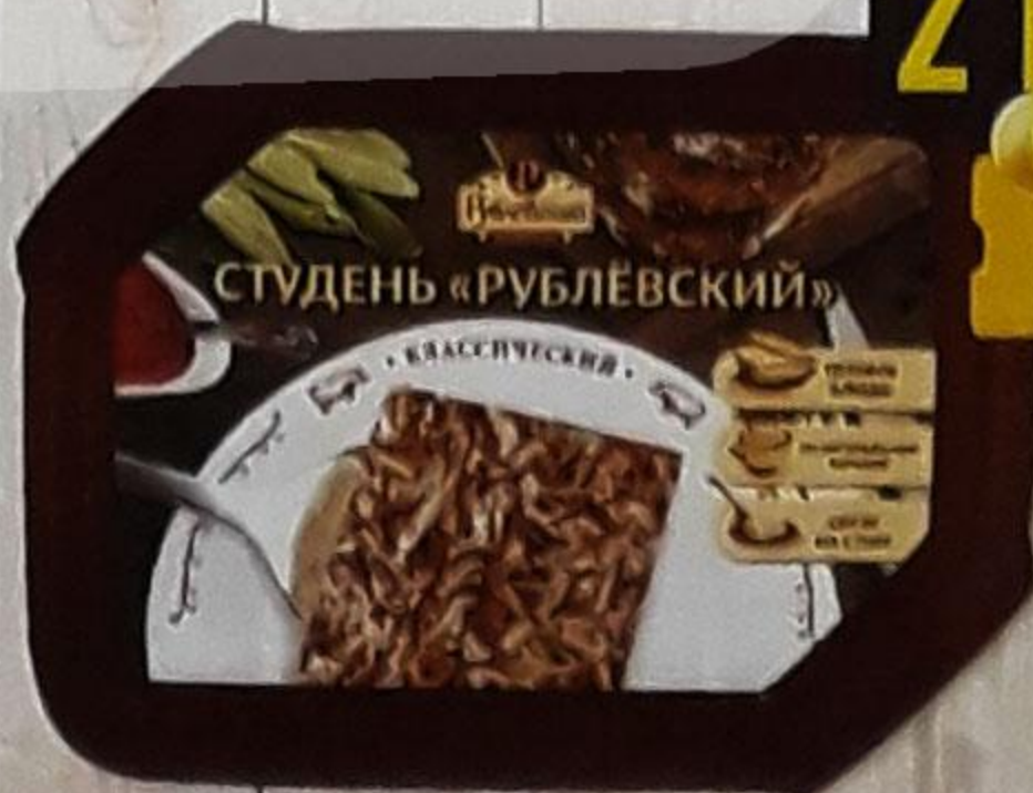
СТУДЕНЬ «РУБЛЁВСКИЙ» классический