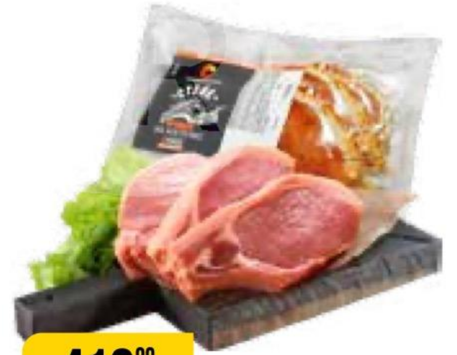
СТЕЙК ИЗ ГРУДКИ ИНДЕЙКИ охлажденный, ИндиЛайт, 525 г 132395