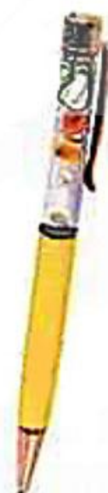
РУЧКА В ПОДАРОЧНОЙ УПАКОВКЕ