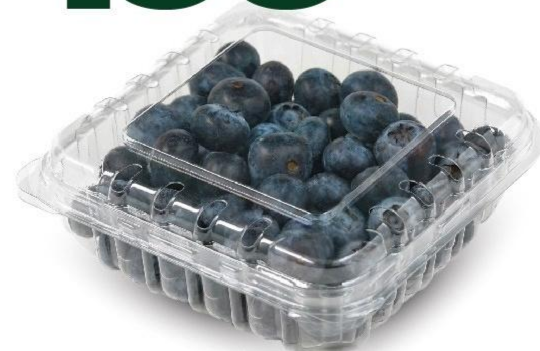
ГОЛУБИКА , 125 Г