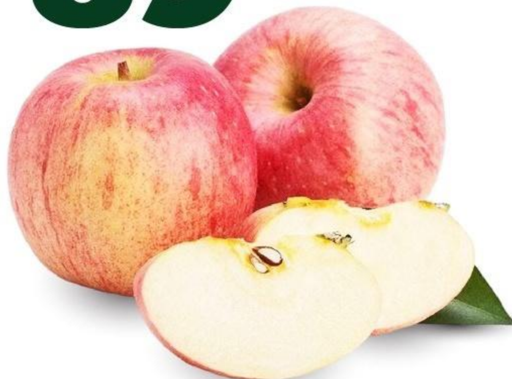
ЯБЛОКИ «ФУДЖИ», 1 КГ