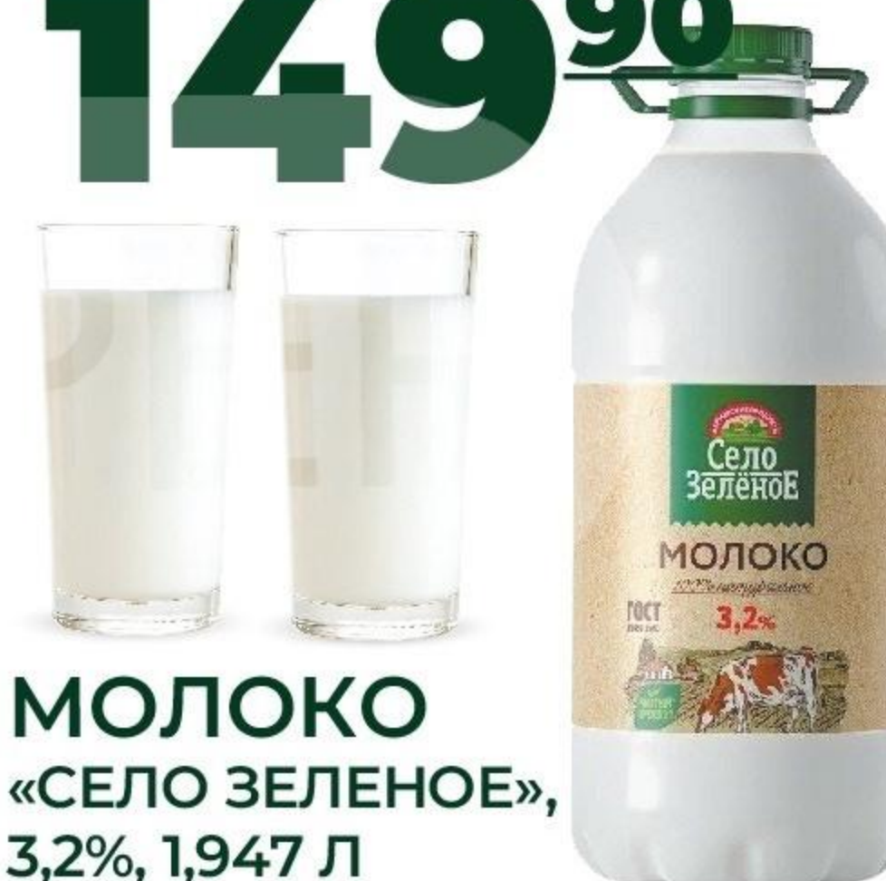
МОЛОКО «СЕЛО ЗЕЛЕНОЕ», 3,2%, 1,947 Л