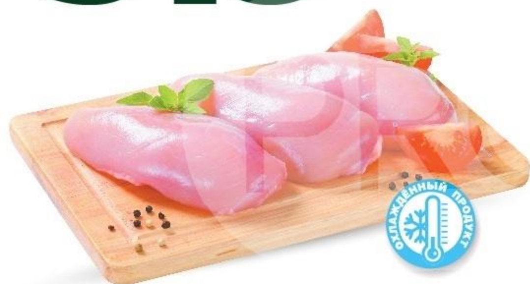
ФИЛЕ КУРИНОЕ, ОХЛ., 1 КГ