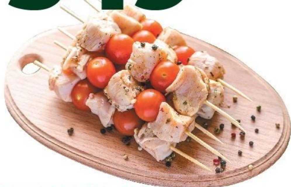
ШАШЛЫК ИЗ ИНДЕЙКИ, П/, 1 КГ