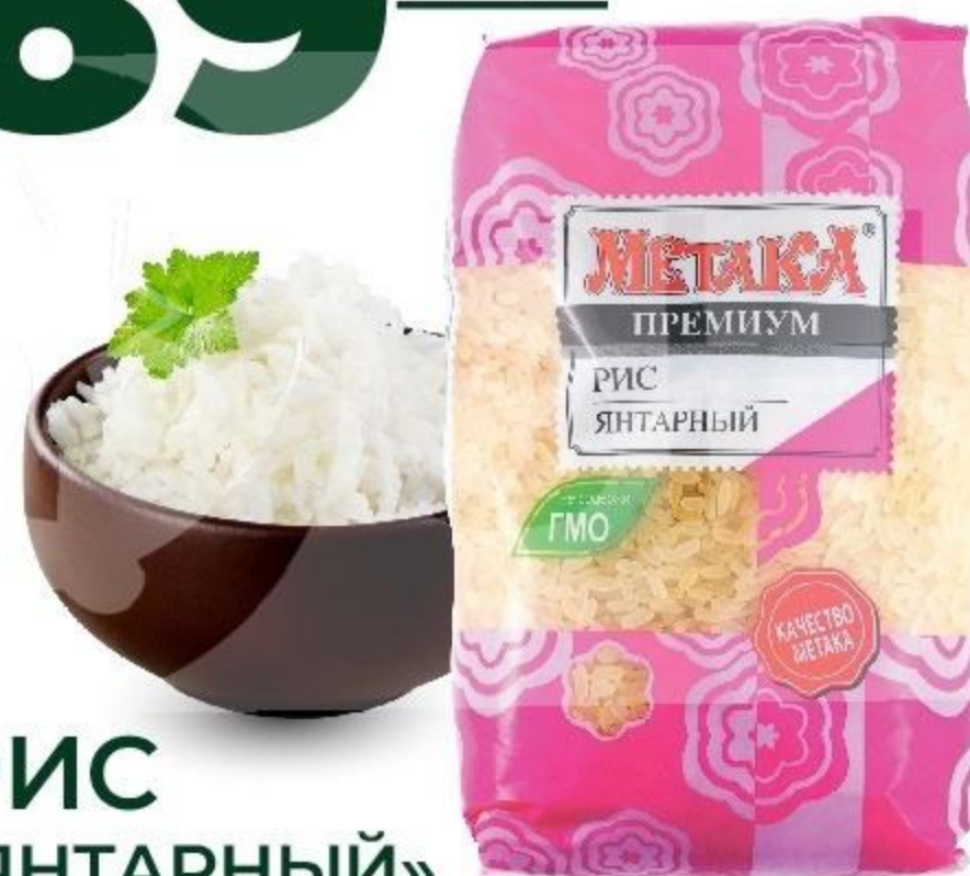
РИС «ЯНТАРНЫЙ», ТМ «МЕТАКА», 800 Г