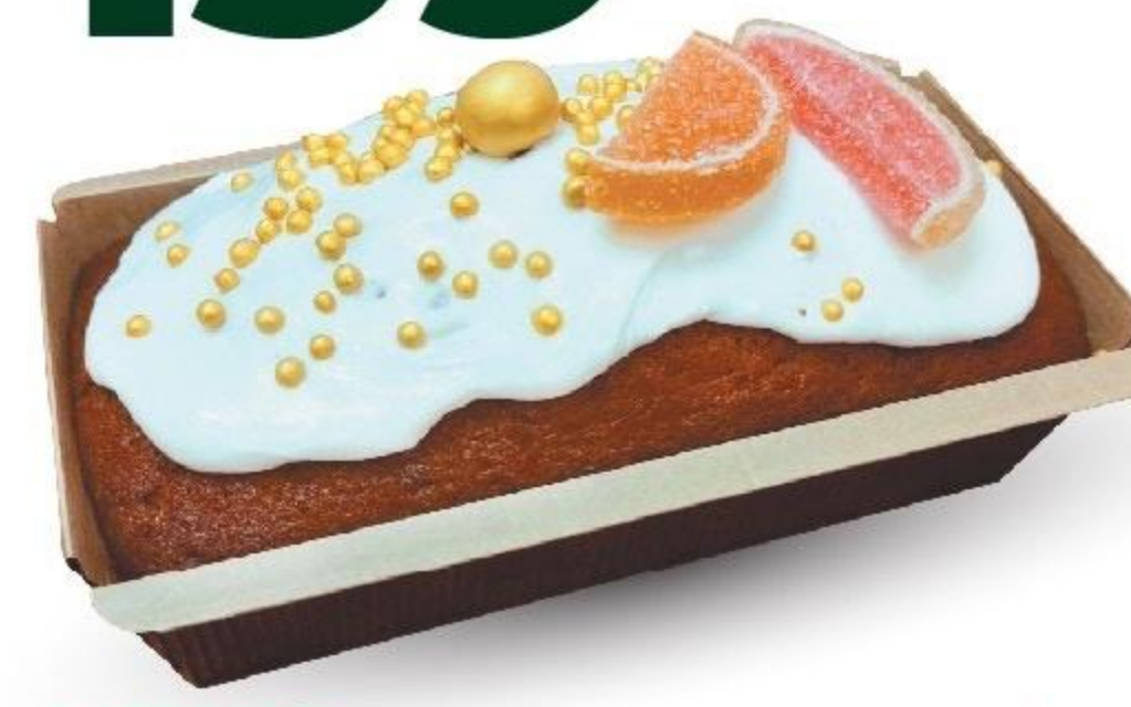
КЕКС «АПЕЛЬСИНОВЫЙ», 350 Г С МОРК. И ИМБИРЕМ