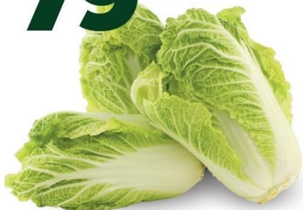
КАПУСТА «КИТАЙСКАЯ», 1 КГ