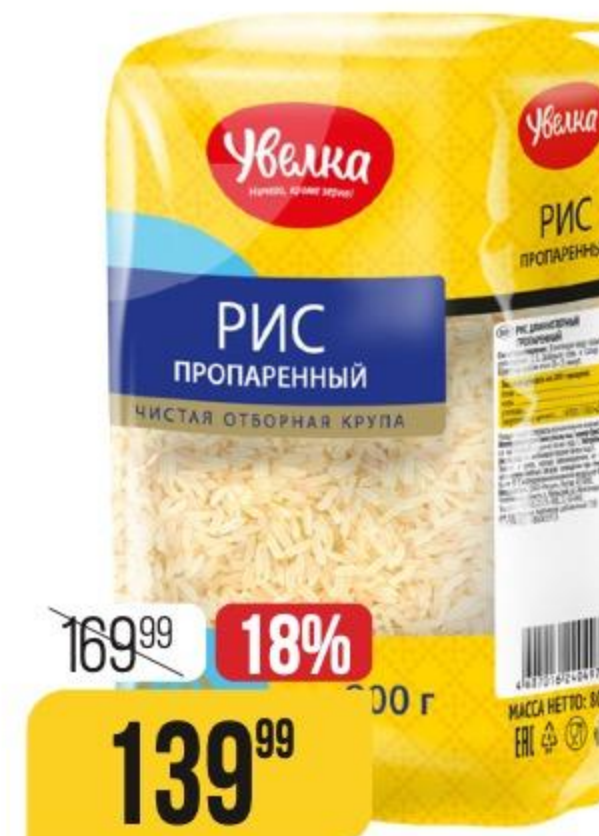
РИС ДЛИННОЗЕРНЫЙ пропаренный, Увелка, 800 г 145930

ФАСОЛЬ КРАСНАЯ для гарниров и супов, Мистраль, 450 г 131025