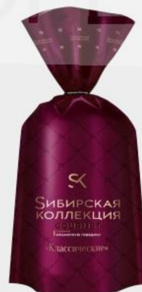
ПЕЛЬМЕНИ КЛАССИЧЕСКИЕ СИБИРСКАЯ КОЛЛЕКЦИЯ, 700 Г