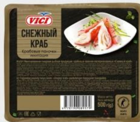
КРАБОВЫЕ ПАЛОЧКИ ВИЧИ СНЕЖНЫЙ КРАБ, 500 Г