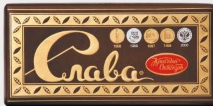
ШОКОЛАД СЛАВА ТЁМНЫЙ, 75 Г