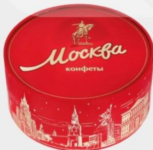
НАБОР КОНФЕТ МОСКВА, 200 Г