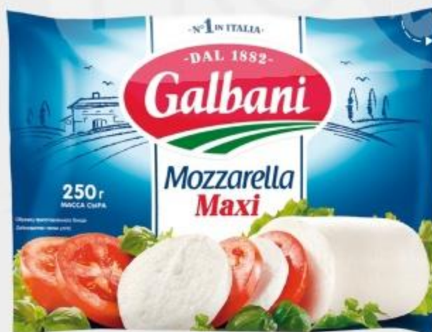
СЫР МОЦАРЕЛЛА ГАЛЬБАНИ 45%, 250 Г