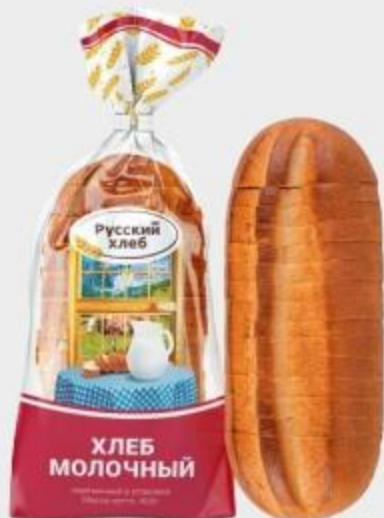
ХЛЕБ МОЛОЧНЫЙ РУССКИЙ НАРЕЗКА, 400 Г