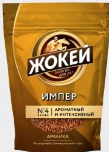
КОФЕ ЖОКЕЙ ИМПЕР АРАБИКА, 150 Г