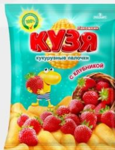
КУКУРУЗНЫЕ ПАЛОЧКИ КУЗЯ СО ВКУСОМ КЛУБНИКИ, 100 Г