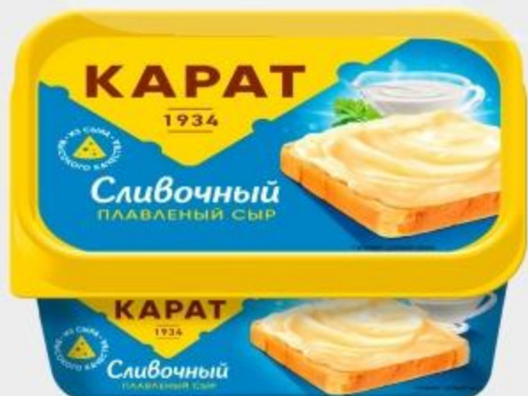
СЫР ПЛАВЛЕННЫЙ СЛИВОЧНЫЙ КАРАТ, 400 Г