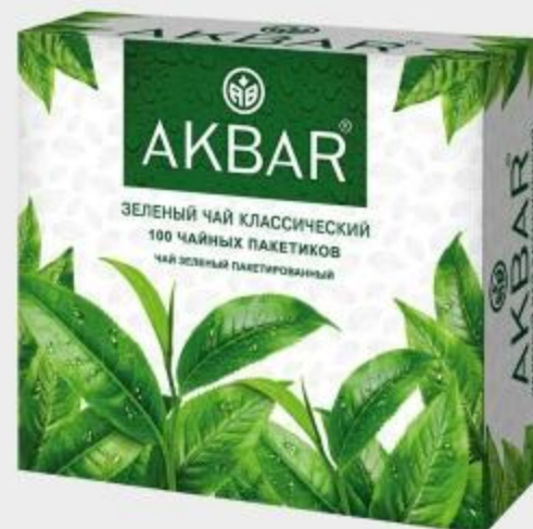
ЧАЙ ЗЕЛЁНЫЙ АКВАР КЛАССИЧЕСКИЙ МЕЛКИЙ, 100 ШТ. X 2 Г