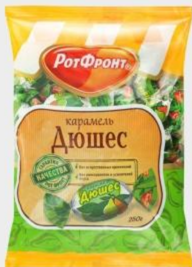
КАРАМЕЛЬ ДЮШЕС РОТФРОНТ, 250 Г