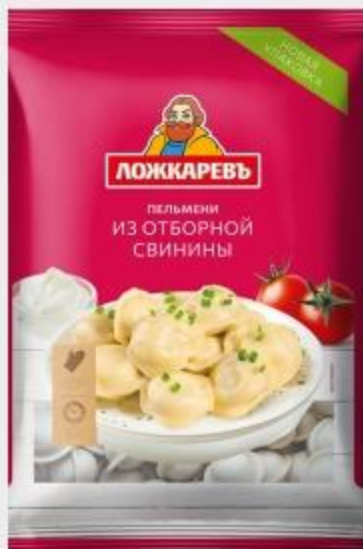
ЛОЖКАРЕВЬ ПЕЛЬМЕНИ ИЗ ОТБОРНОЙ СВИНИНЫ, 900 Г