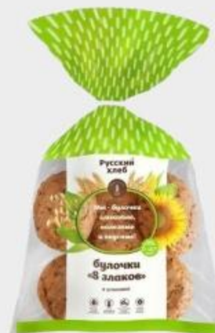
БУЛОЧКИ РУССКИЙ ХЛЕБ ЗЛАКОВЫЕ, 4 ШТ., 200 Г