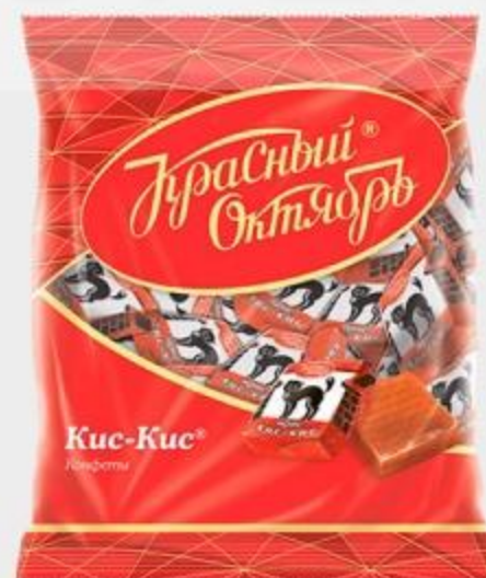
ИРИС КИС-КИС, 250 Г