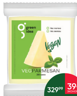
Продукт на основе крахмала GREEN IDEA со вкусом сыра пармезан, 200 г