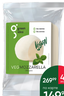
Продукт на основе крахмала GREEN IDEA со вкусом сыра моцарелла, 200 г