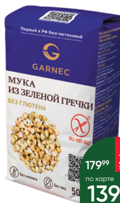
Мука GARNEC из зелёной гречки, без глютена, 500 г