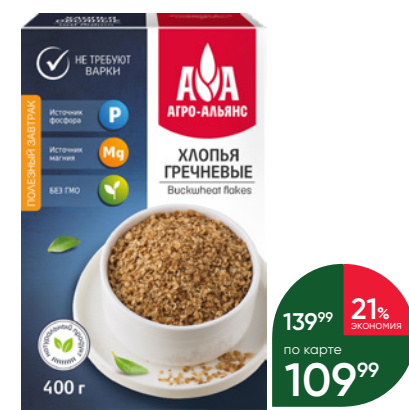
Хлопья АГРО-АЛИАНС гречневые, 400 г