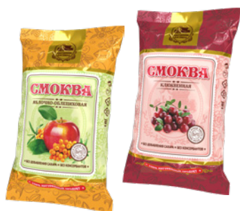
Смоква БАБУШКИНА ПАСТИЛА сливовая; клюквенная; яблочно-облепиховая, 50 г