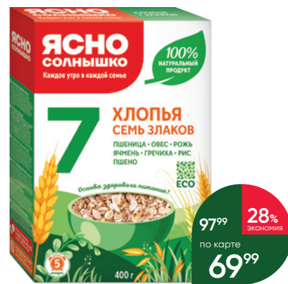
Хлопья ЯСНО СОЛНЫШКО 7 злаков, 400 г