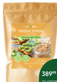
Дрожжи FOOD FORMULA пищевые неактивные сухие, 100 г