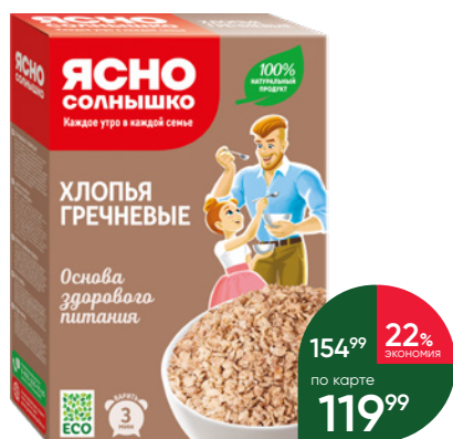
Хлопья ЯСНО СОЛНЫШКО гречневые, 375 г