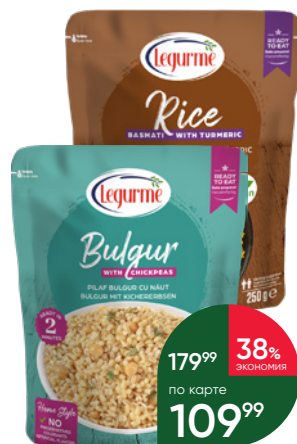
Гарнир LEGURME Булгур с нутом; Булгур с киноа; Рис басмати; Рис с овощами, 250 г