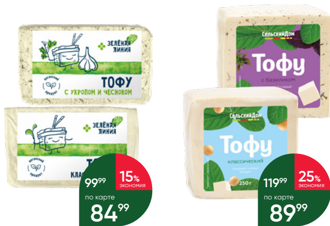
Тофу ЗЕЛЁНАЯ ЛИНИЯ Классический; с укропом и чесноком, 200 г