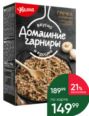
Гарнир УВЕЛКА Греча с грибами, 2 x 150 г