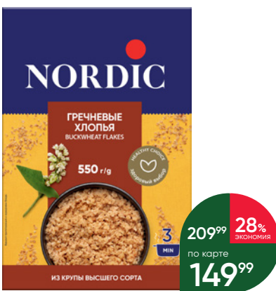
Хлопья NORDIC гречневые, 550 г