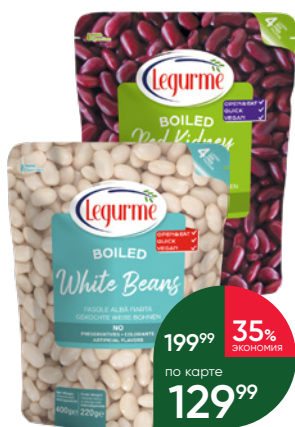
Фасоль LEGURME белая отварная; красная отварная; красная в мексиканском соусе; борлотти в томатном соусе, 400 г