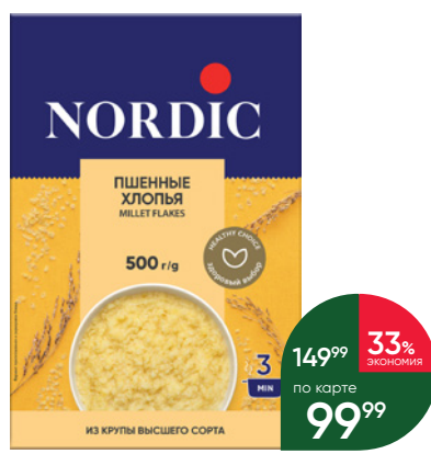
Хлопья NORDIC пшеничные, 500 г