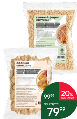
Мука соевая GREEN WISE Соевый шницель, текстурированная; Соевый фарш крупный, текстурированная; Соевый бефстроганов, текстурированная, 150 г