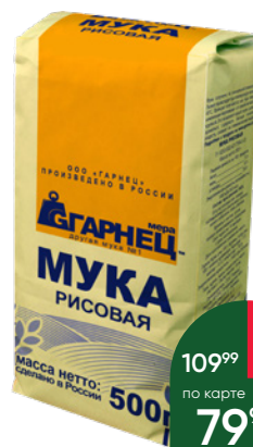
Мука GARNEC рисовая, 500 г