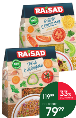
Гарнир RAISAD Булгур с овощами от шеф-повара; Греча с овощами По-домашнему; Чечевица с овощами от шеф-повара, 200 г