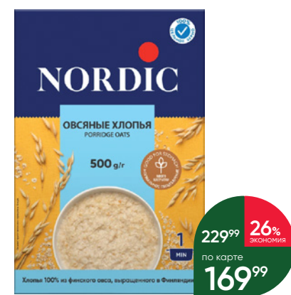
Хлопья NORDIC овсяные, 500 г