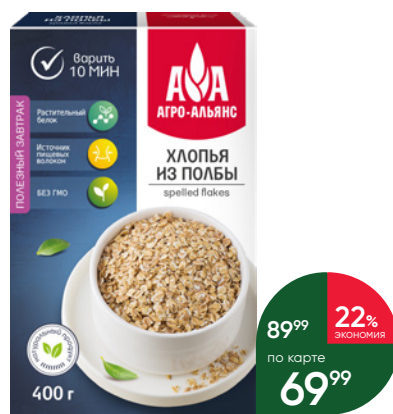
Хлопья АГРО-АЛИАНС из полбы, 400 г