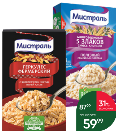
Хлопья МИСТРАЛЬ овсяные Геркулес Фермерский цельнозерновой; 5 злаков, 400 г