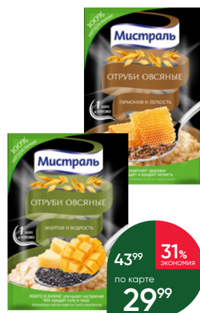
Отруби овсяные МИСТРАЛЬ Энергия и бодрость с манго, ананасом и чиа; Гармония и лёгкость с мёдом и льном; Баланс и тонус с персиком, абрикосом и льном, 30 г