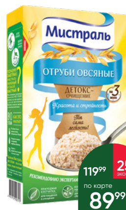
Отруби МИСТРАЛЬ овсяные, 400 г