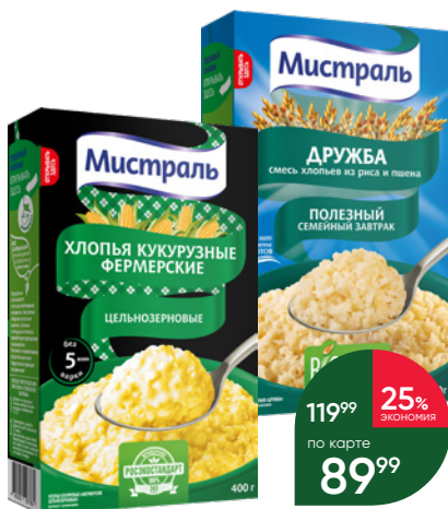
Хлопья МИСТРАЛЬ гречневые; кукурузные Фермерские цельнозерновые; смесь Дружба, 400 г