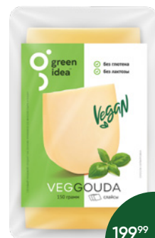
Продукт на основе крахмала GREEN IDEA со вкусом сыра гауда, нарезка, 150 г