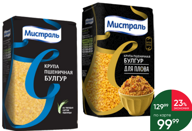
Крупа МИСТРАЛЬ Булгур пшеничная; Булгур пшеничная для плова, 500 г