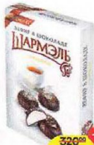
Зефир ШАРМЭЛЬ, классический, в шоколаде, 250 г