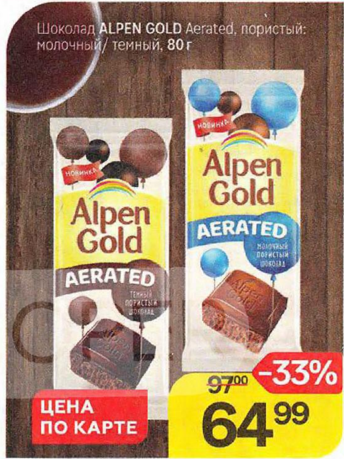
Шоколад ALPEN GOLD Aerated, пористый: молочный/ темный, 80 г