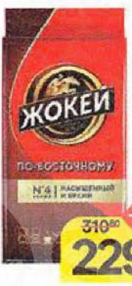
Кофе ЖОКЕЙ, По-восточному, молотый, 250 г