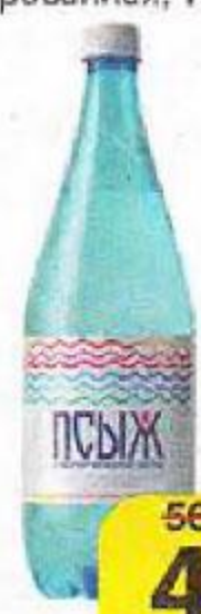
Вода минеральная ПСЫЖ, лечебная-столовая, природная газированная, 1 л