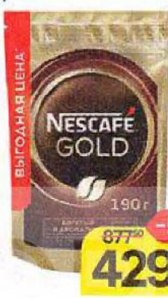
Кофе NESCAFE® Gold, растворимый сублимированный, 190 г