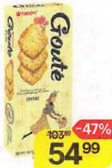
Печенье GOUTE, 72 г