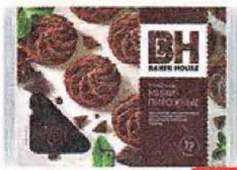
Мини-пирожные BAKER HOUSE, Трюфельные, 240 г