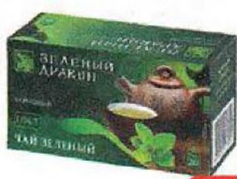
Чай зеленый ЗЕЛЕНЫЙ ДРАКОН, китайский, 20 пакетиков