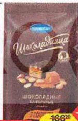
Конфеты ШОКОЛАДНИЦА шоколадные, вафельные, арахис-карамель (Коломенский), 160 г