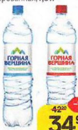
Вода минеральная ГОРНАЯ ВЕРШИНА, Негазированная/ Газированная, 1,5 л