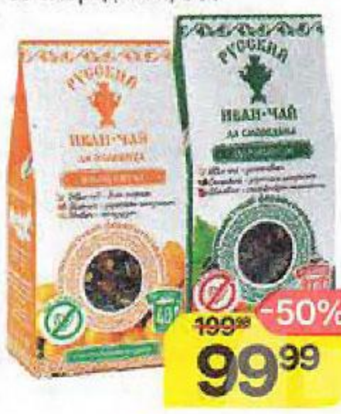
Чай РУССКИЙ ИВАН-ЧАЙ крупнолистовой: с облепихой/ со смородиной, 50 г