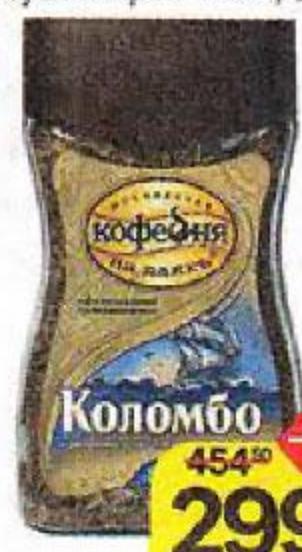
Кофе МОСКОВСКАЯ КОФЕЙНЯ НА ПАЯХЪ, Коломбо, натуральный, сублимированный, 95 г