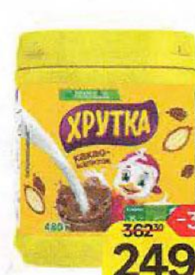
Какао-напиток ХРУТКА, растворимый, 480 г