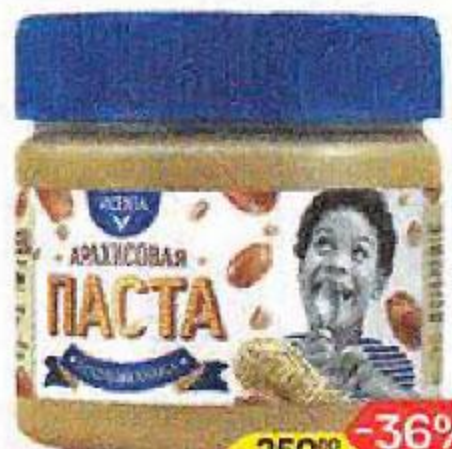
Паста арахисовая VICENTA, с кусочками арахиса, 250 г