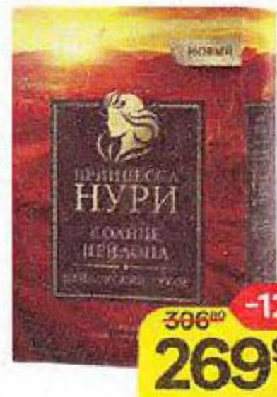
Чай черный ПРИНЦЕССА НУРИ Солнце Цейлона, 250 г