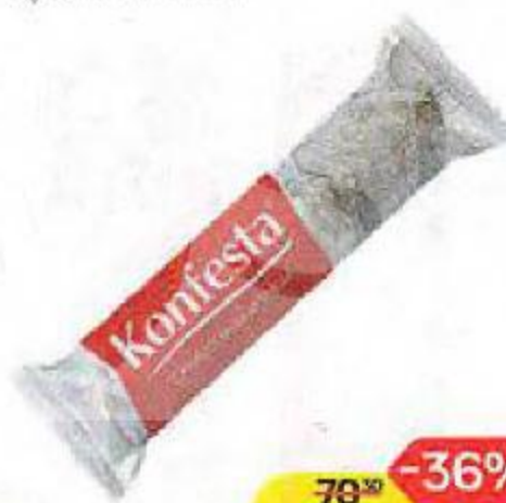
Конфеты KONFESTA, глазированные, с кокосовым кремом, 100 г