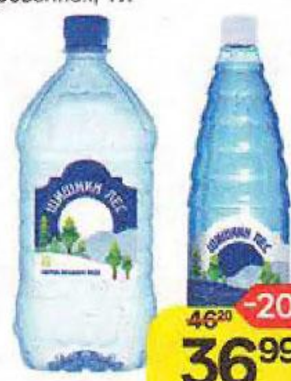
Вода питьевая ШИШКИН ЛЕС, Газированная/ Негазированная, 1 л