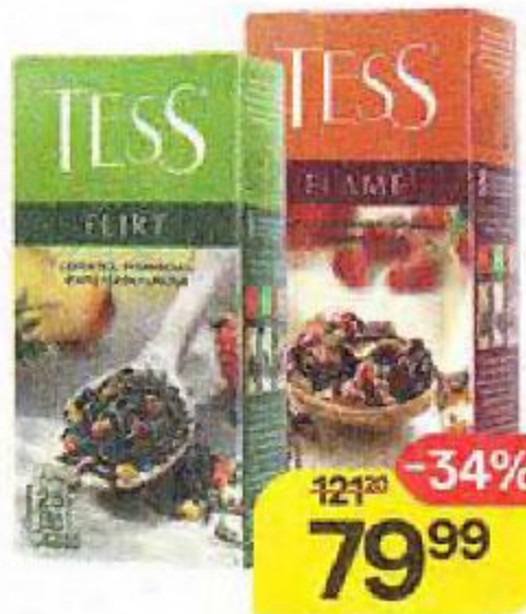
Чай зеленый TESS®, Флирт/ Флейм/ Плэжа, 25 пакетиков