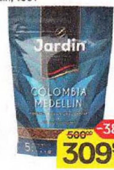
Кофе JARDIN Колумбия Меделлин, сублимированный, 150 г