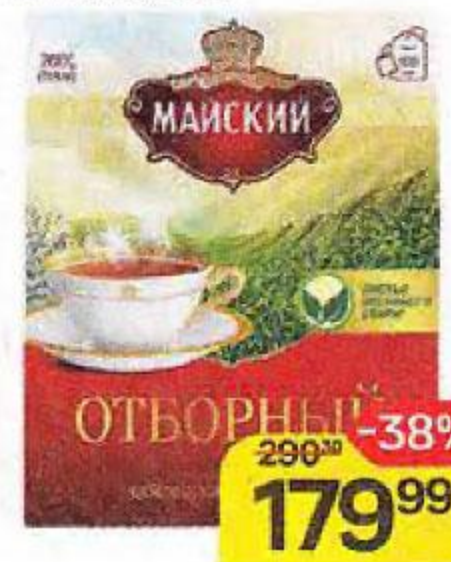
Чай черный МАЙСКИЙ, Отборный, цейлонский, 100 пакетиков