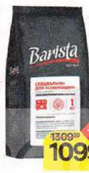
Кофе BARISTA Pro Bar, натуральный, в зернах, 1 кг