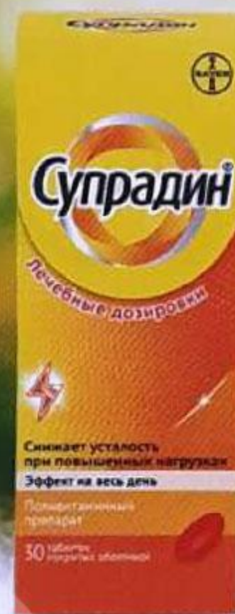
ТАБЛ. П. О. №30 П №016098/01