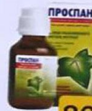
ТАБЛ. П. О. №60 П N013320/01