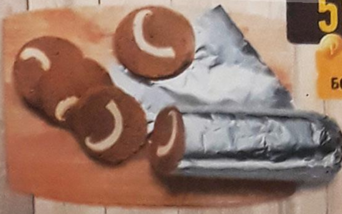
КОЛБАСА «СЕРВЕЛАТ» варёно-копчёная