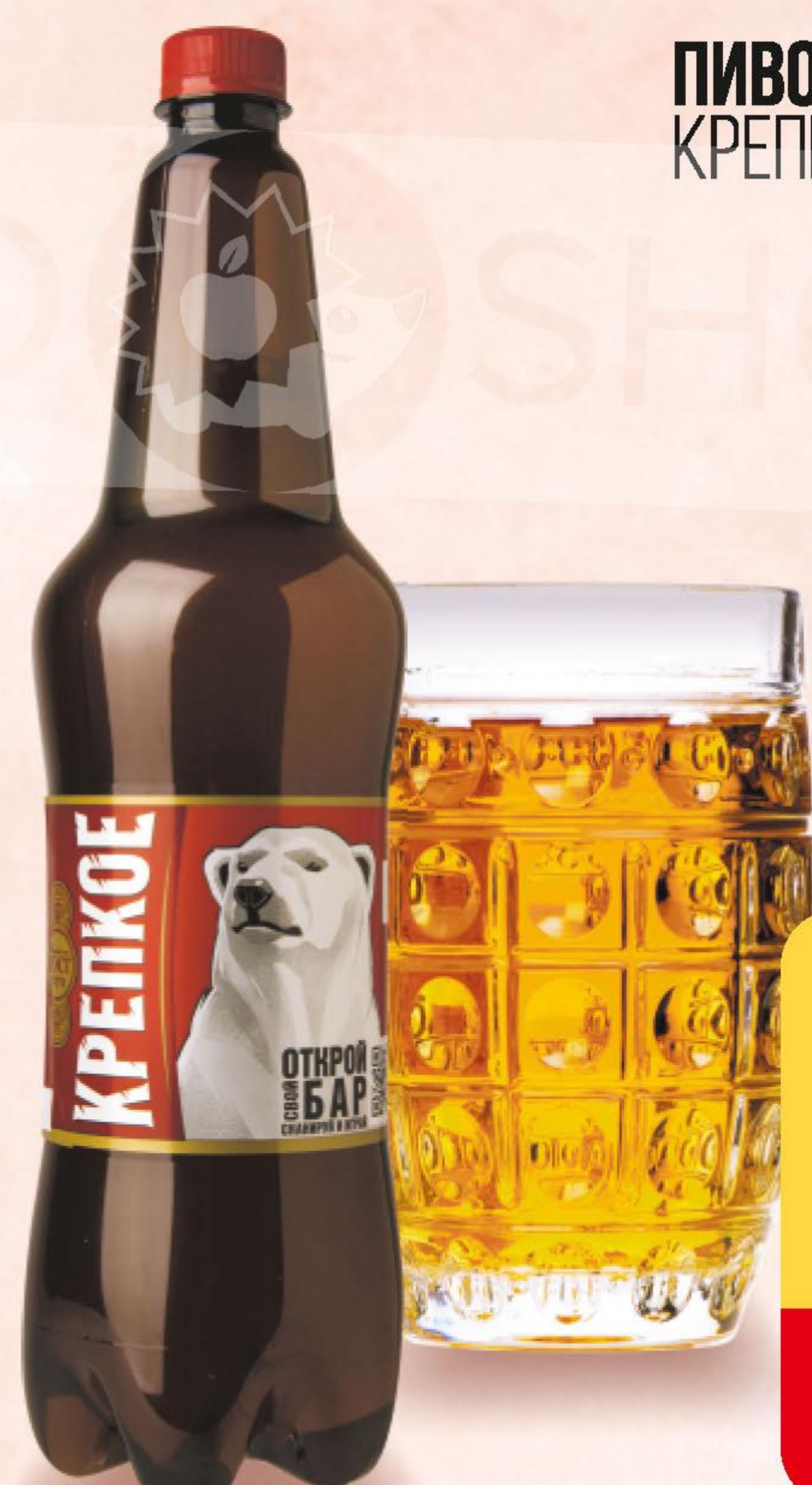
ПИВО БЕЛЫЙ МЕДВЕДЬ, КРЕПКОЕ, СВЕТЛОЕ, 1,15 Л