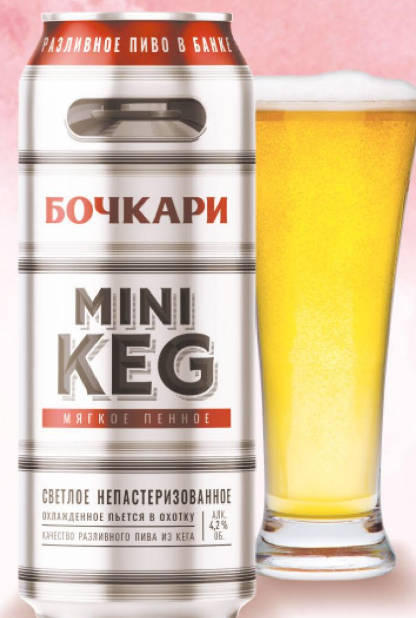
ПИВО МИНИ КЕГ, СВЕТЛОЕ, 0,45 Л