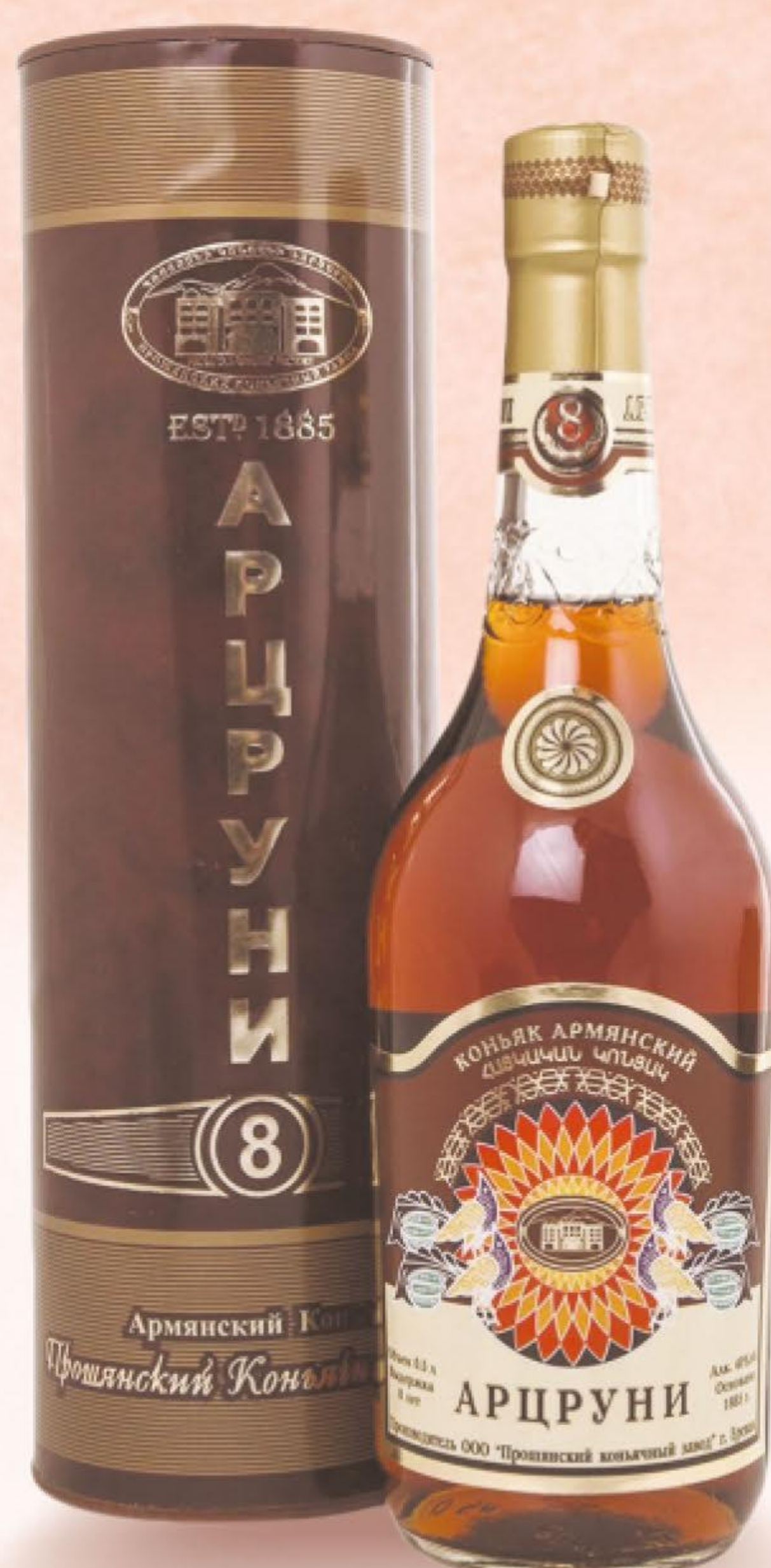
КОНЬЯК АРЦРУНИ, В ТУБЕ, 8-ЛЕТНИЙ, 0,5 Л