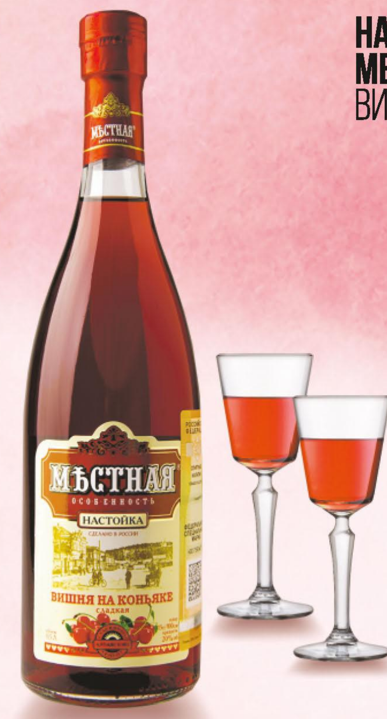
НАСТОЙКА МЕСТНАЯ ОСОБЕННОСТЬ, ВИШНЯ НА КОНЬЯКЕ, 0,5 Л