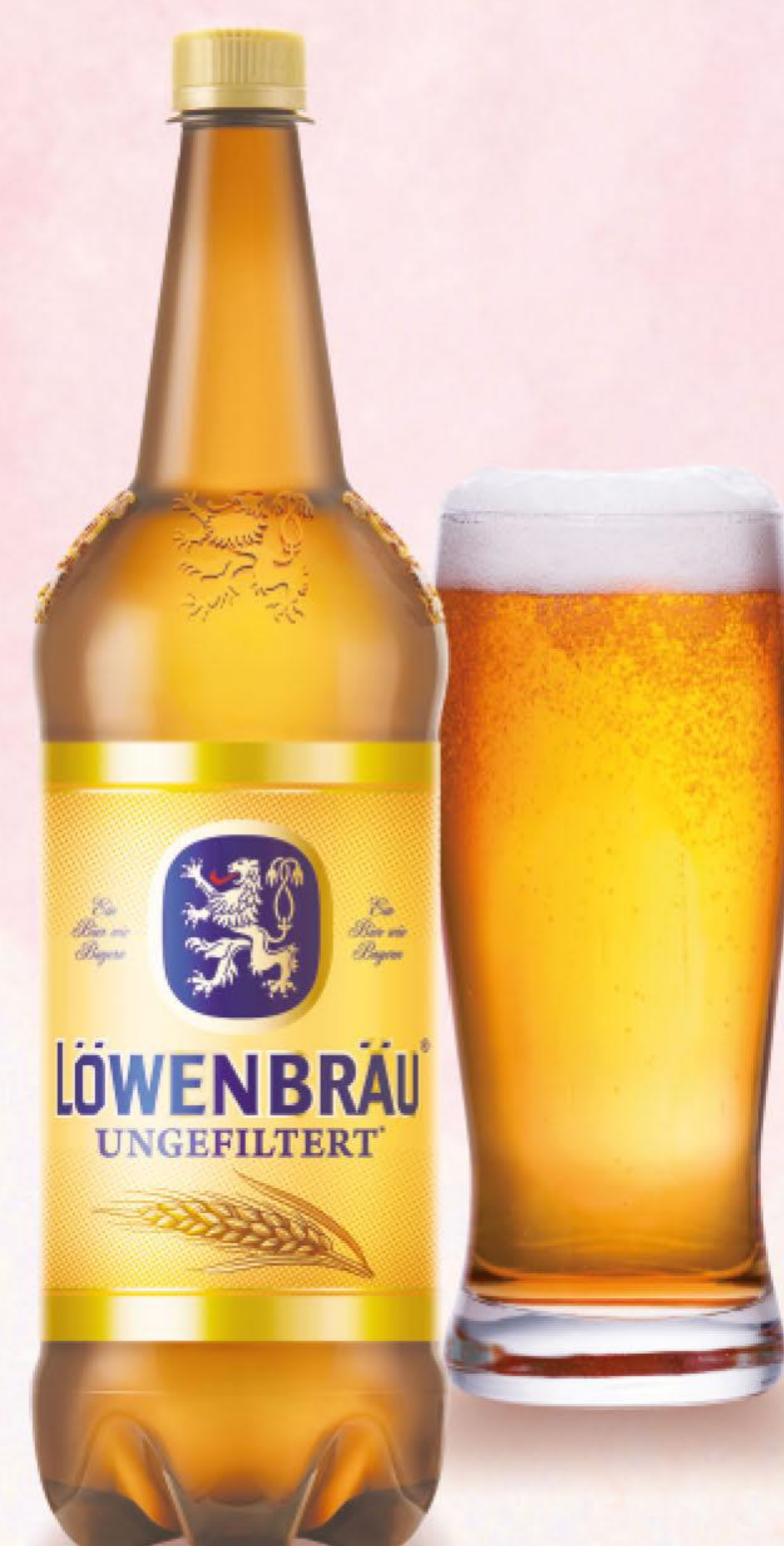
ПИВО ЛОВЕНБРАУ, НЕФИЛЬТРОВАННОЕ, СВЕТЛОЕ, 1,3 Л