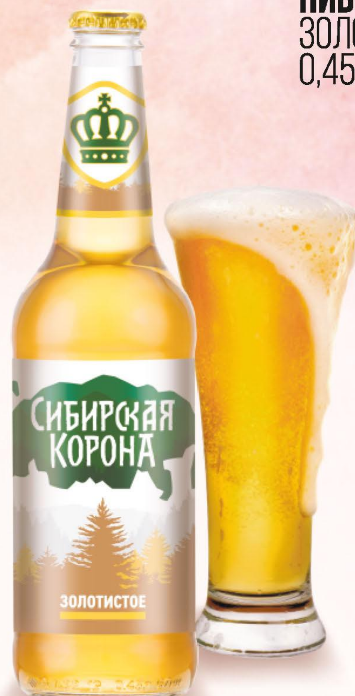
ПИВО СИБИРСКАЯ КОРОНА, ЗОЛОТИСТОЕ, СВЕТЛОЕ, 0,45 Л