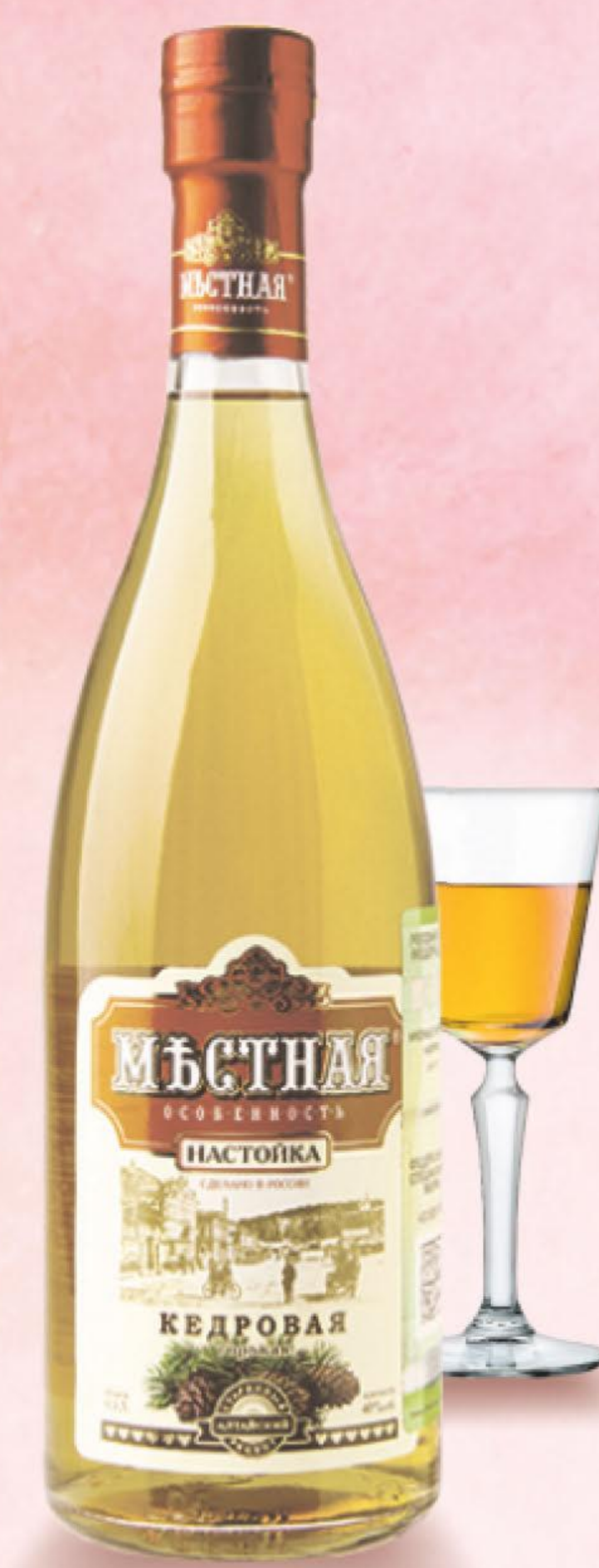
НАСТОЙКА МЕСТНАЯ ОСОБЕННОСТЬ, КЕДРОВАЯ, 0,5 Л