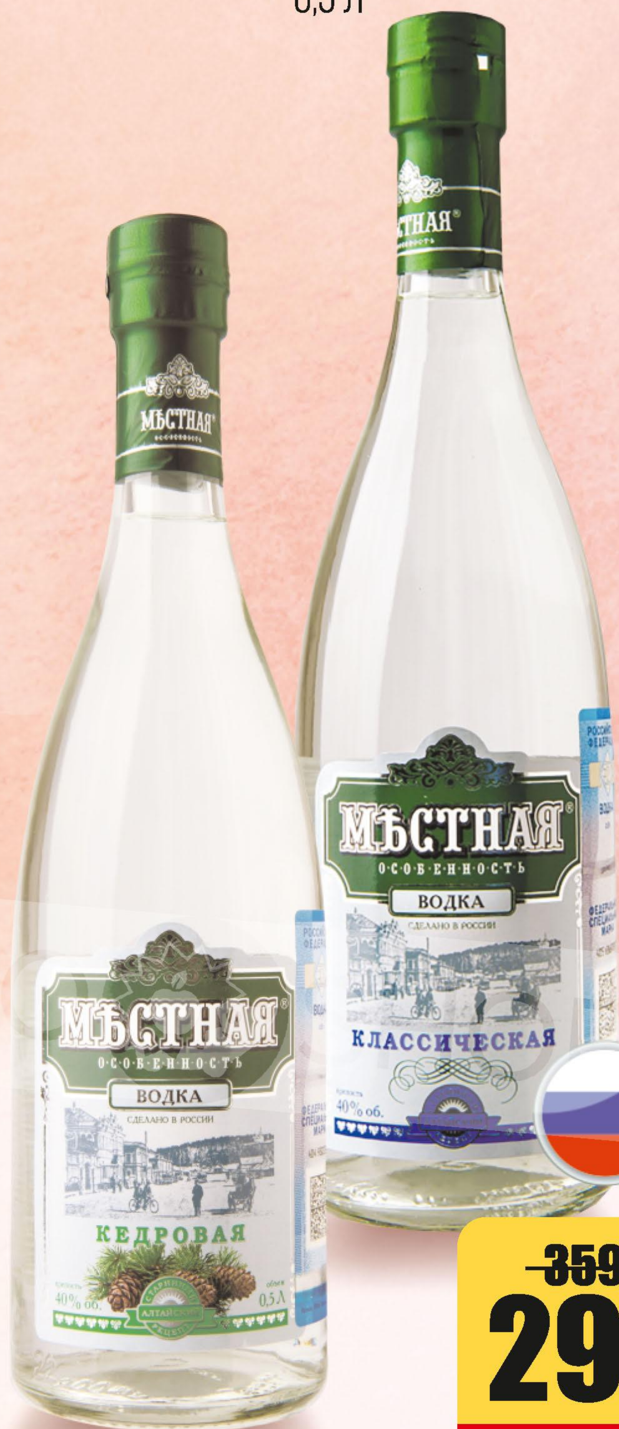
ВОДКА МЕСТНАЯ ОСОБЕННОСТЬ, КЛАССИЧЕСКАЯ, КЕДРОВАЯ, 0,5 Л