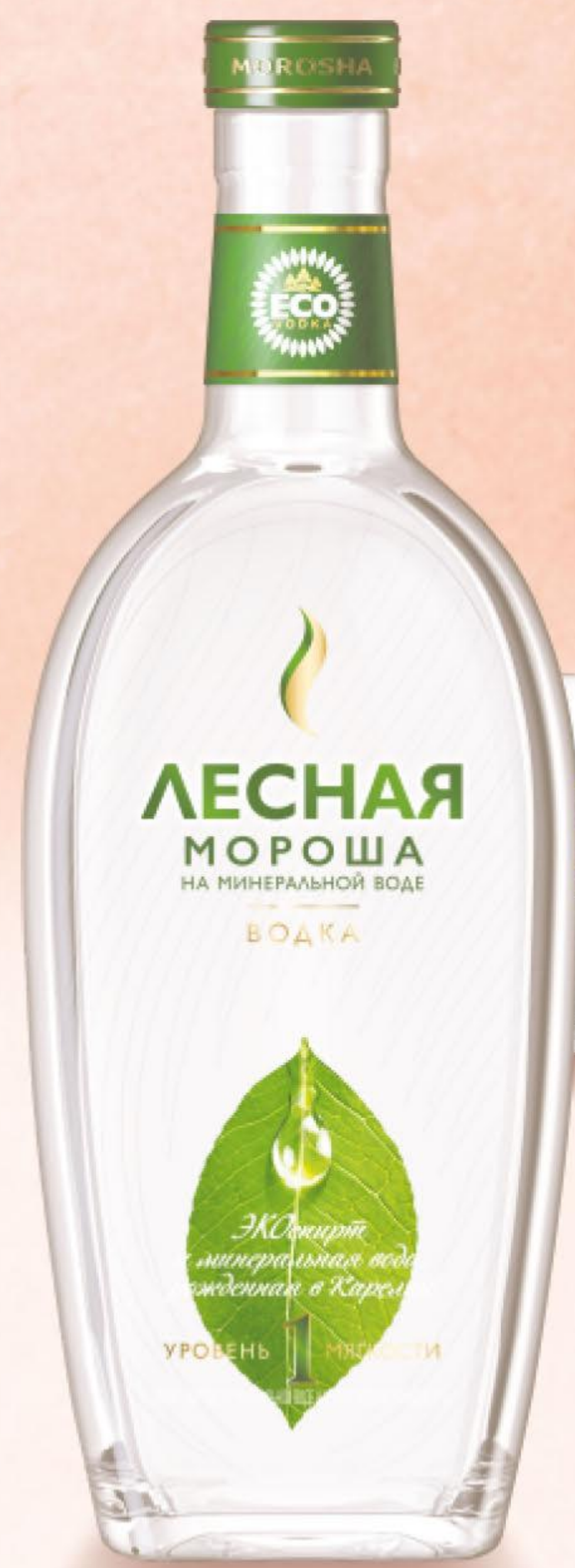
ВОДКА МОРОША, НА МИНЕРАЛЬНОЙ ВОДЕ КАРЕЛИИ, 0,5 Л