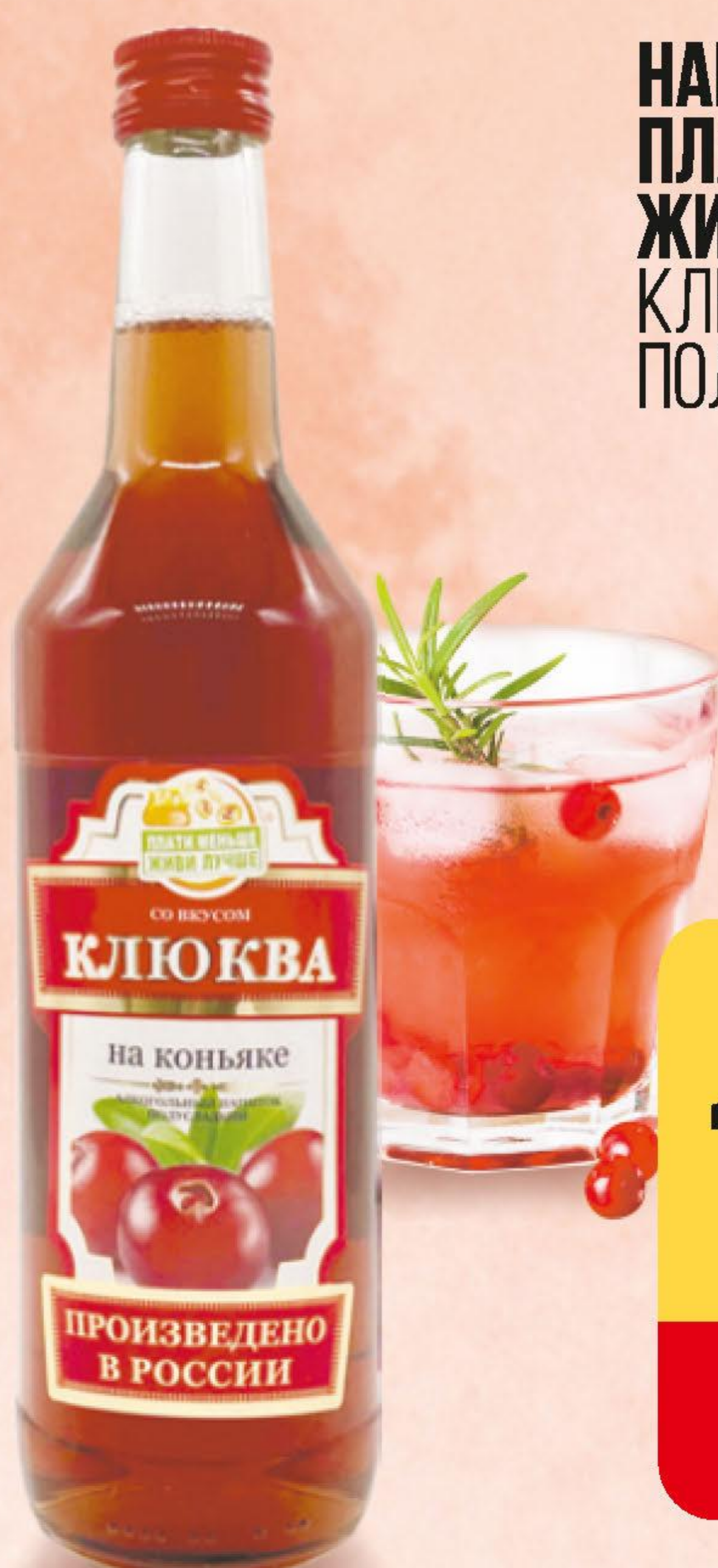
НАПИТОК ПЛОДОВЫЙ ПЛАТИ МЕНЬШЕ - ЖИВИ ЛУЧШЕ, КЛЮКВА НА КОНЬЯКЕ, ПОЛУСЛАДКИЙ, 0,5 Л