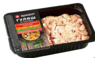
Гуляш из свинины в сливочно-нежном маринаде, 400 г