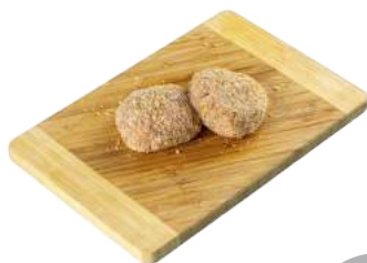
Биточки «Нежные» с сыром, 1 кг