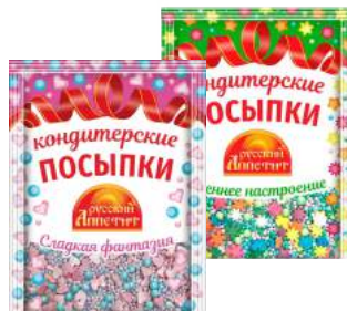
Посыпка кондитерская «Русский Аппетит» в ассортименте