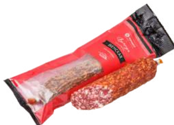
Венская колбаса 200 г