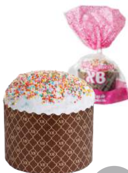
Кулич Выбор Лакомки 100 г