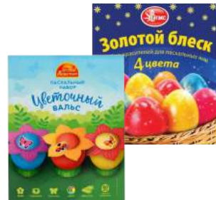
Пасхальный набор с пищевыми красителями в ассортименте