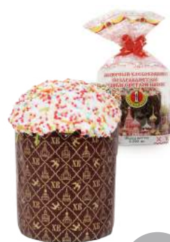
Кулич Воскресный 200 г