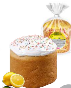
Кулич Лимончики 350 г