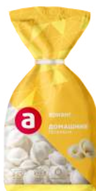
Пельмени Домашние 800 г