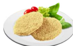
Котлеты Домашние 1 кг