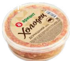
Холодец Домашний 500 г