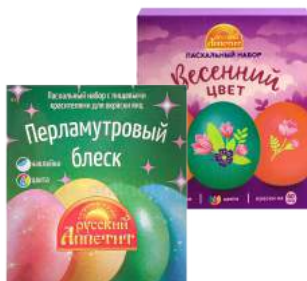
Пасхальный набор с пищевыми красителями и наклейками в ассортименте