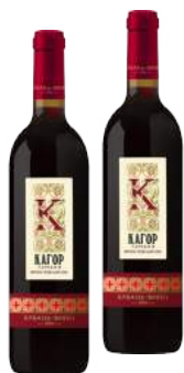
Вино десертное Кагор Тамани красное, 16%, 0,7 л