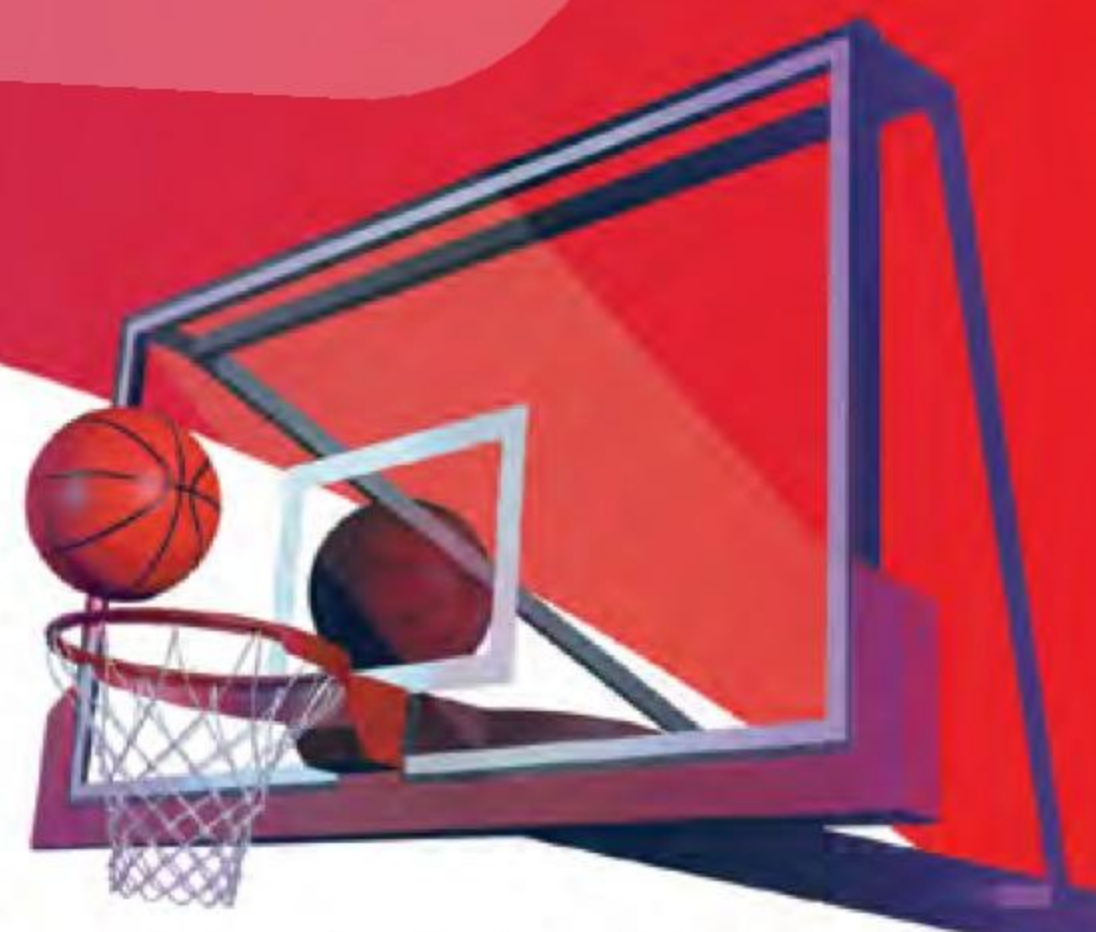
2 гранта по 1 000 000 рублей на спортивные площадки для школ****