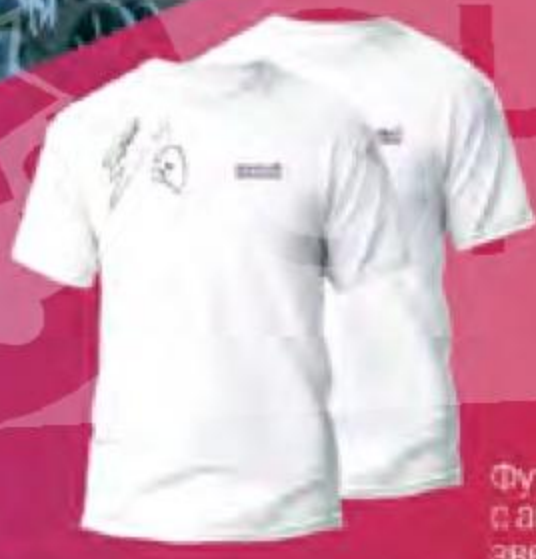
Футболки с автографами звезд