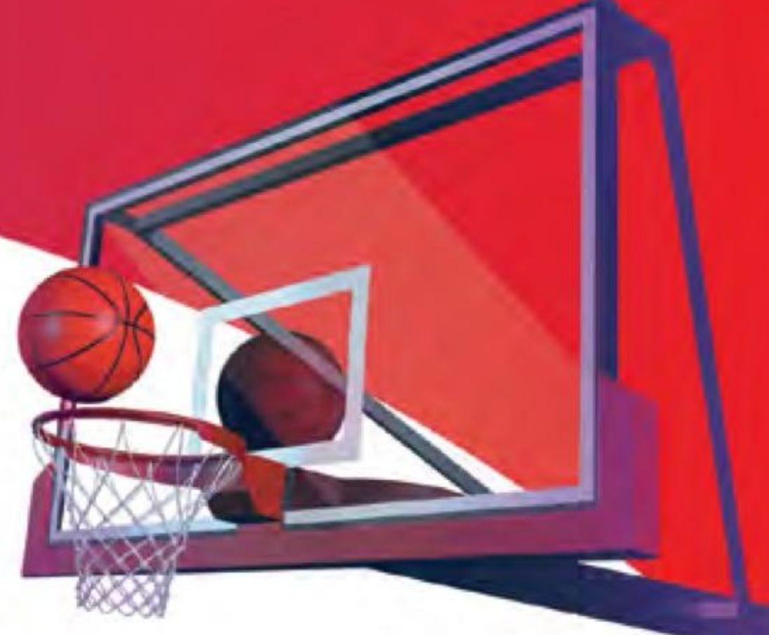
2 гранта по 1 000 000 рублей на спортивные площадки для школ****