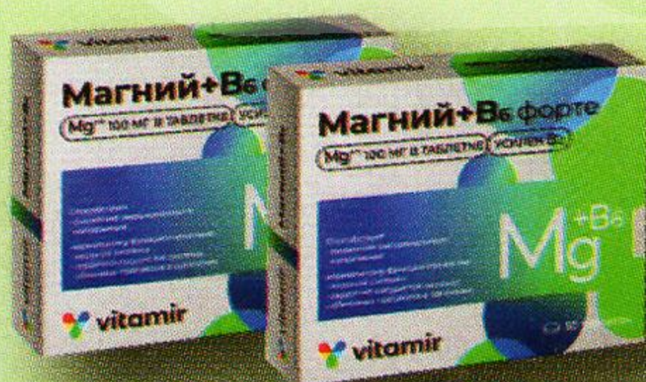
Витамир Магний + B6 форте таб. №30