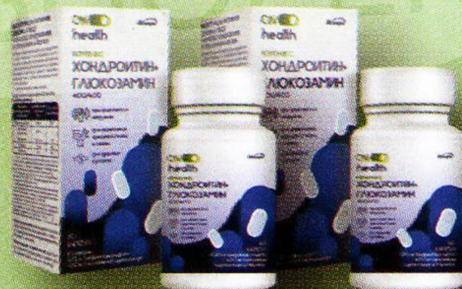
Комплекс Хондроитин и глюкозамин капс. №60