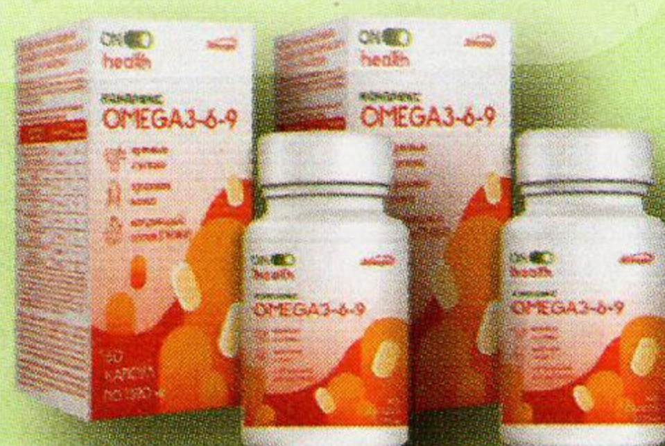
Омега 3-6-9 капс. №60