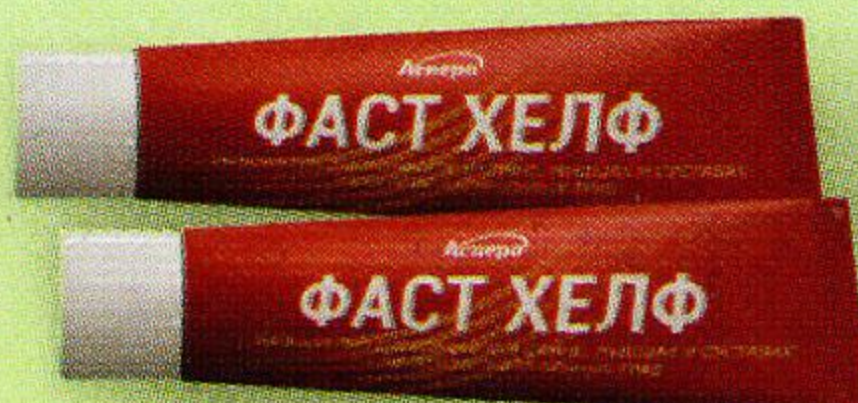
Фаст Хелф бальзам д/тела 50 г