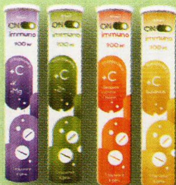
Аскорбинка 900 мг №17 в асс.