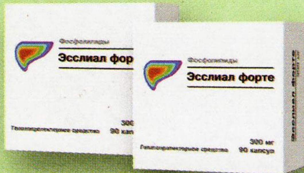
Эсслиал Форте капс 300 мг №90