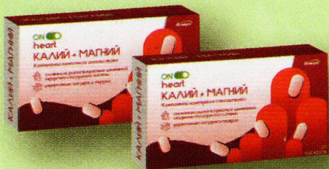
Калий магний таб. №30